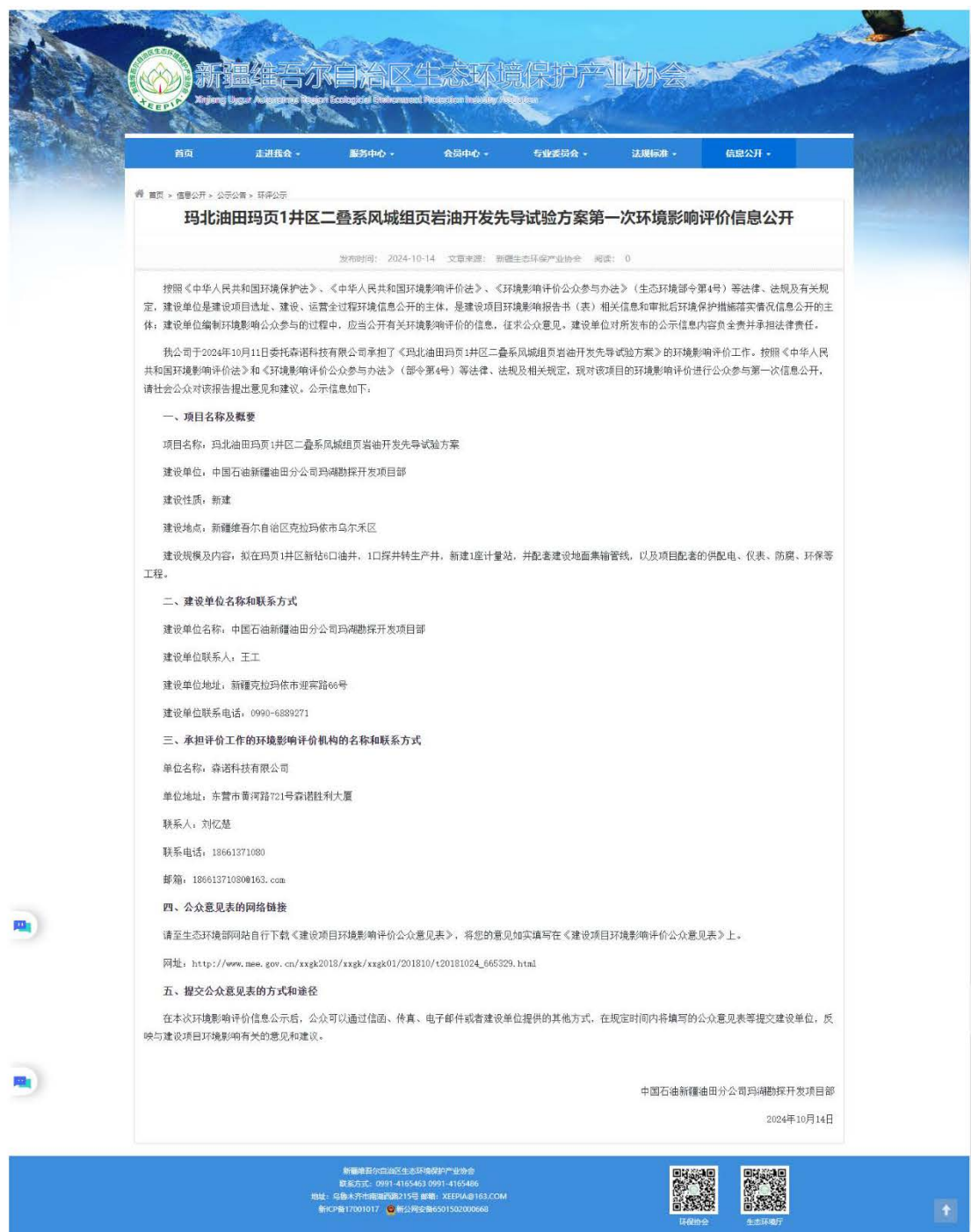
图 1 环境影响评价信息首次公示截图

本项目首次环境影响评价信息公开方式采用网络公示的方式。公开网址：新疆维吾尔自治区生态环境保护产业协会官网 ( http://www.xjhbcy.cn/ )，网址截图见图 1。