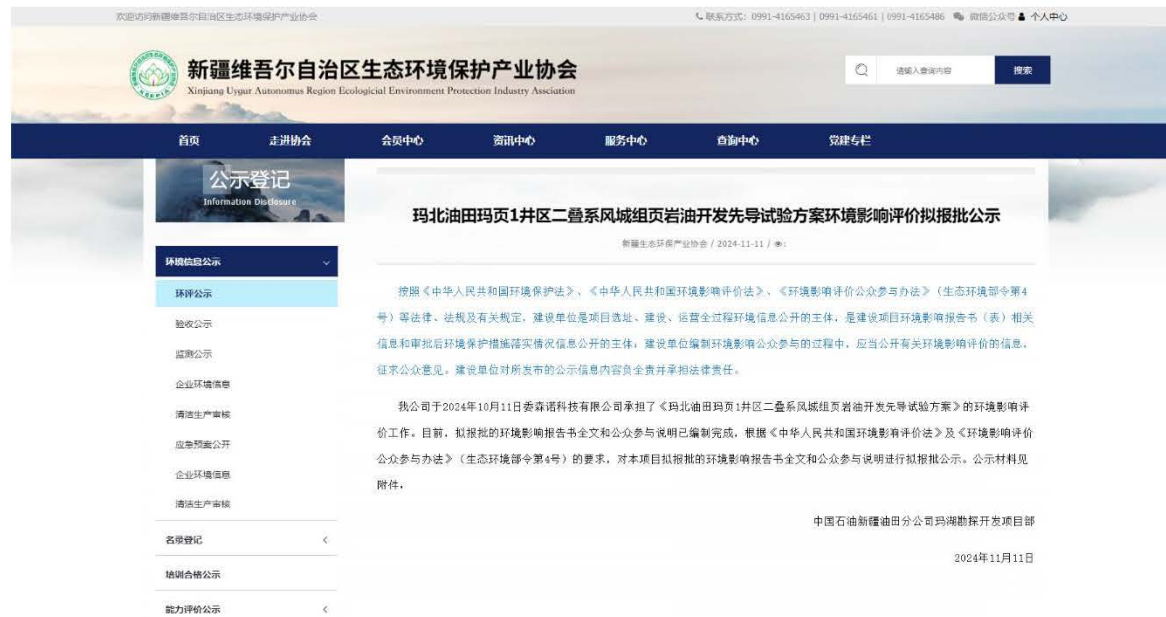
图6 环境影响评价报批前公示