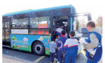
10月22日,玛纳斯县的学生正在排队乘坐“护苗”主题公交车。 □丁慧琴

本报讯 通讯员丁慧琴、曹彩霞报道:10月22日,玛纳斯县“护苗”主题公交车“上线”。