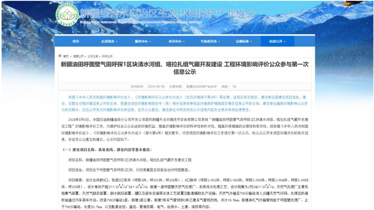
图 1 本项目第一次网络公示截图