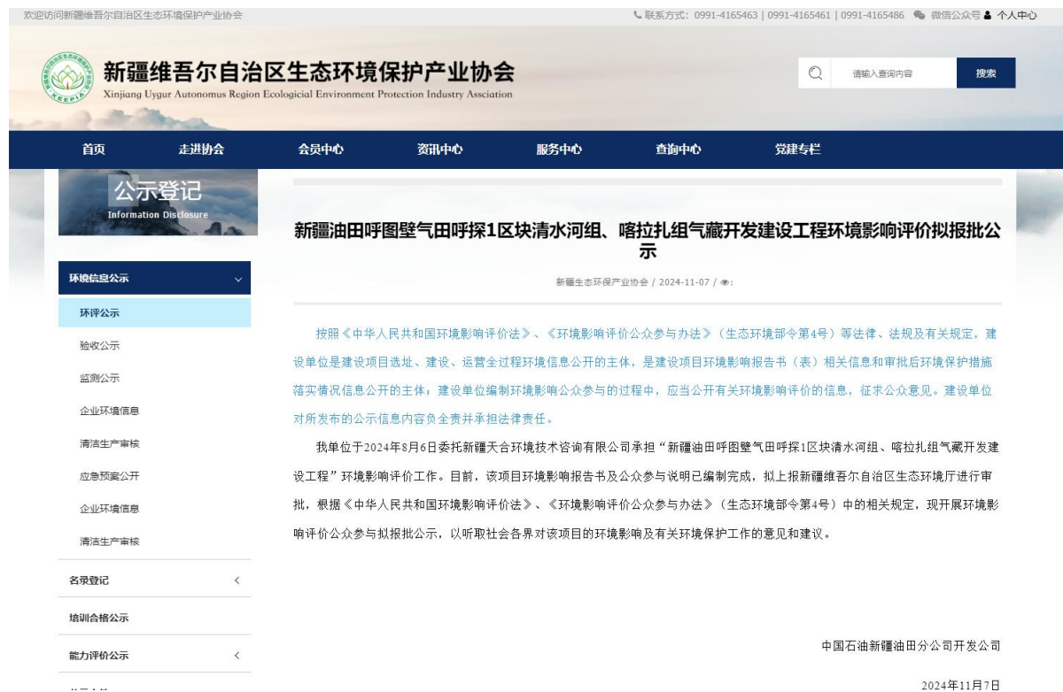
图 6 本工程拟报批稿网络公示截图

征求意见稿及其网络公众意见调查表的相关信息。公告网址： http://www.xjhbcy.cn/articles/show/4565?is_preview=1&type=announce 。