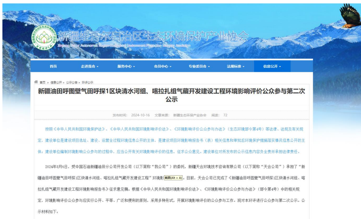
图 2 本项目征求意见稿网络公示截图