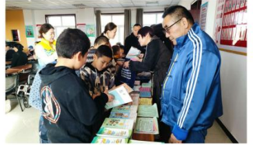
10月26日,在昌吉市阿什里乡多金湾坝村村委会活动室,村民正在领取图书和宣传手册。

本报讯 记者蒋荷·马汗泪报道:10月26日,昌吉市阿什里乡多金湾坝村村委会的会议室里热闹非凡,昌吉市委统战部、盟盟昌吉市支部在此开展了主题为“铸牢中华民族共同体意识”的社会服务活动。