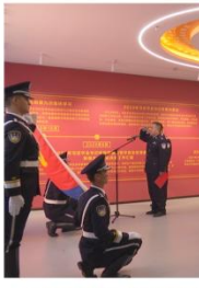
10月24日，在“人民公安从这里走来”主题宣传活动启动仪式上，昌吉市公安局民警重温入党誓词。

本报讯 通讯员宋楠楠报道：为进一步加强公安队伍忠诚教育，传承人民公安革命传统，10月24日，昌吉市“人民公安从这里走来”主题宣传活动启动仪式在昌吉市锦华中华民族共同体意识主题公园举行。