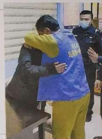
今年1月，小帕和小苏在民警的调解下...

申请让黄某与妻通话，商量还款事宜。一方面肯定黄某的还款态度和尽快解决欠款意愿，鼓励其主动与妻子沟通，共同商量还款事宜。另一方面，民警发现黄某对正妻和岳母，他们做通了黄某女儿的思想工作，黄某同意还款协议。 不久前，民警调解中，黄某妻子和岳母也愿意还款了，黄某也愿意还款，黄某妻子和岳母也愿意还款了，黄某也愿意还款了。 如今，乌鲁木齐市第一拘留所发挥的作用，得到基层法院的认可，该院建立社会矛盾化解工作协作机制。