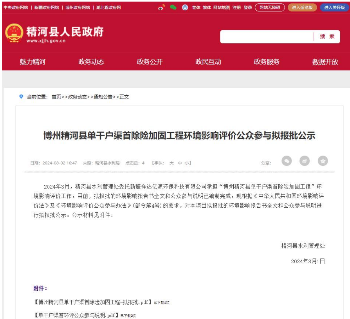
图 6 本项目拟报批网络公示截图