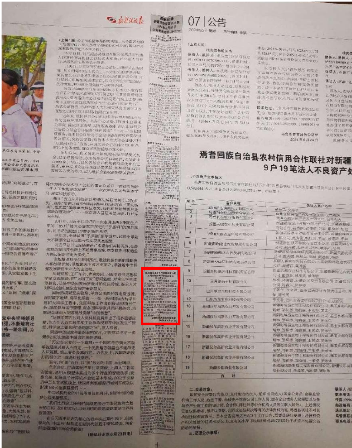
图4 本项目第二次报纸公示照片