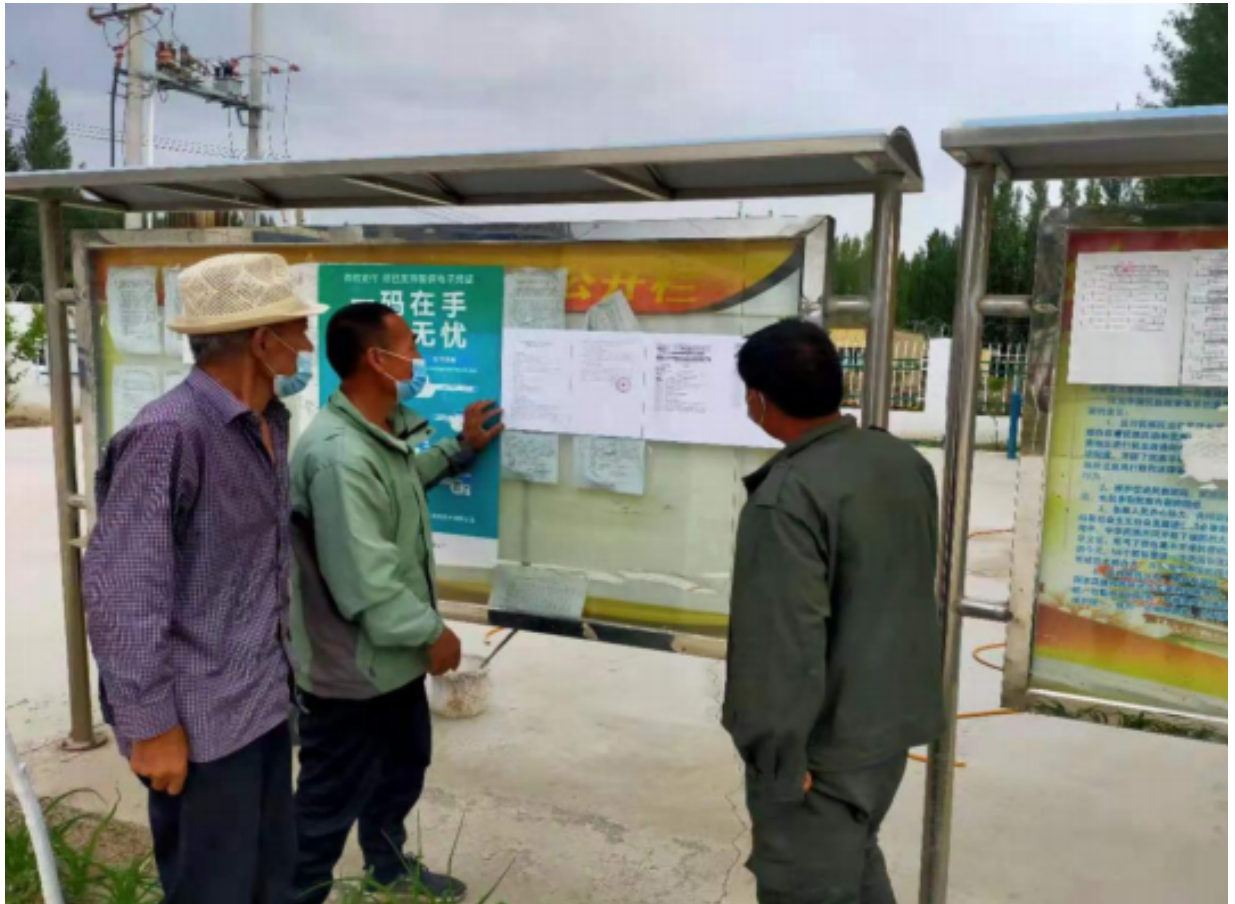
图5 公告栏张贴公示