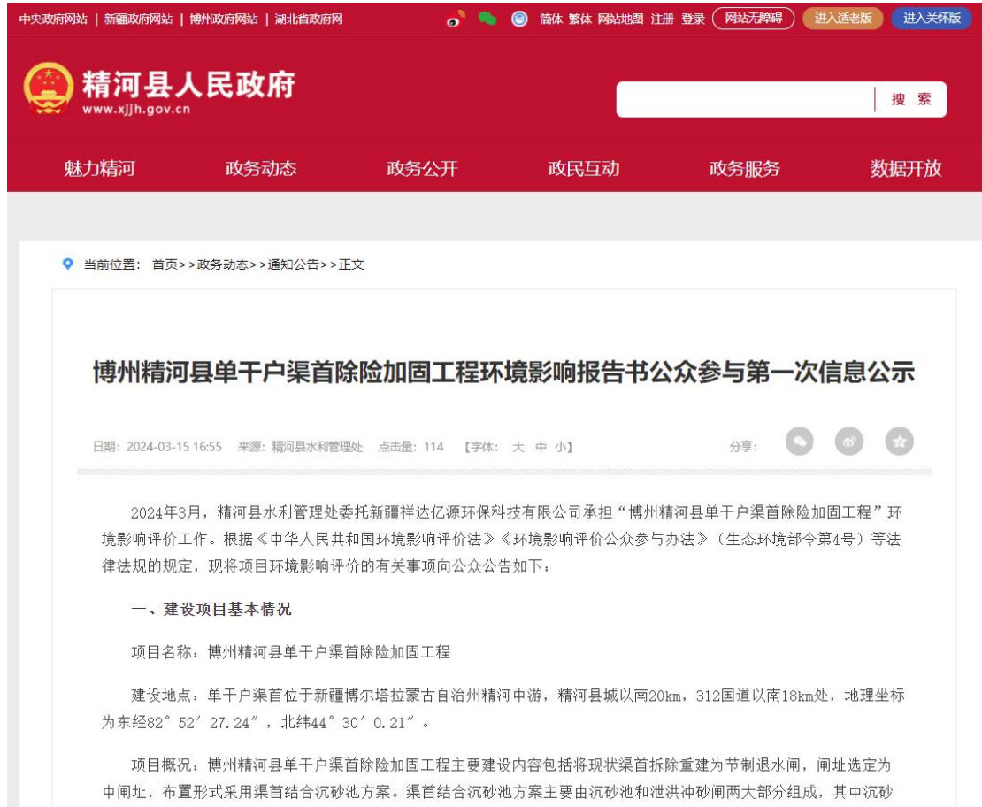
图1 本项目第一次网络公示截图

众告知本项目的建设情况。精河县水利管理处在精河县人民政府网站开展网络公示，载体选择符合《环境影响评价公众参与办法》要求。网络公示截图见图1。