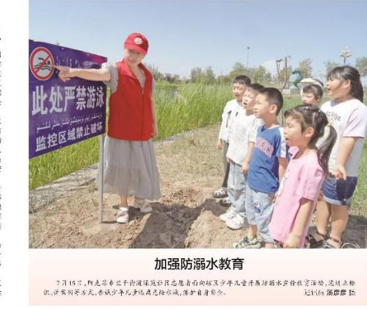
加强防溺水教育。7月15日,阿克苏市青少年游泳队教练员向青少年普及防溺水知识,提高自救互救能力。

本报阿克苏讯(记者 魏晓 通讯员 王明) 为增强青少年防溺水安全意识,提高自救互救能力,阿克苏地区消防支队联合教育局,开展了一场消防直播说溺水活动。