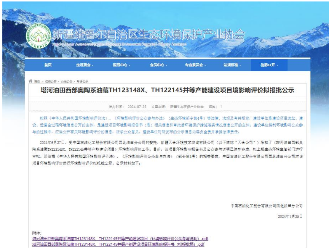
图 6.2-1 拟报批公示网页截图