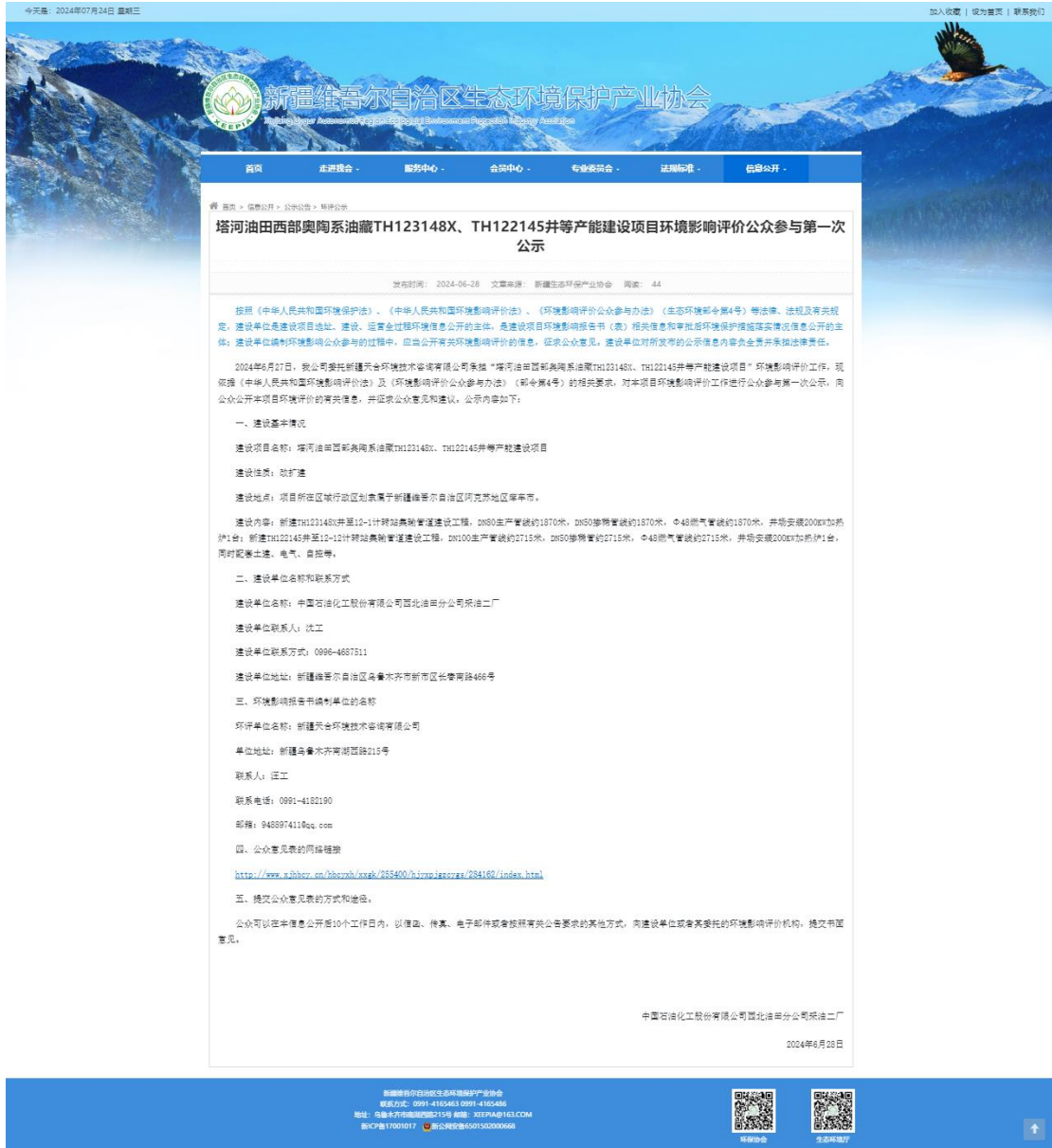
图 2.2-1 本项目第一次网络公示截图