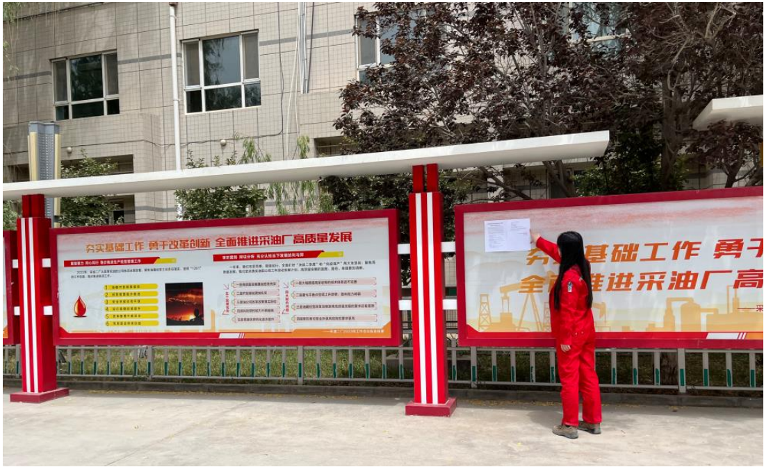
图 3.2-4 本项目张贴公示照片