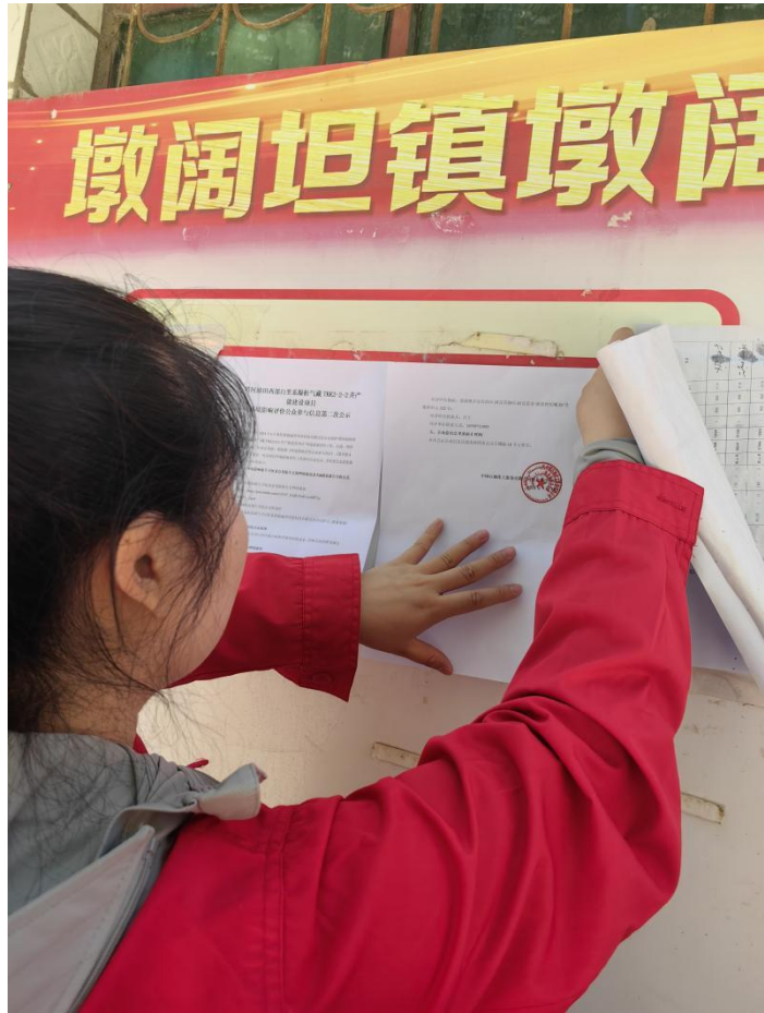
图 3.2-4 张贴公示照片