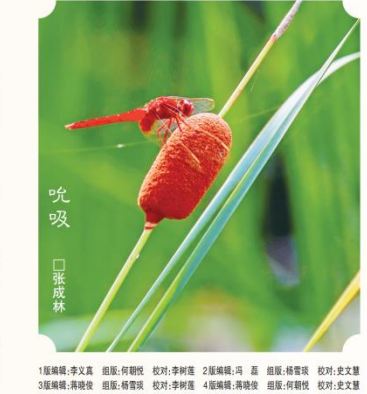
1 张成林 吹吸

家在画布上尽情挥洒的油漆。这红，并非普通的红，而是一种充满活力和活力的红，一种看了让人心情愉悦的红。每当走近樱桃树，那一片片红色的海洋便映入眼帘，让人沉醉其中，无法自拔。 樱桃的味道更是让人难以忘怀，轻轻一尝，酸中带甜，甜中带着酸，让人回味无穷。那酸，并非刺鼻的酸，而是一种清润的酸，让人瞬间感受到清凉；那甜，并非腻人的甜，而是一种淡淡的甜，让人回味无穷。 在乡村，樱桃不仅仅是水果，更是人们情感的纽带。每当樱桃成熟时，左邻右舍都会互相分享，你家送我家一些，我家送你家一些，大家的感情就在这樱桃的传递中变得更加深厚。 樱桃红了，乡村的夏天也染红了。那樱桃红，犹如阵阵微风，为炎炎夏日带来了些许凉意。在忙碌的生活中，每当看到那樱桃红，心情也会变得愉悦起来。樱桃红，是乡村夏天的象征，是生活中的一抹亮丽风景。