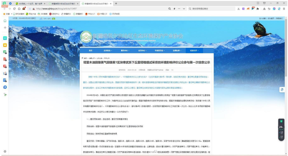
图 1 本项目第一次网络公示截图