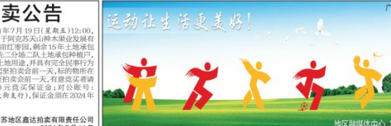
图4 本项目第二次报纸公示照片(7月11日)

受委托，我公司将于2024年7月19日(星期五)12:00，在我公司拍卖大厅公开拍卖位于阿克苏市山水发展有限责任公司二分场二队22.01亩(草场)国有土地承包经营权。根据拍卖要求：优先二分场二队土地承包经营权。竞标者需具备管理技术，不改变土地用途，并具有完全民事行为能力。展示时间：地点：即日起至拍卖前一天，标的物所在地。报名时间：即日起至拍卖前一天，有意竞买者请携带有效证件并交纳20000元竞买保证金；对公账号：107009762340(中国银行南大街支行)，保证金须在2024年7月18日18时前到账。 咨询电话：13111997999 阿克苏地区鑫达拍卖有限责任公司 2024年7月11日