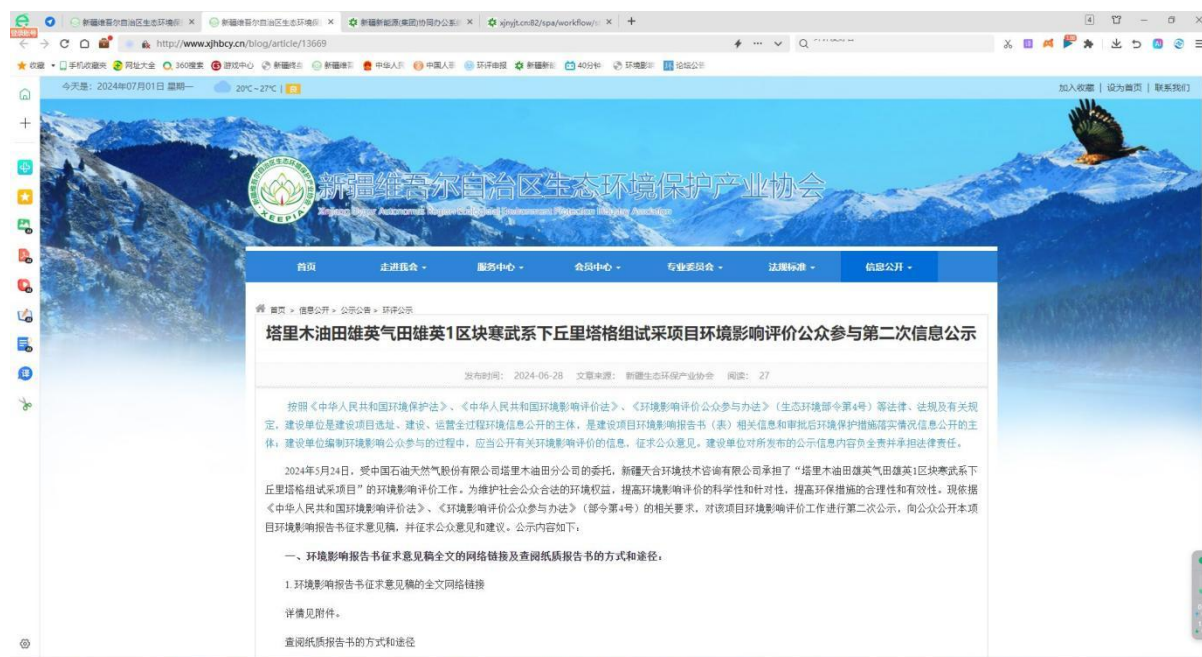
图 2 本项目征求意见稿网络公示截图