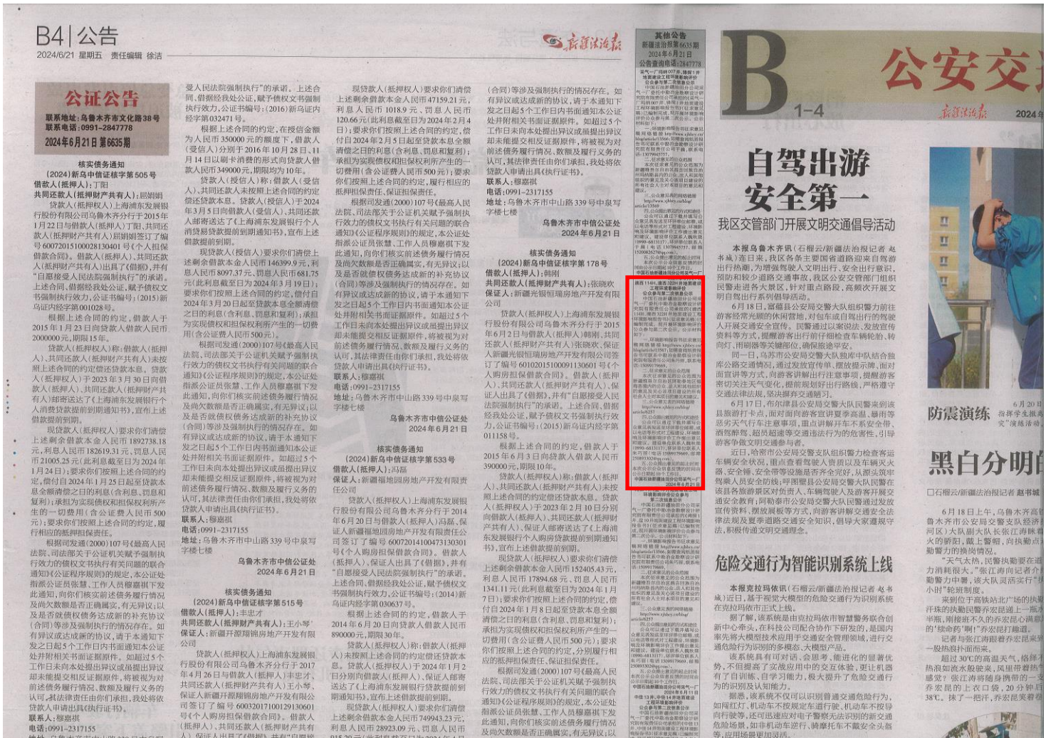
图 3-2 征求意见稿第一次报纸公示截图