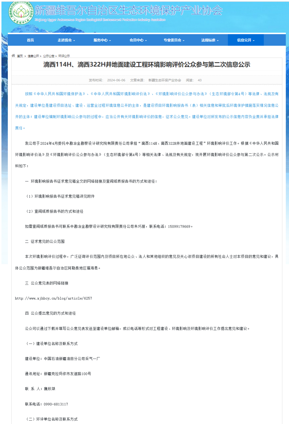
图 3-1 项目公众参与第二次信息公示截图