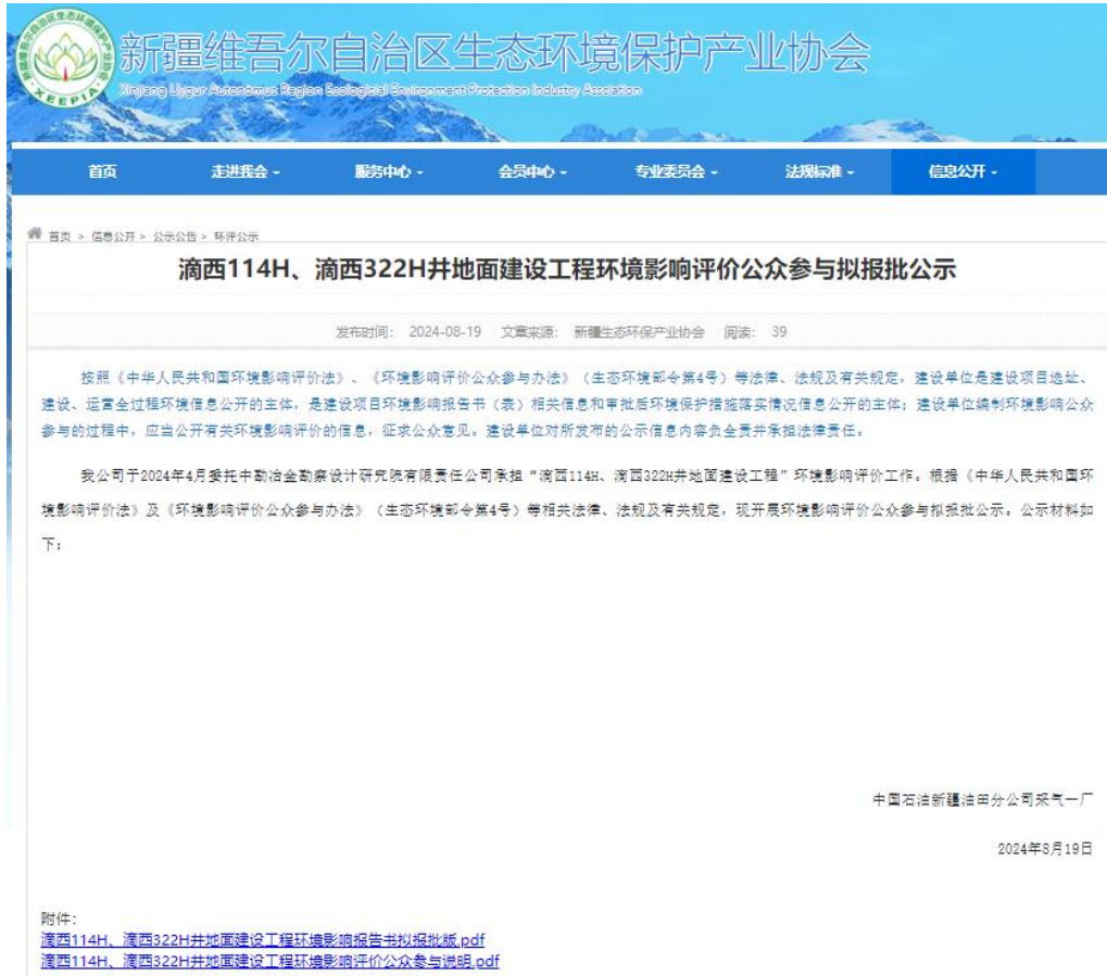
图 6-1 拟报批报公示截图

中国石油新疆油田分公司采气一厂于 2024 年 8 月 19 日在新疆维吾尔自治区生态环境保护产业协会网站刊登了项目拟报批公示 ( http://www.xjhbcy.cn/blog/article/13911 ), 载体选择符合《环境影响评价公众参与办法》要求。公示截图请见图 6-1。