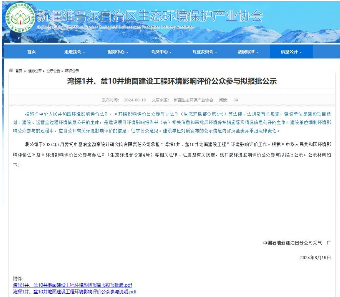
图 6-1 拟报批报公示截图