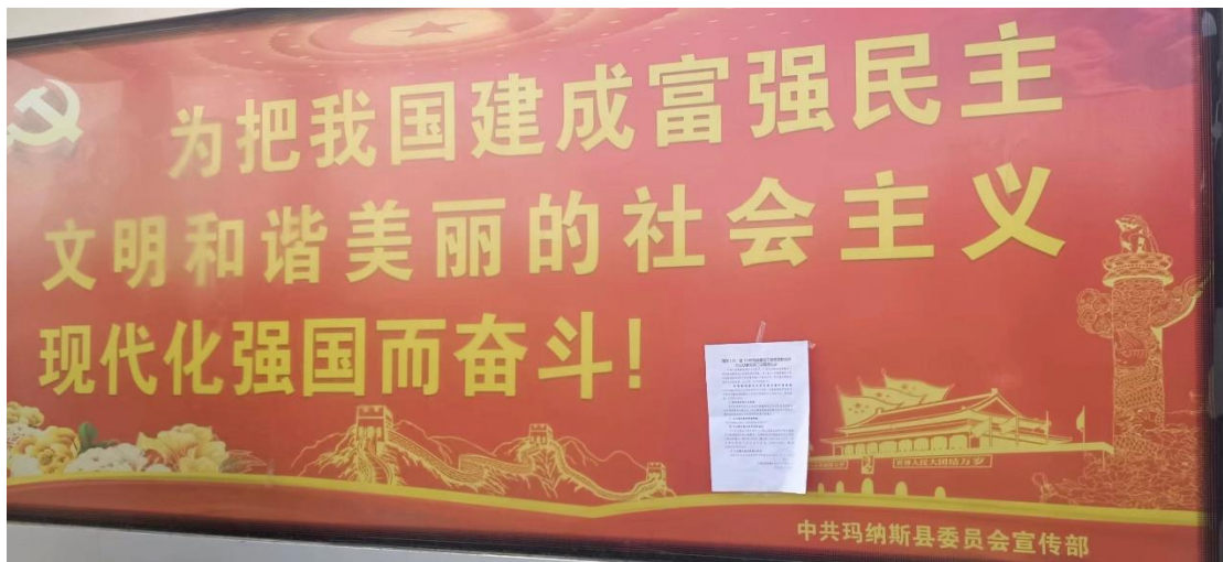
图 3-4 征求意见稿张贴公告公示截图 (b)