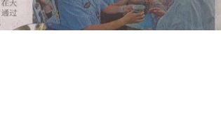
图 3-3 征求意见稿第二次报纸公示截图