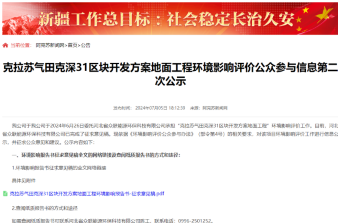
图 3-1 第二次信息公示情况

我公司在《阿克苏新闻网》( https://www.aksxw.com/sy/gg/202407/t20240705_22332226.html )上发布了征求意见稿公示信息,对环境影响报告书征求意见稿全文进行公开,公示时限为10个工作日,网站第二次公示网络截图见图3-1。