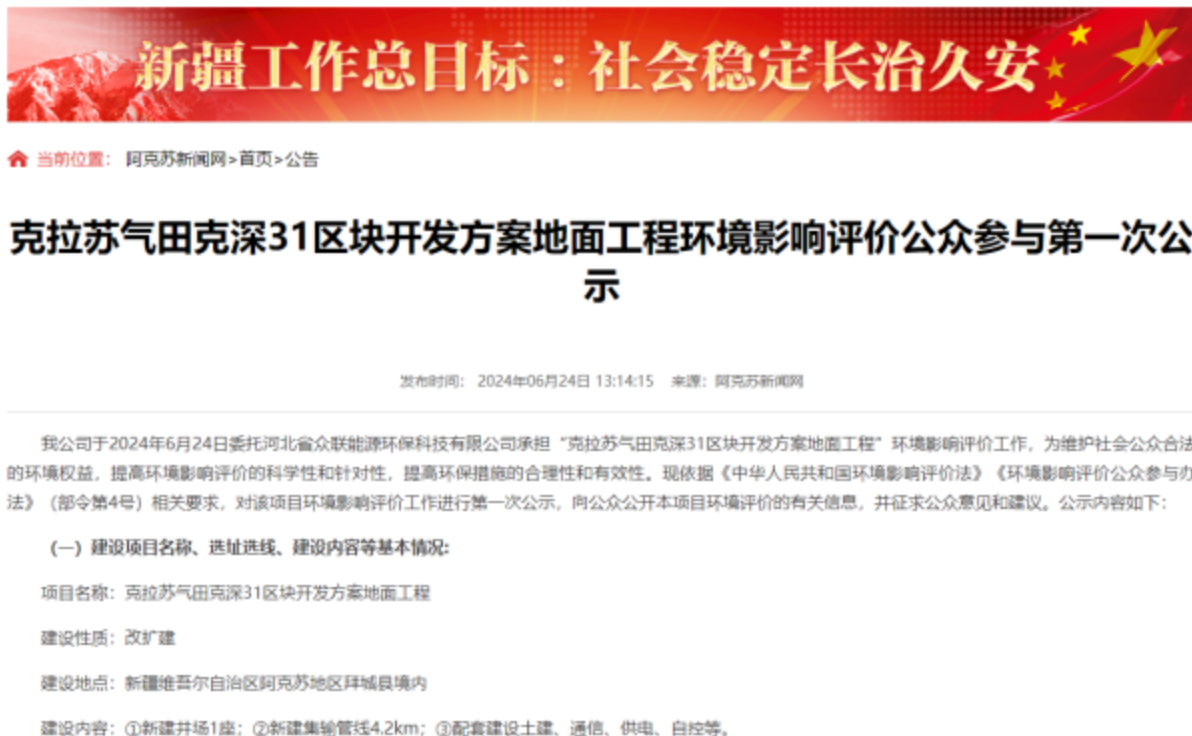
图 2-1 第一次信息公示情况