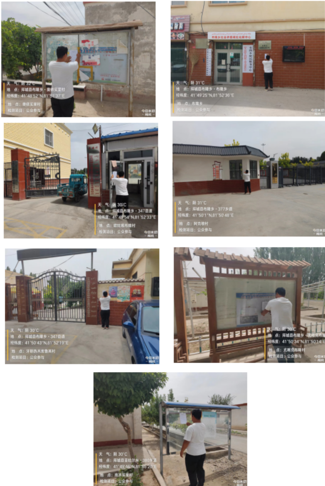
图 3-4 2024 年 7 月 10 日村庄张贴公示情况

我公司于 2024 年 7 月 10 日在周边村庄张贴了项目环境影响报告书公示信息，现场公示照片见图 3-4。