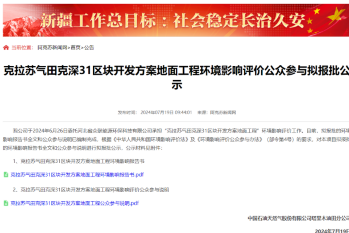
图 6-1 报批前网络公示截图

本次报批前公开方式为网络公开，公开时间为 2024 年 7 月 19 日 ( https://www.aksxw.com/sy/gg/202407/t20240719_22584204.html )，公开网站为《阿克苏新闻网》，该网站访问流量较大，且可以上传并公开项目环境影响报告书全本，选择该网站进行公示符合《环境影响评价公众参与办法》要求。报批前网络公示截图见图 6-1。