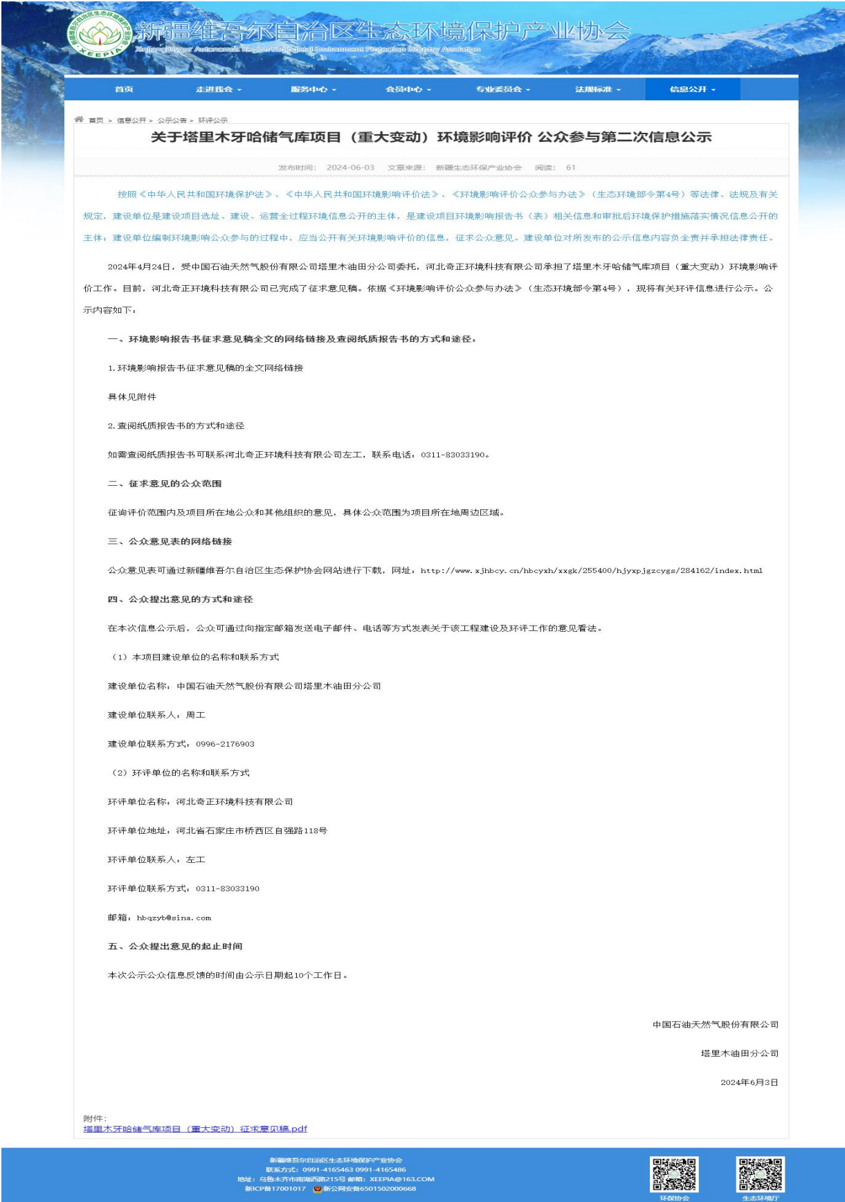
图3-1 第二次信息公示情况