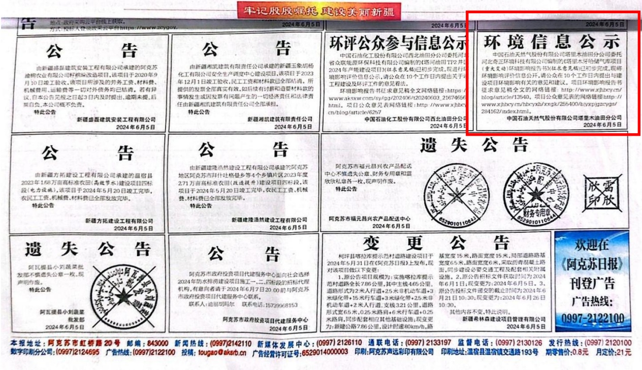
图3-2 2024年6月5日报纸公示情况