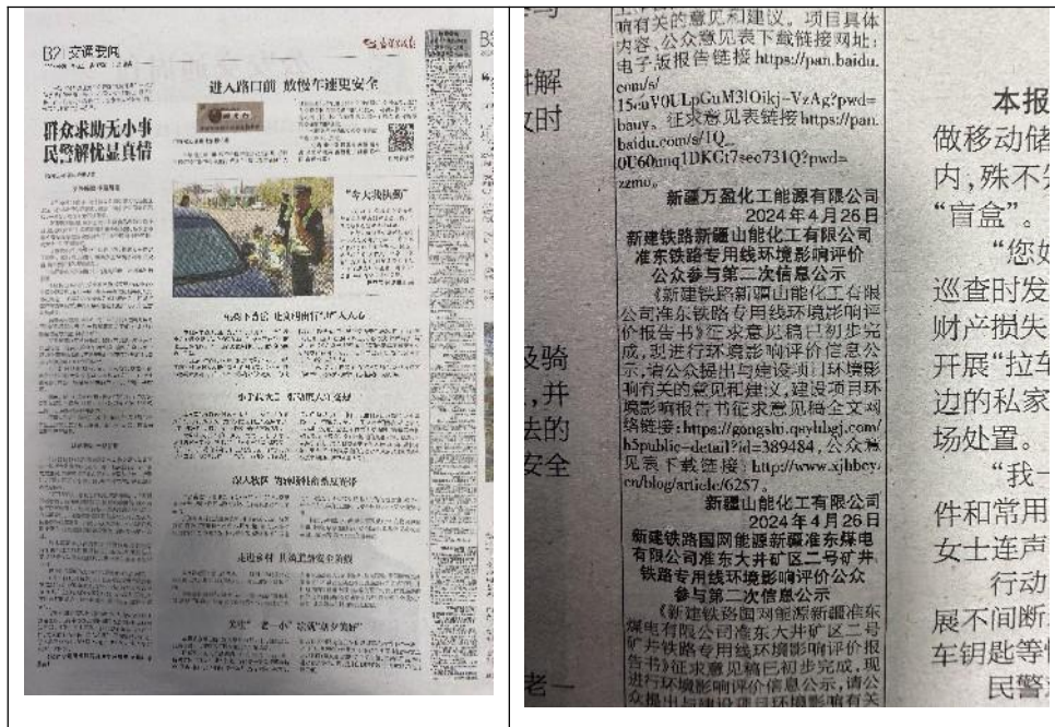
图3 本工程第一次报纸公示页面