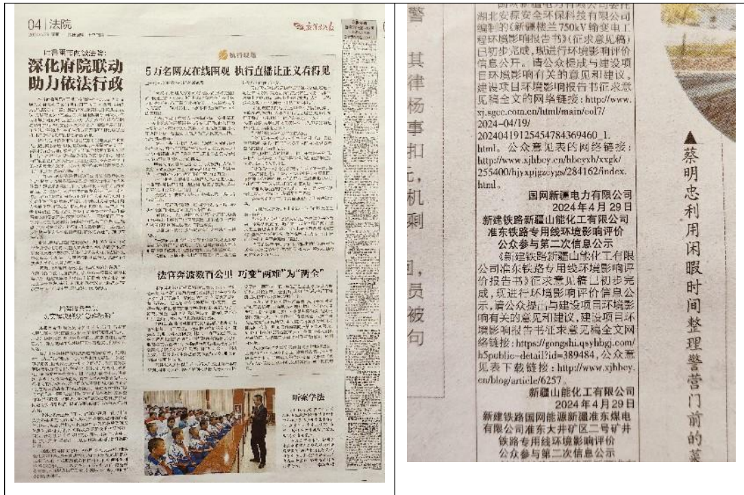
图4 本工程第二次报纸公示页面