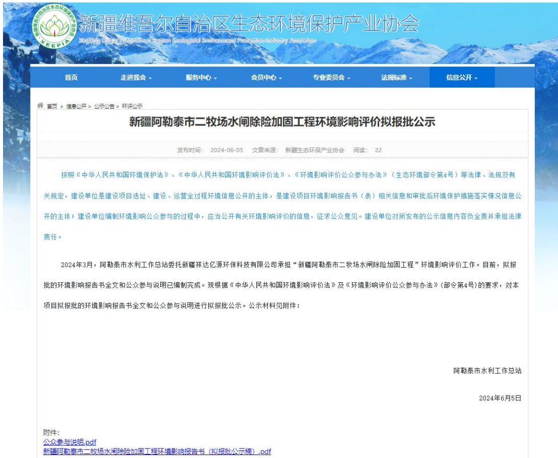
图 4.2-1 拟报批网上公示截图