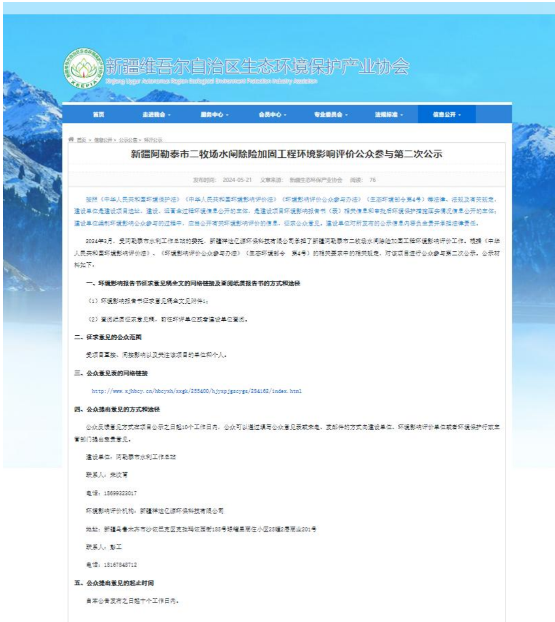
图 3.2-1 征求意见稿网上公示截图