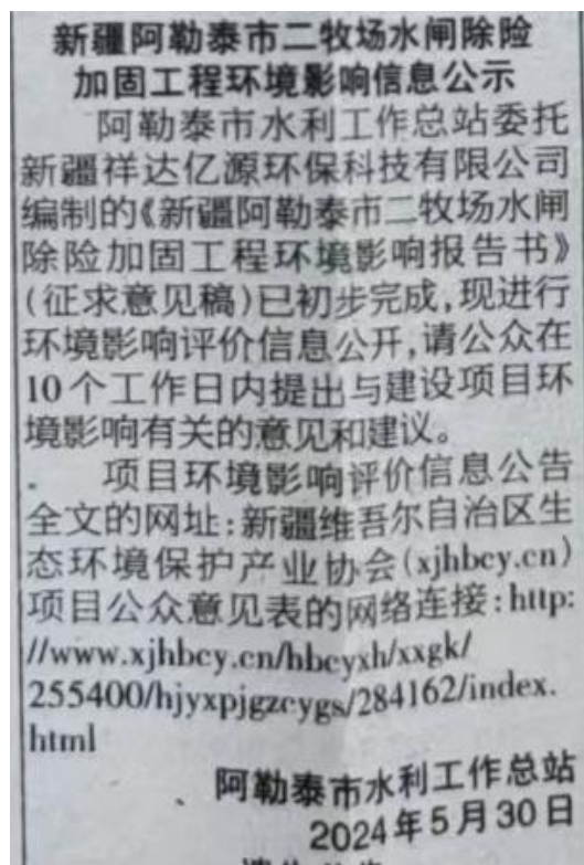
图 3.2-2 2024 年 5 月 29 日报纸公示截图 图 3.2-3 2024 年 5 月 30 日报纸公示截图