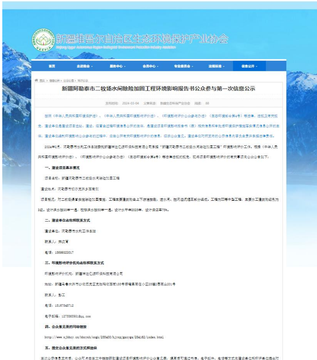
图 2.2-1 一次公示网络截图

本项目的首次公示是在新疆维吾尔自治区生态环境保护产业协会 ( http://www.xjhbcy.cn/blog/article/13031 ) 上进行的, 网页页面截图见图 2.2-1。