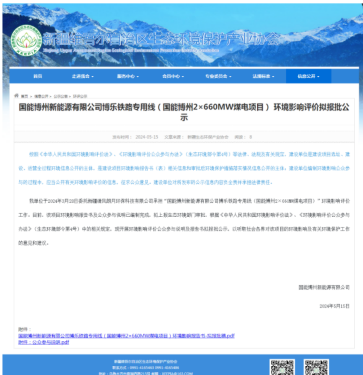
图 6.2.1 网上公示截图