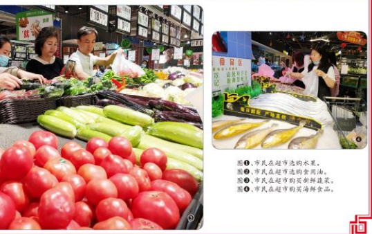
图1 市民在超市选购水果。图2 市民在超市选购肉类。图3 市民在超市购买新鲜蔬菜。