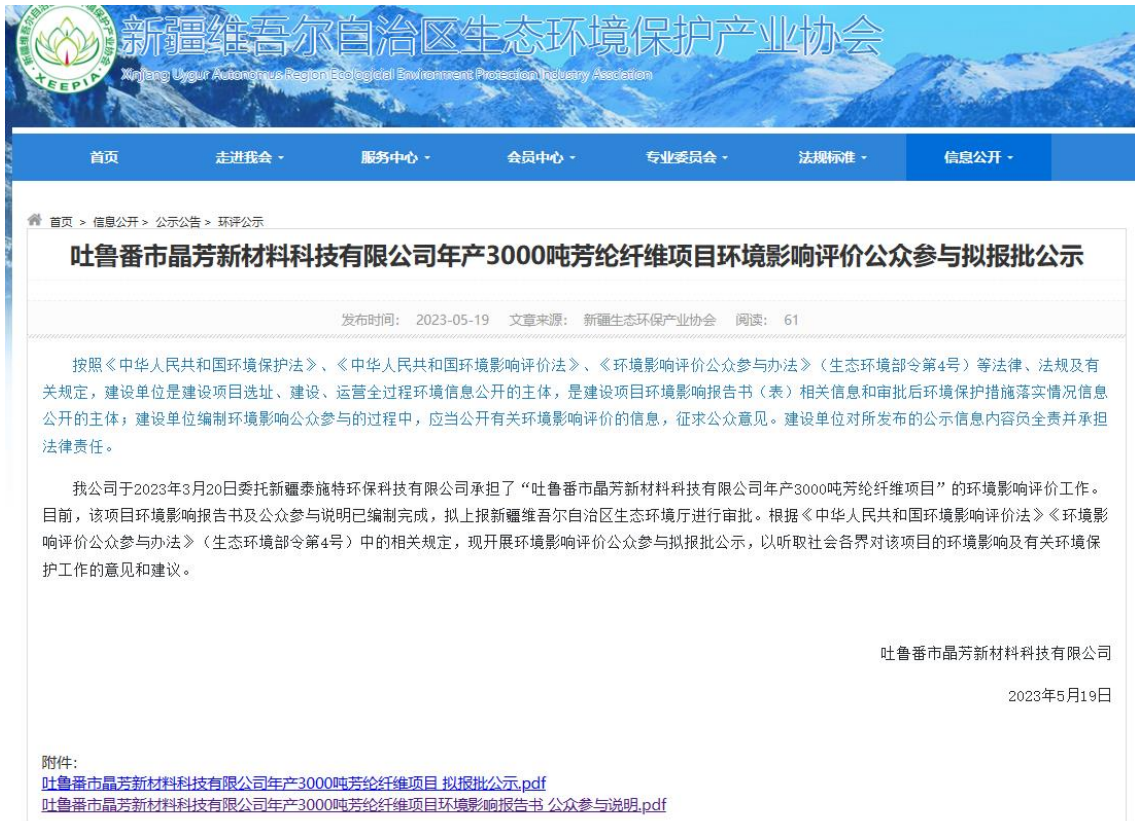
图 6 项目第三次公众参与公示截图