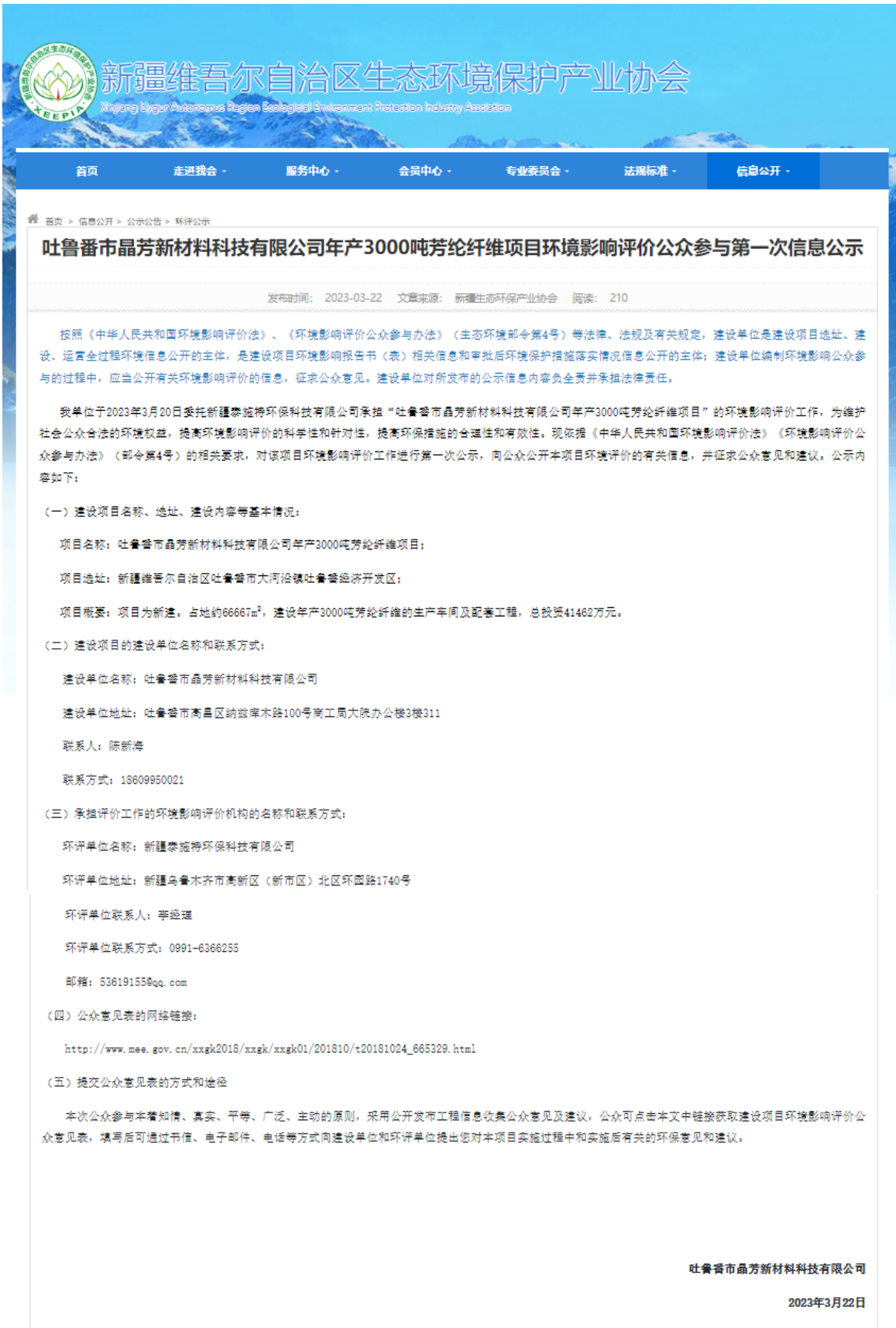
图1 项目第一次网络公众参与公示截图