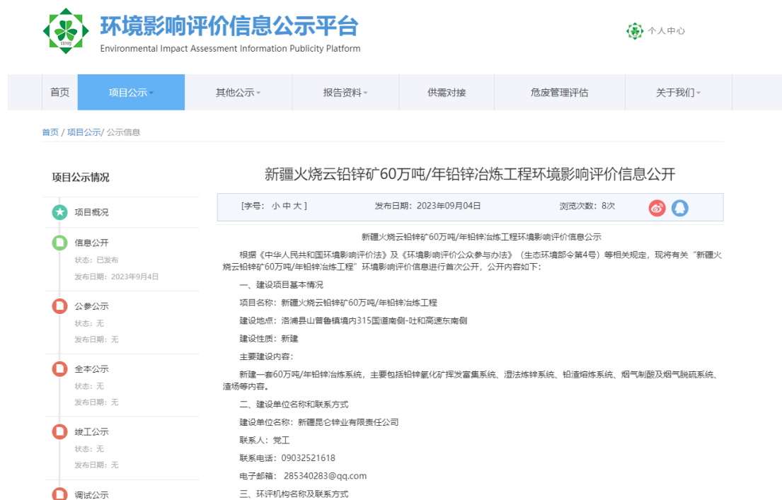
图 1 第一次公示（网络）截图

首次公开采取网络公示的方式进行，选取的网站为环境影响评价信息公示平台网，网络公示网址为： https://www.js-eia.cn/project/detail?type=1&proid=47f64d526d38e2d0f45d512419e8a3d3 ，具体公示内容见图1。