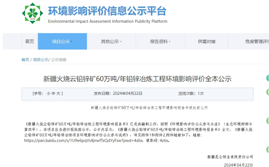
图 5 报批前公示截图

根据《环境影响评价公众参与办法》要求，在《新疆火烧云铅锌矿60万吨/年铅锌冶炼工程环境影响报告书》给新疆生态环境局审批前，新疆昆仑锌业有限责任公司组织编制了建设项目环境影响评价公众参与说明，并按《环境影响评价公众参与办法》要求在网络进行了网上公示见，网址链接如下： https://www.js-eia.cn/project/detail?type=3&proid=47f64d526d38e2d0f45d512419e8a3d3 ，网上公示截图见5，公示了此说明和环境影响报告书。公众参与说明内容和格式按照生态环境部指定要求编制。