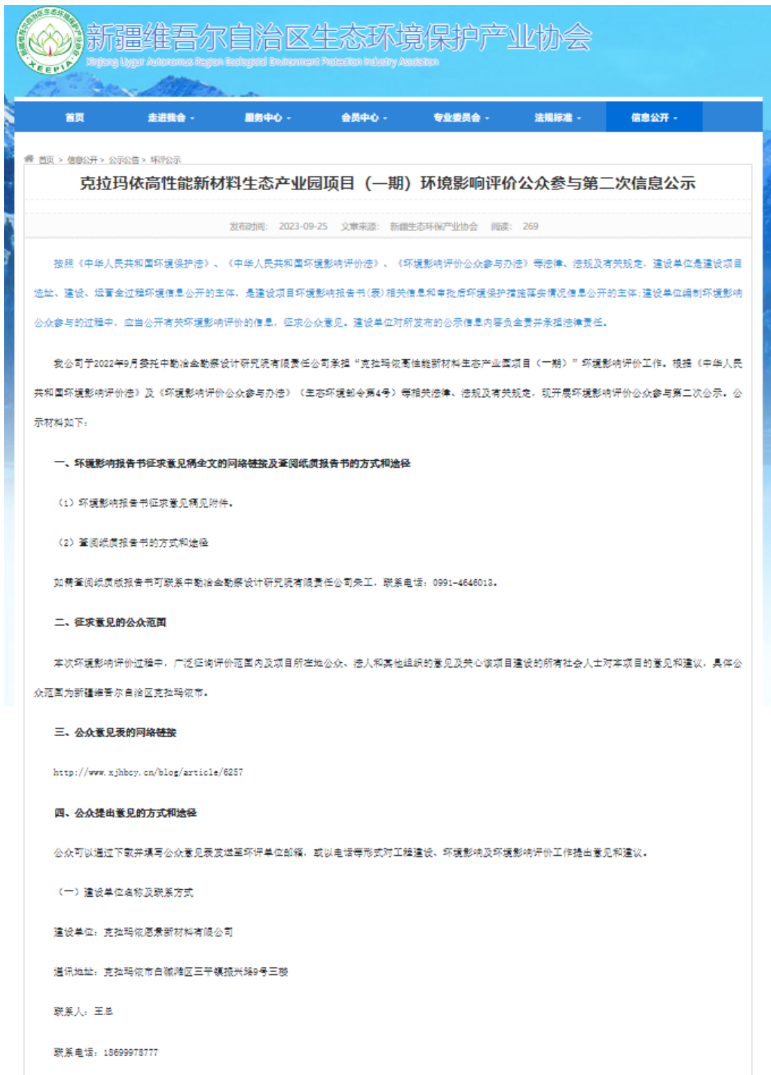
图 3-1 项目公众参与第二次信息公示截图