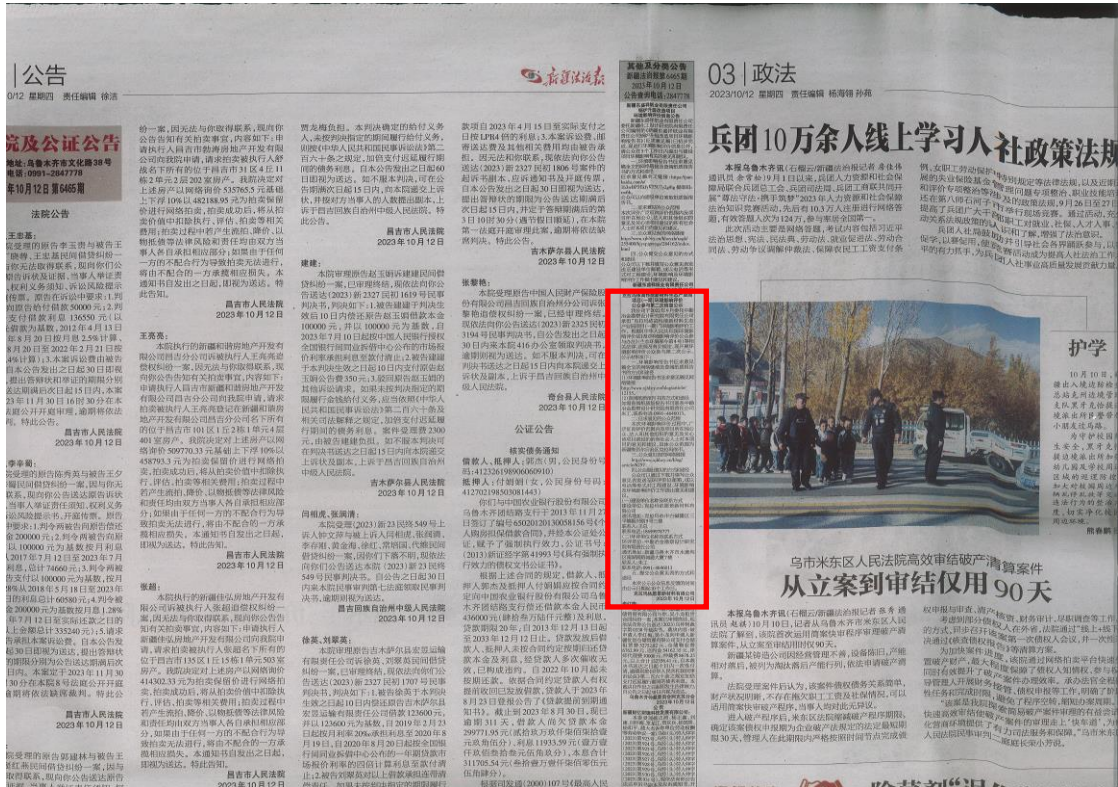
图 3-3 征求意见稿第二次报纸公示截图