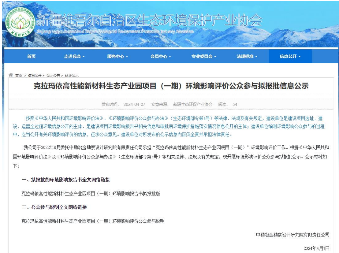
图 6-1 拟报批报公示截图