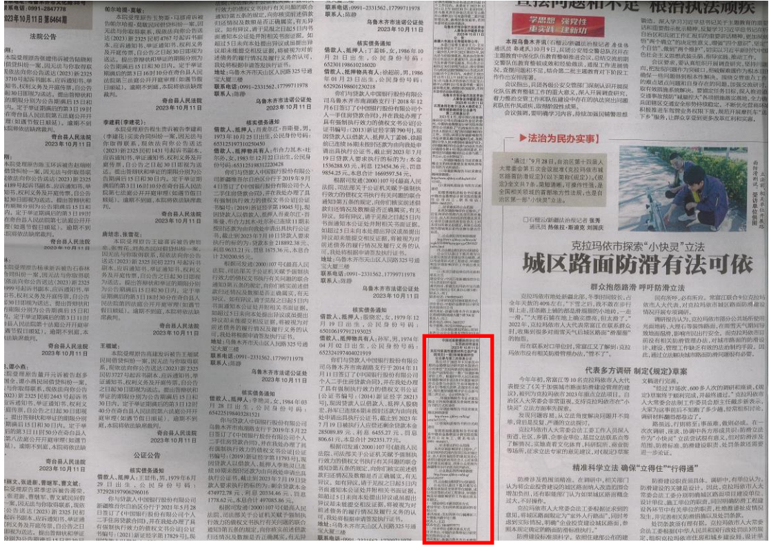
图 3-2 征求意见稿第一次报纸公示截图