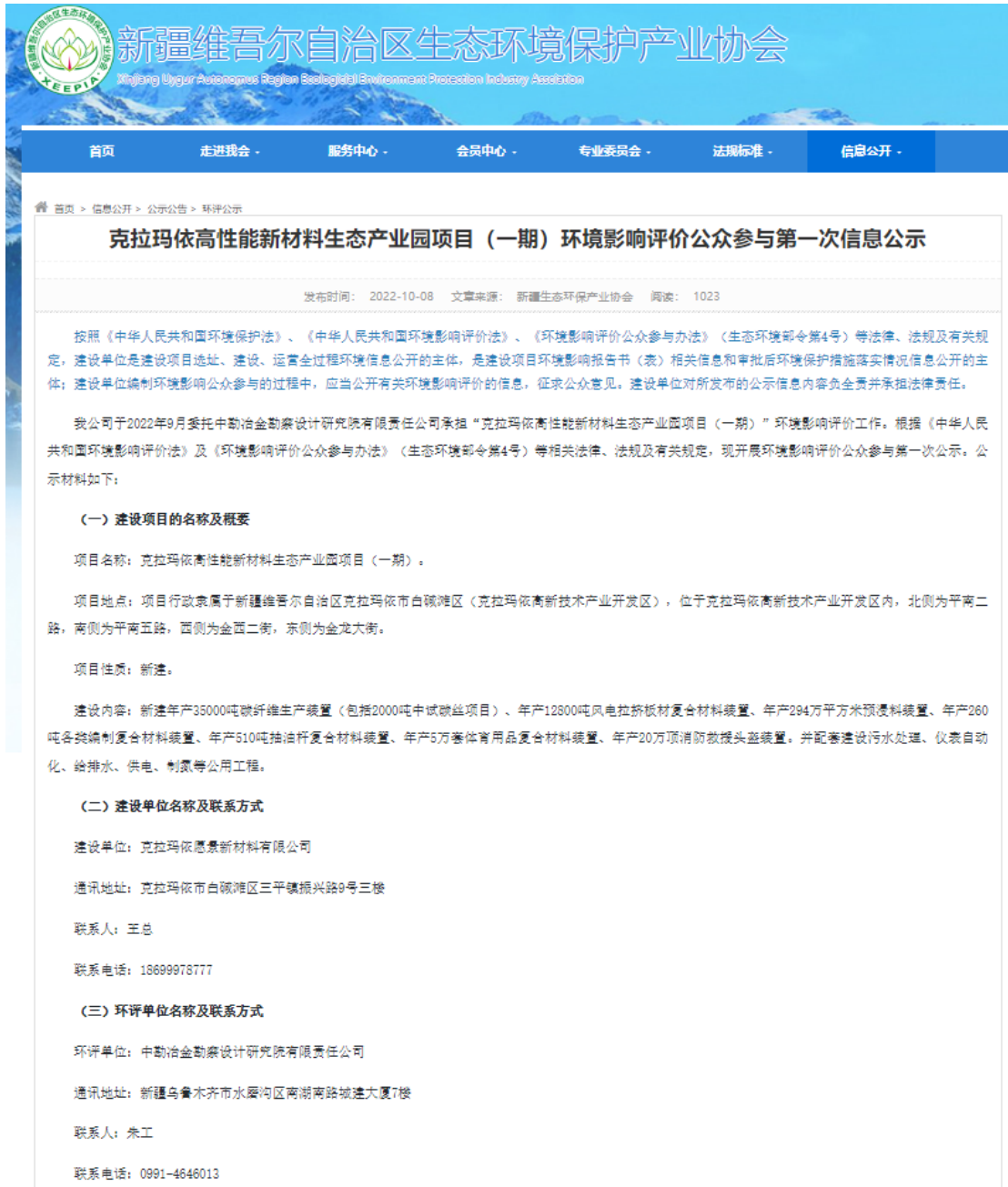
图 2-1 项目公众参与第一次信息公示截图