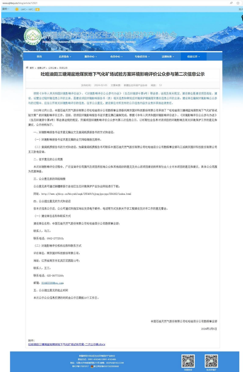
图 3.2-1 第二次网络公示