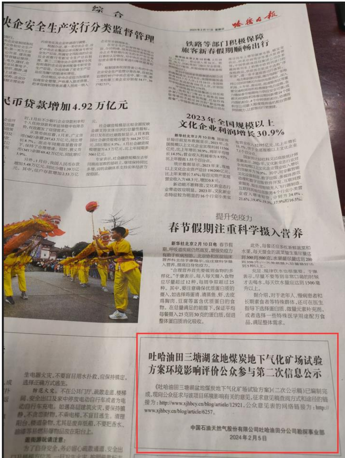
图 3.2-2 报纸公示（2024 年 2 月 8 日）