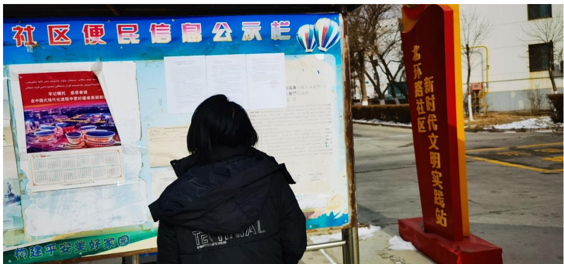
图 3.2-5 现场张贴照片