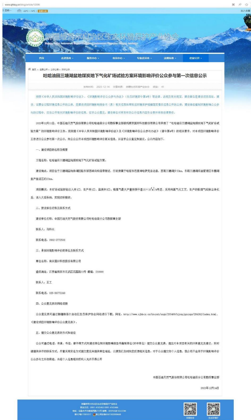
图 2.2-1 第一次网络公示