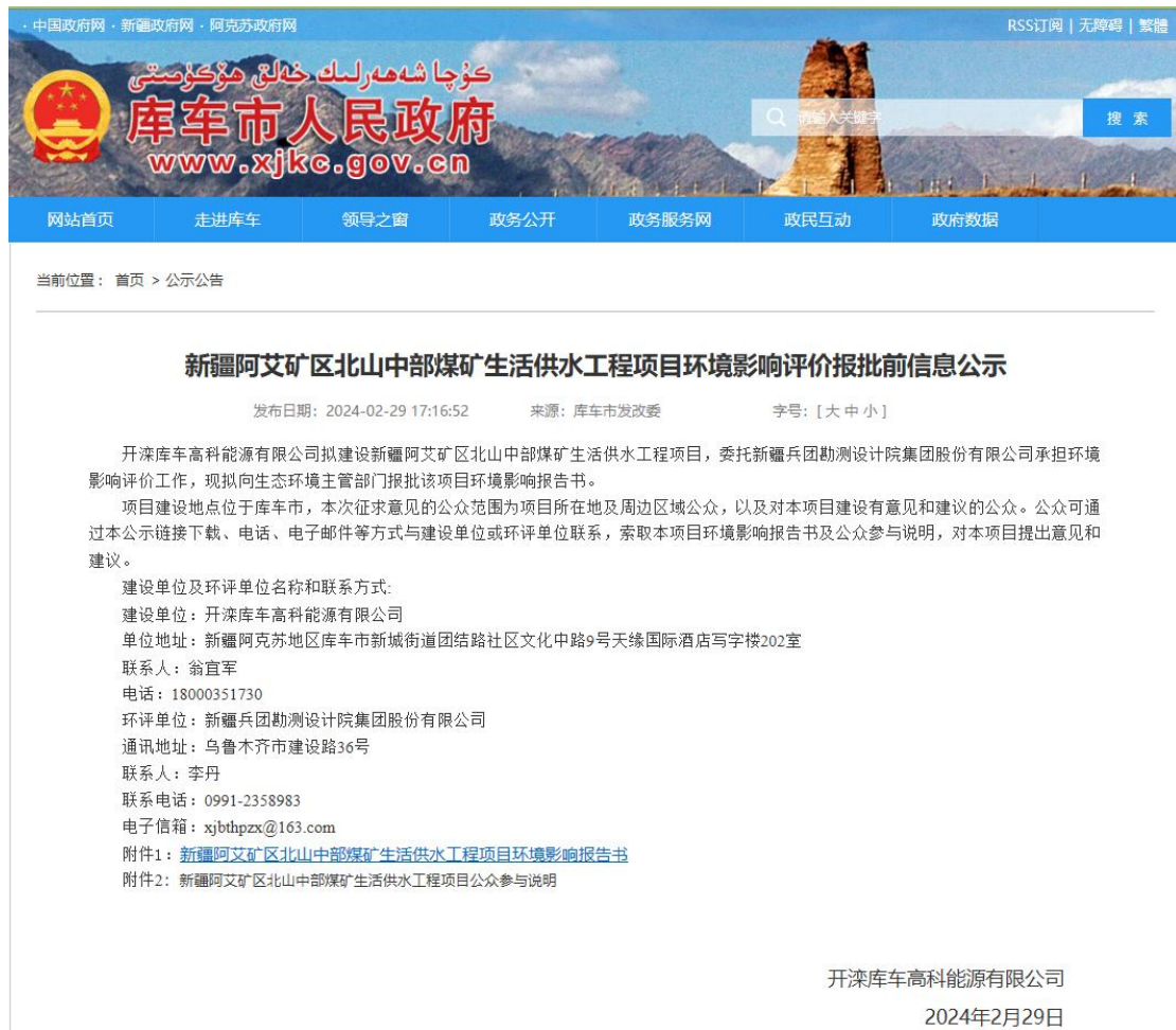
报批前网络公示截图

我单位于 2024 年 2 月 29 日在库车市人民政府网公开本项目报批稿（网址： https://www.xjkc.gov.cn/gsgg/20240301/i1011015.html ）。公示期间，未收到与项目环境影响有关的公众意见。