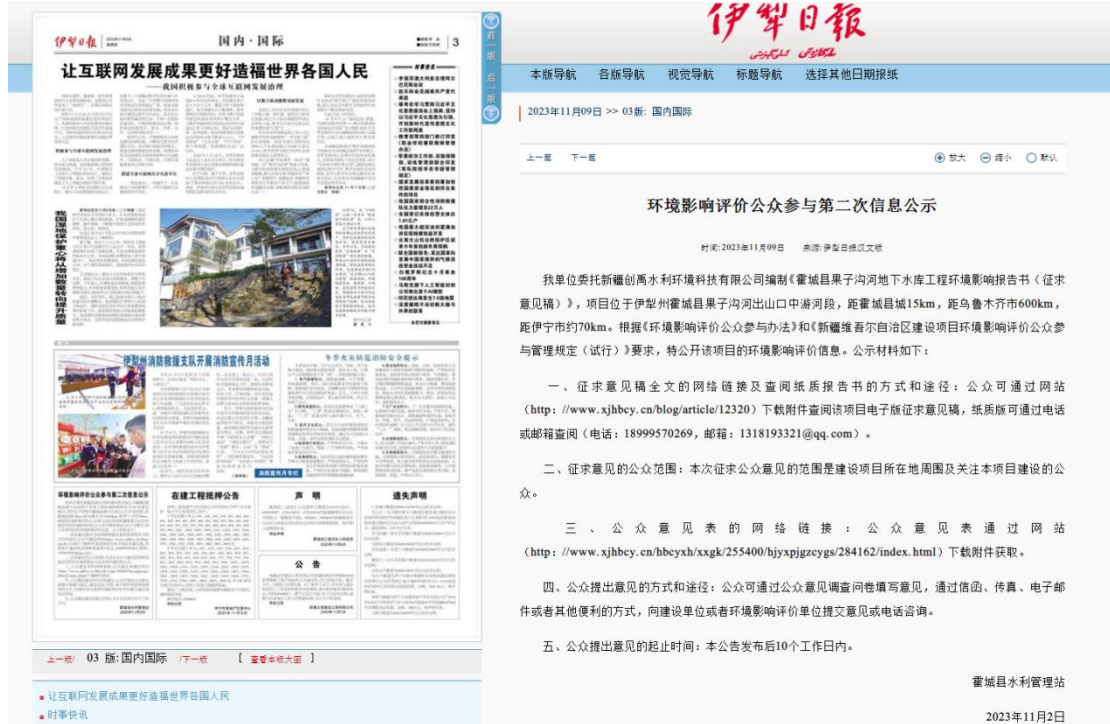
图3 2023年11月9日报纸公示

在网络公示的同时，我单位在伊犁日报（2023年11月9日和2023年11月10日）、发布了项目环境影响报告书公示信息，报纸公示照片件图3、图4。