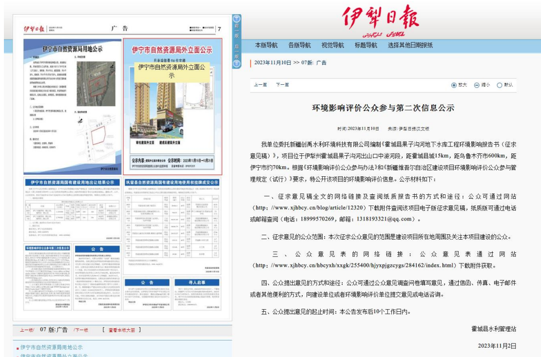
图4 2023年11月10日报纸公示