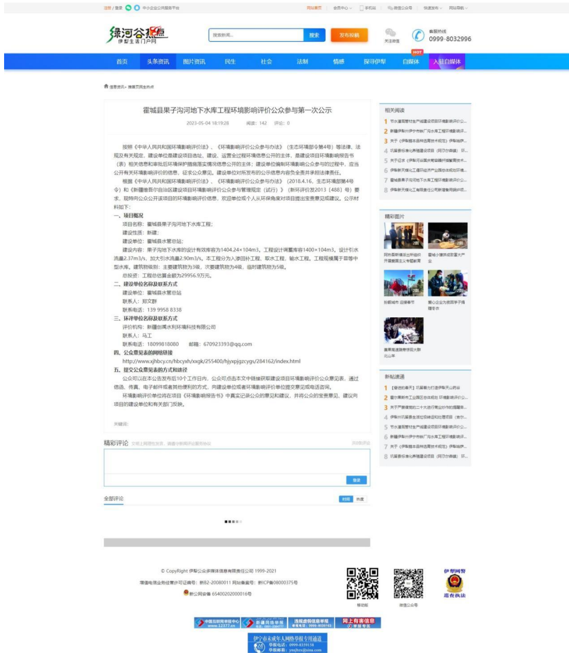
图 1 第一次网络公示截图（绿河谷网）