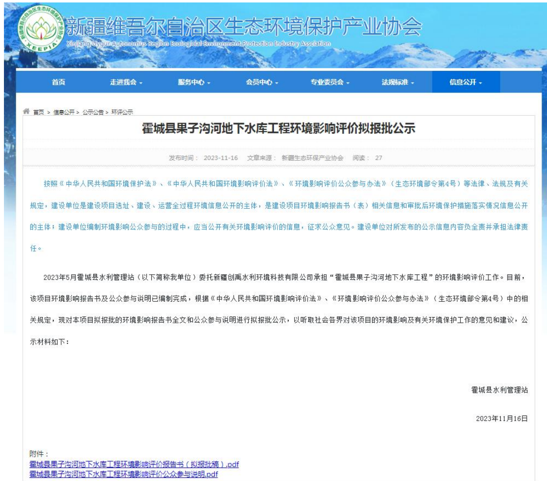
图 6 拟报批公示网络截图

公开网站为新疆维吾尔自治区生态环境保护产业协会（ http://www.xjhbcy.cn/blog/article/12437 ），该网站在当地有较大的知名度，访问流量较大，上传并公开了项目环境影响报告书全本及公众参与说明，选择该网站进行公示符合《环境影响评价公众参与办法》要求。