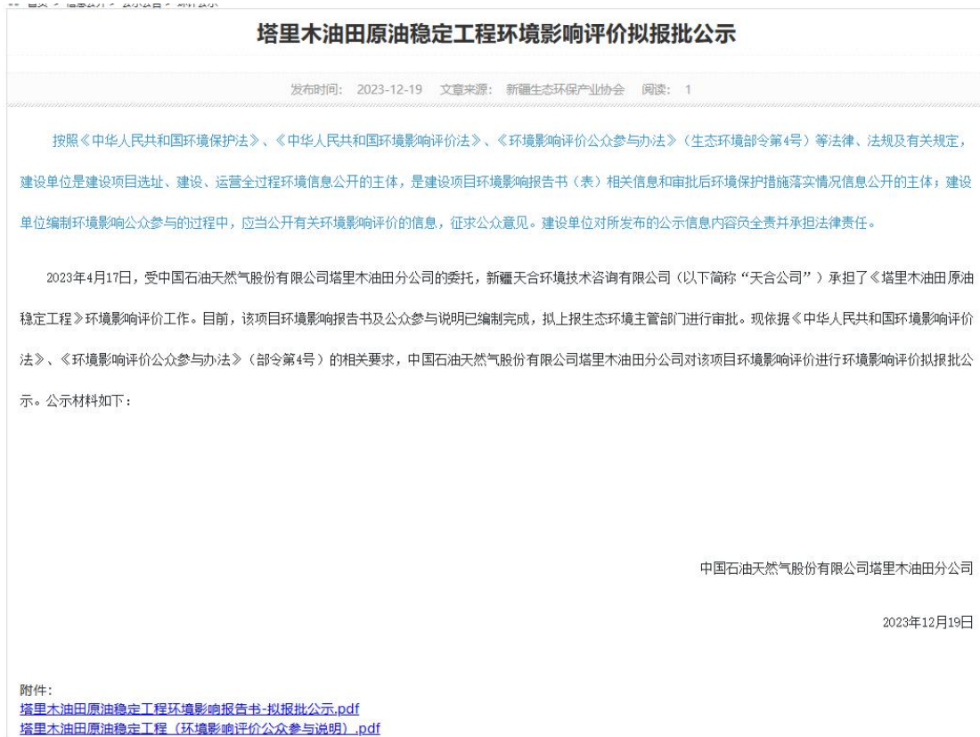
图 6.2-1 拟报批公示网页截图