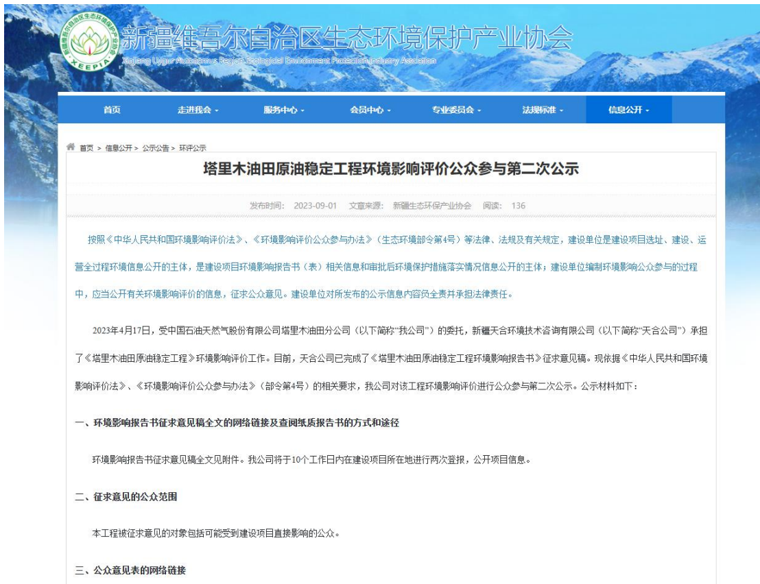
图 3.2-1 本项目征求意见稿网络公示截图