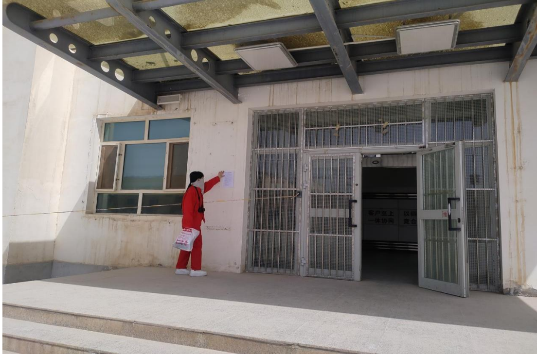
图 3.2-4 本项目张贴公示栏照片

在第二次公示期间，本项目在项目所在地公示栏进行了张贴公示，载体选择符合《环境影响评价公众参与办法》要求。张贴公示照片见图 3.2-4。