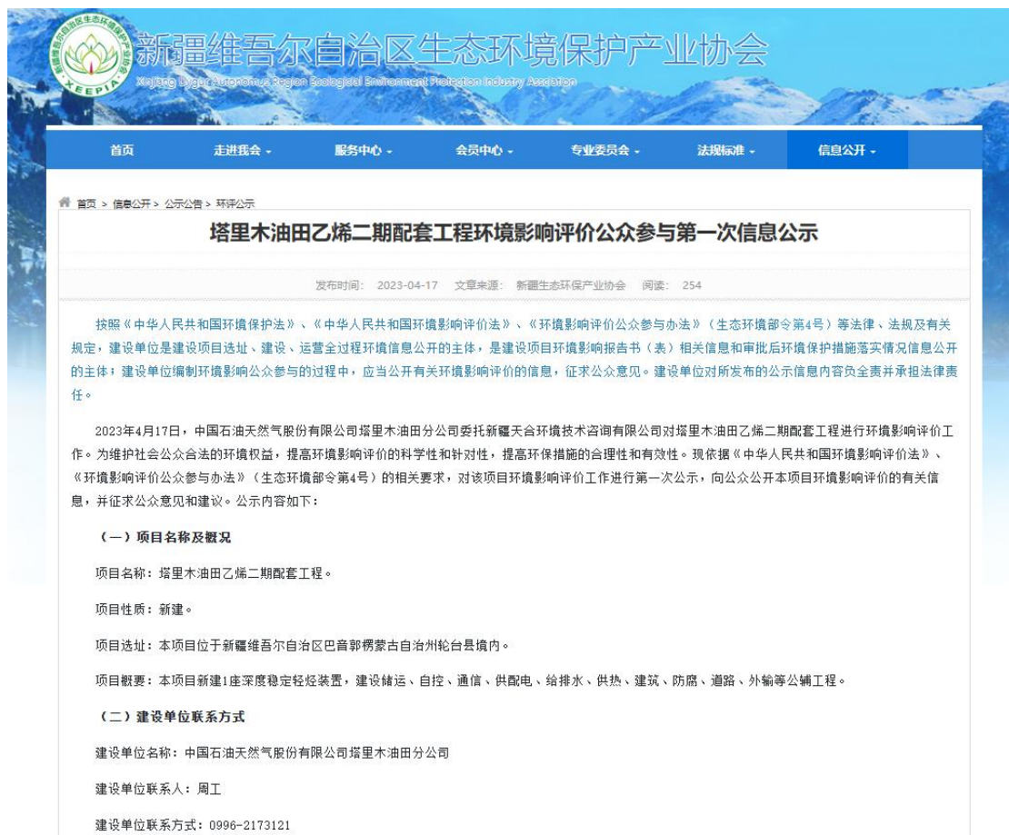
图 2.2-1 本项目第一次网络公示截图

中国石油天然气股份有限公司塔里木油田分公司在新疆维吾尔自治区生态环境保护产业协会网站开展网络公示，载体选择符合《环境影响评价公众参与办法》要求。公示链接： www.xjhbcy.cn/blog/article/11156 ，网络公示截图见图2.2-1。