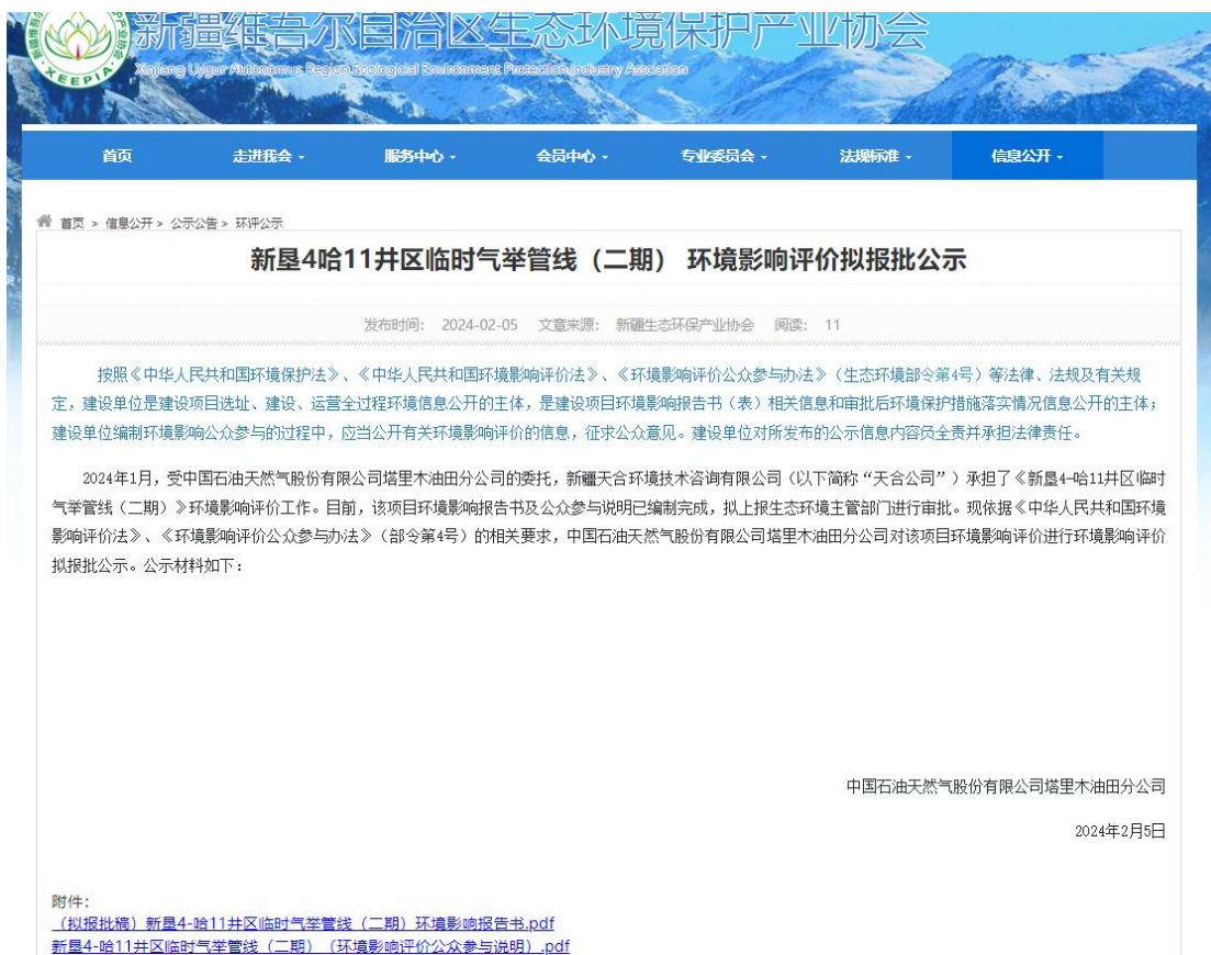
图 6.2-1 拟报批公示网页截图