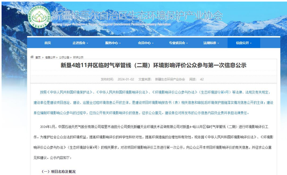
图 2.2-1 本项目第一次网络公示截图

中国石油天然气股份有限公司塔里木油田分公司在新疆维吾尔自治区生态环境保护产业协会网站开展网络公示，载体选择符合《环境影响评价公众参与办法》要求。公示链接： www.xjhbcy.cn/blog/article/12713 ，网络公示截图见图2.2-1。