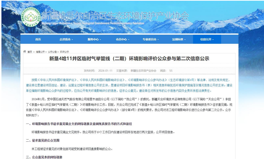
图 3.2-1 本项目征求意见稿网络公示截图