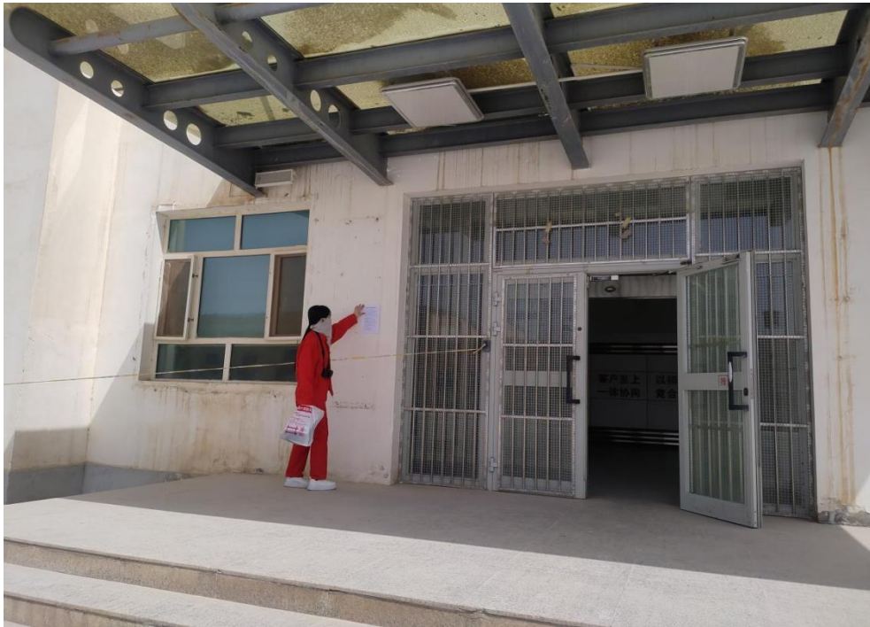
图 3.2-4 本项目张贴公示栏照片

在第二次公示期间，本项目在项目所在地公示栏进行了张贴公示，载体选择符合《环境影响评价公众参与办法》要求。张贴公示照片见图 3.2-4。