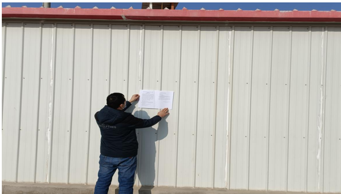
图3.2-4 本项目张贴公示栏照片

在第二次公示期间，本项目在项目所在地公示栏进行了张贴公示，载体选择符合《环境影响评价公众参与办法》要求。张贴公示照片见图3.2-4。