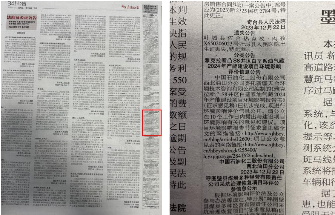
图 3.2-3 本项目第二次报纸公示照片