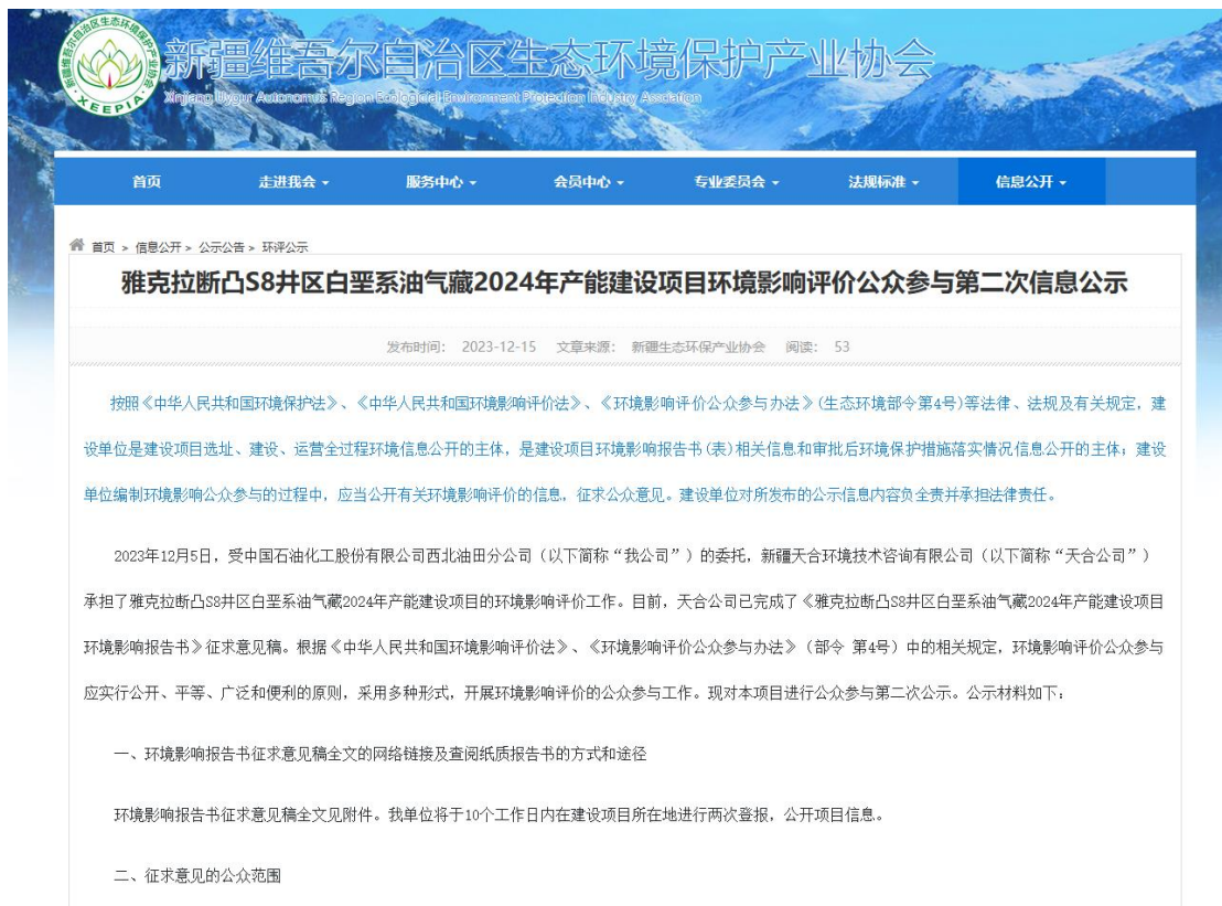
图3.2-1 本项目征求意见稿网络公示截图