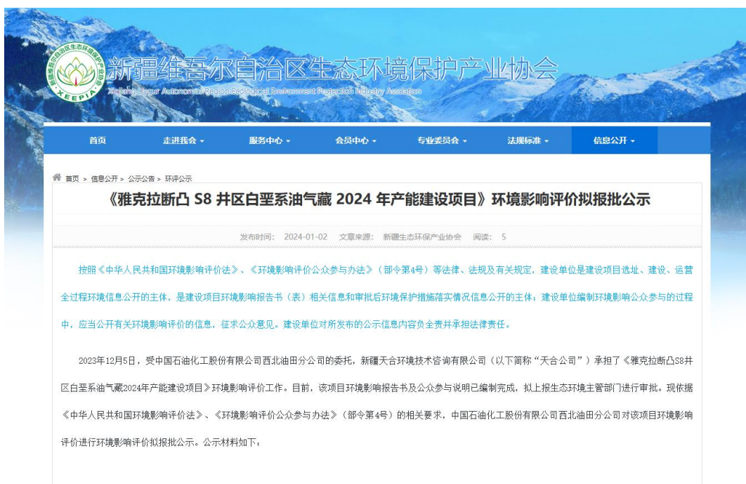
图6-1 环境影响评价报批前公示截图

中国石油化工股份有限公司西北油田分公司于2024年01月02日在新疆维吾尔自治区生态环境保护产业协会（ http://www.xjhbcy.cn ）上进行了报批前网络公示，向公众公开拟报批的环境影响报告书全文和公众参与说明。载体选择符合《环境影响评价公众参与办法》第二十条“建设单位向生态环境主管部门报批环境影响报告书前，应当通过网络平台，公开拟报批的环境影响报告书全文和公众参与说明”的要求。公告网址： http://www.xjhbcy.cn/blog/article/12710 。载体选择符合《环境影响评价公众参与办法》要求。网络公示截图见图6-1。