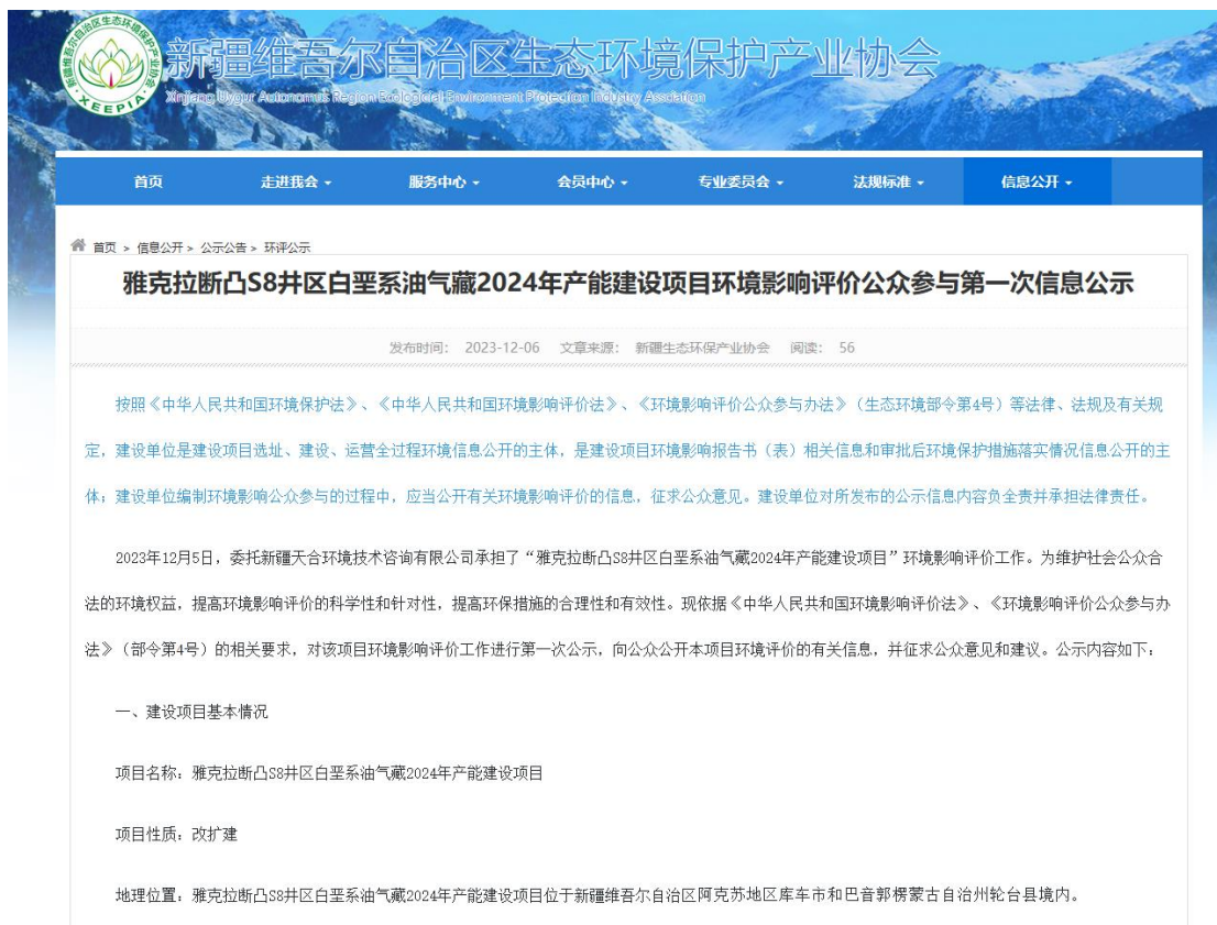
图2.2-1 本项目第一次网络公示截图