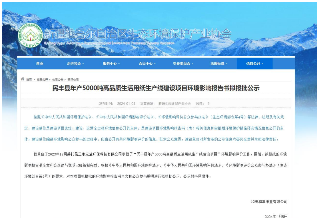
图6 报批前网上公示截图