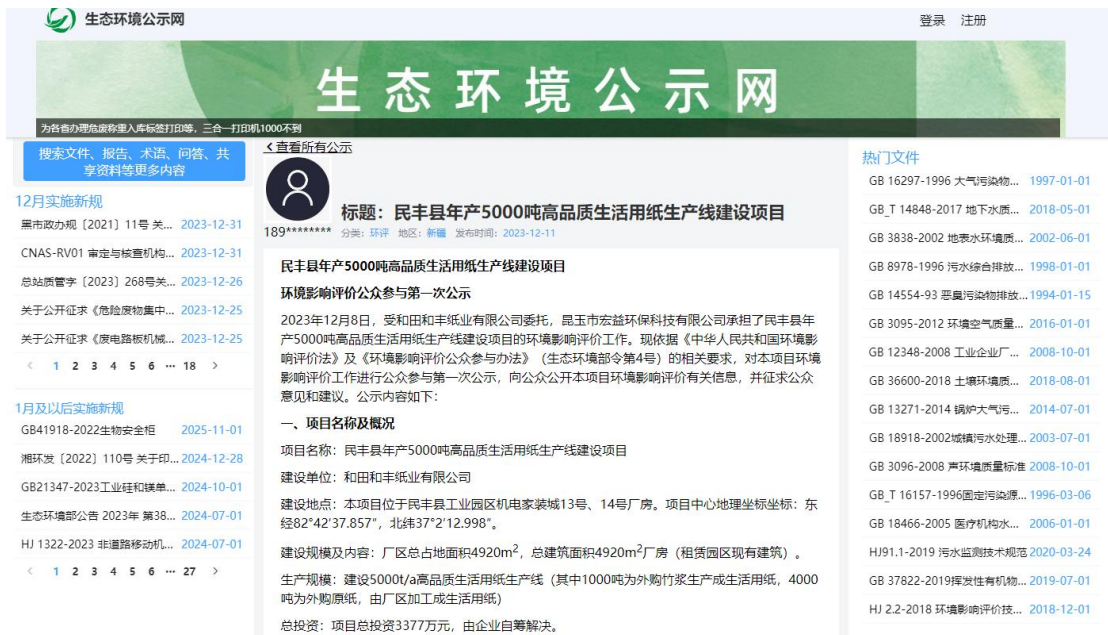
图 1 本项目第一次网络公示截图