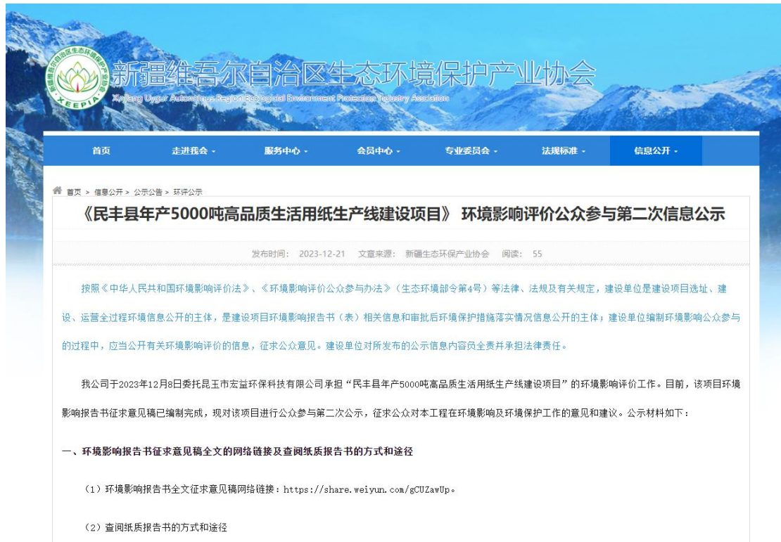
图 2 本项目征求意见稿网络公示截图