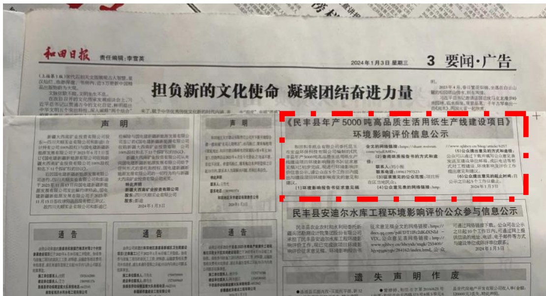
图4 本项目第二次报纸公示照片