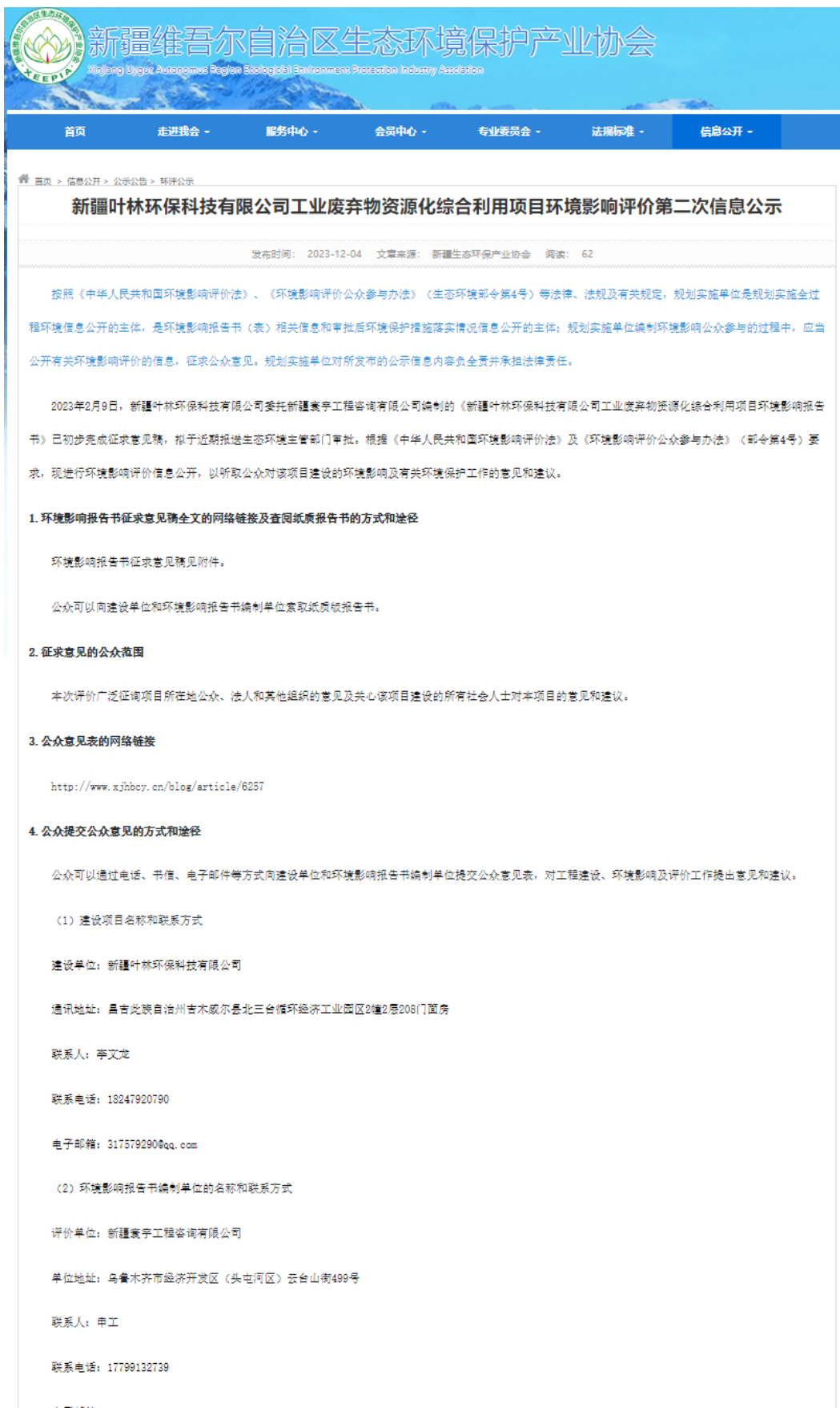
图1 征求意见稿网络公示截图