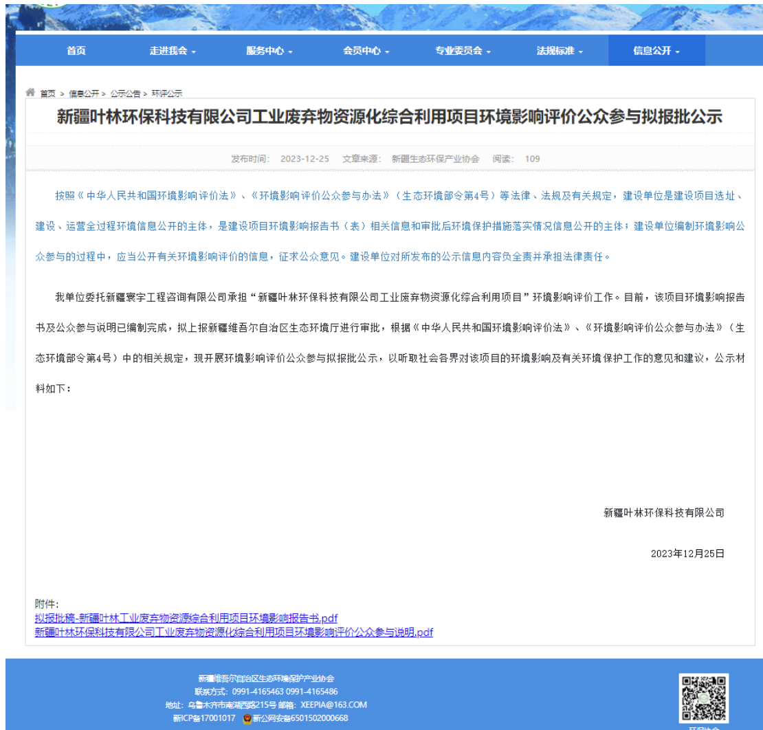
图 6 报批前网络公示截图

http://www.xjhbcy.cn/blog/article/12667。公示截图见图 6。