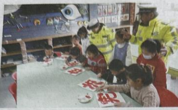
12月3日,在库尔勒市公安局交警大队与库尔勒市苹果美术培训中心联合开展的“宪法在我心中”主题绘画活动中,孩子们为宣传语上色。

随后,该大队民警来到滨河幼儿园,以问答互动的形式向孩子们讲解交通安全知识,并组织孩子们观看教育警示影片,引导其增强自我保护意识和安全出行意识。为增强教学趣味性,民警组织孩子们学习交通