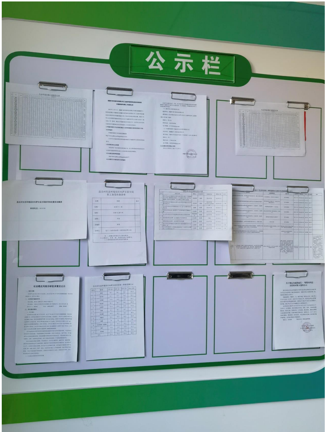
图 5 张贴照片