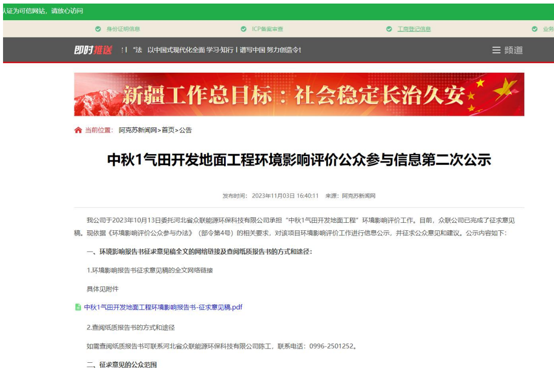
图 3-1 第二次信息公示情况

我公司在阿克苏新闻网( https://www.aksxw.com/sy/gg/202311/t20231103_17098268.html )上发布了征求意见稿公示信息，对环境影响报告书征求意见稿全文进行公开，公示时限为 10 个工作日，网站第二次公告截图见图 3-1。