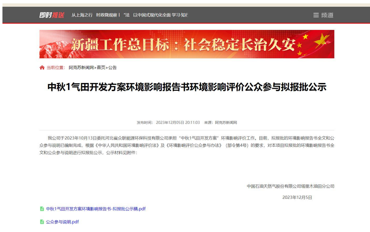
图 6-1 报批前网络公示截图

本次报批前公开方式为网络公开，公开时间为2023年12月5日，公开网站为阿克苏新闻网( http://www.aksxw.com/ )，该网站可以上传并公开项目环境影响报告书全本，选择该网站进行公示符合《环境影响评价公众参与办法》要求。报批前网络公示截图见图6-1。