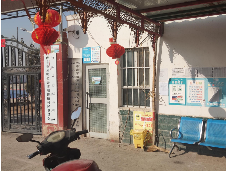
图 3-4 2023 年 11 月 6 日村庄张贴公示情况

我公司于 2023 年 11 月 6 日在周边村庄张贴了项目环境影响报告书公示信息，现场公示照片见图 3-4。