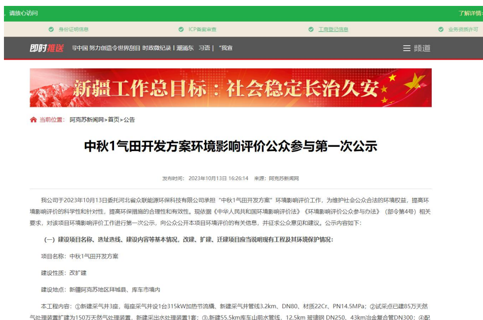
图 2-1 第一次信息公示情况