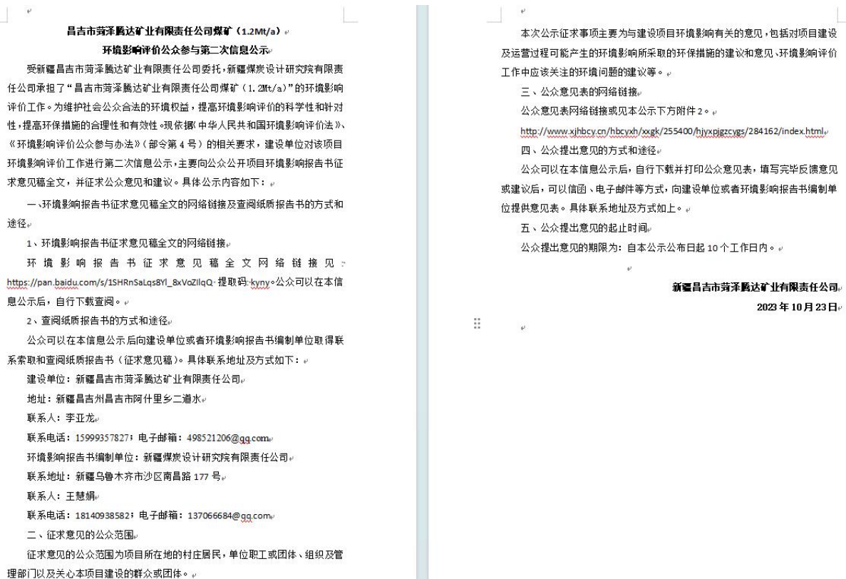
图 3.1-1 征求意见稿公示内容