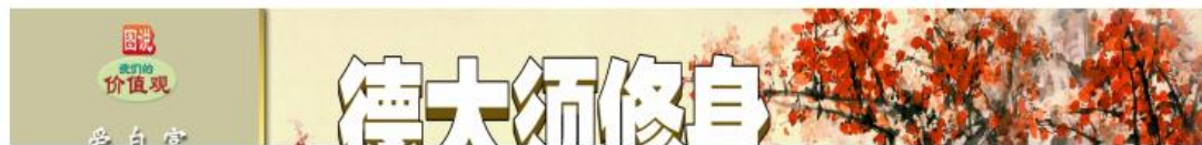
图 3.2-2 征求意见稿阶段第一次报纸公示截图（2023 年 11 月 1 日）