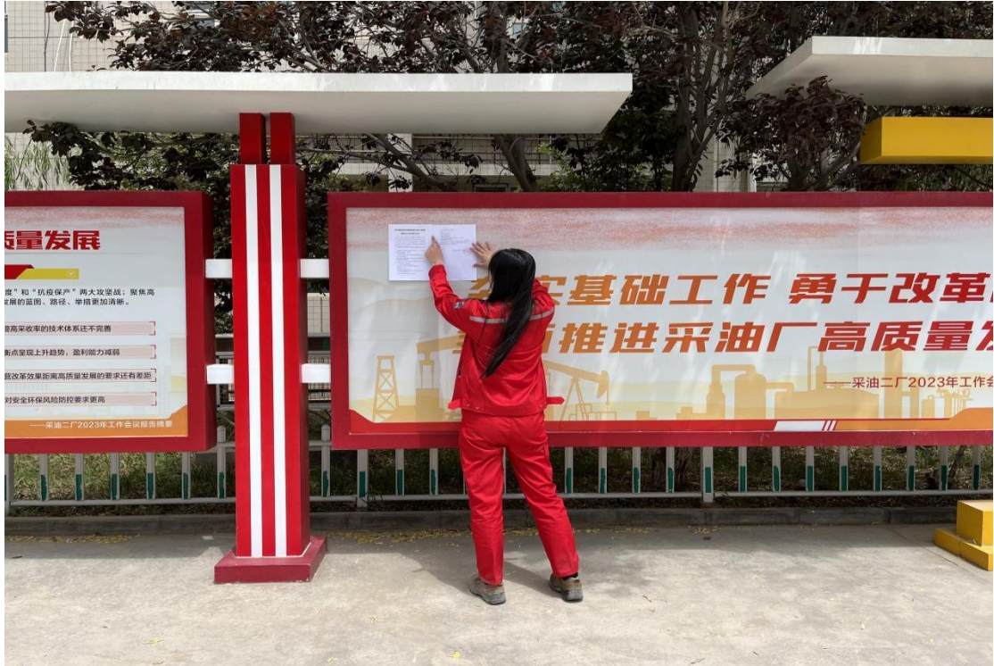
图 3.2-4 本项目张贴公示栏照片