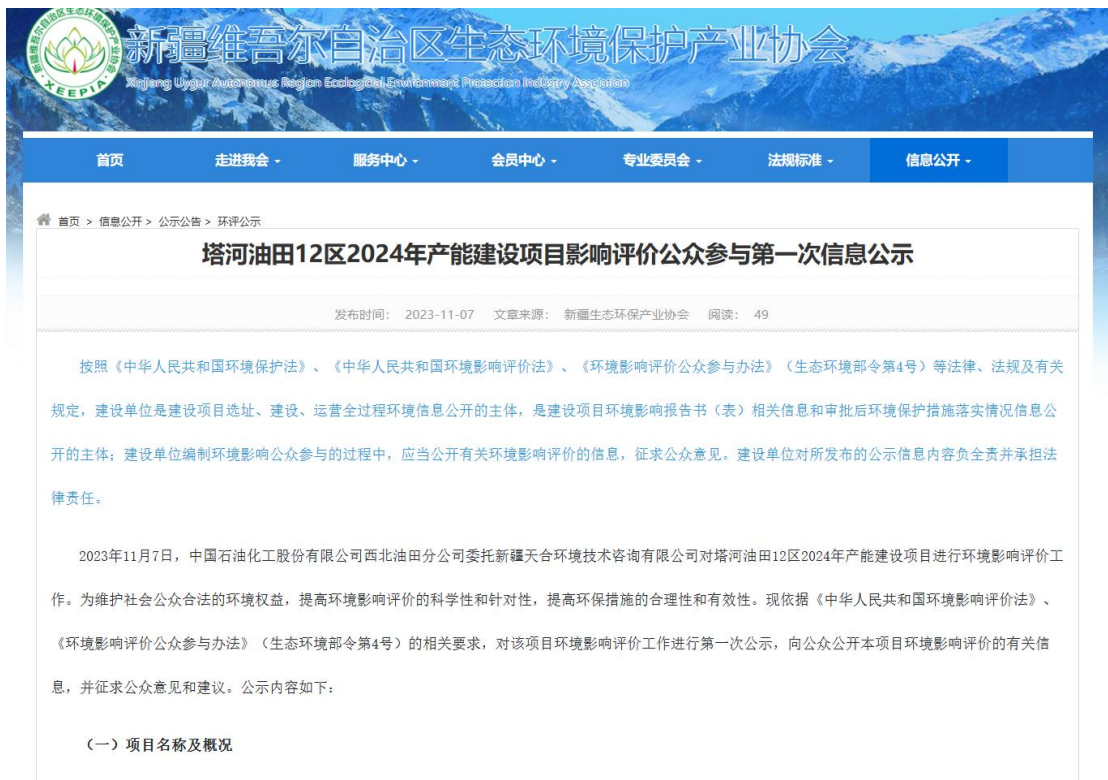
图 2.2-1 本项目第一次网络公示截图

中国石油化工股份有限公司西北油田分公司在新疆维吾尔自治区生态环境保护产业协会网站开展网络公示，载体选择符合《环境影响评价公众参与办法》要求。公示链接： www.xjhbcy.cn/blog/article/12384 ，网络公示截图见图2.2-1。