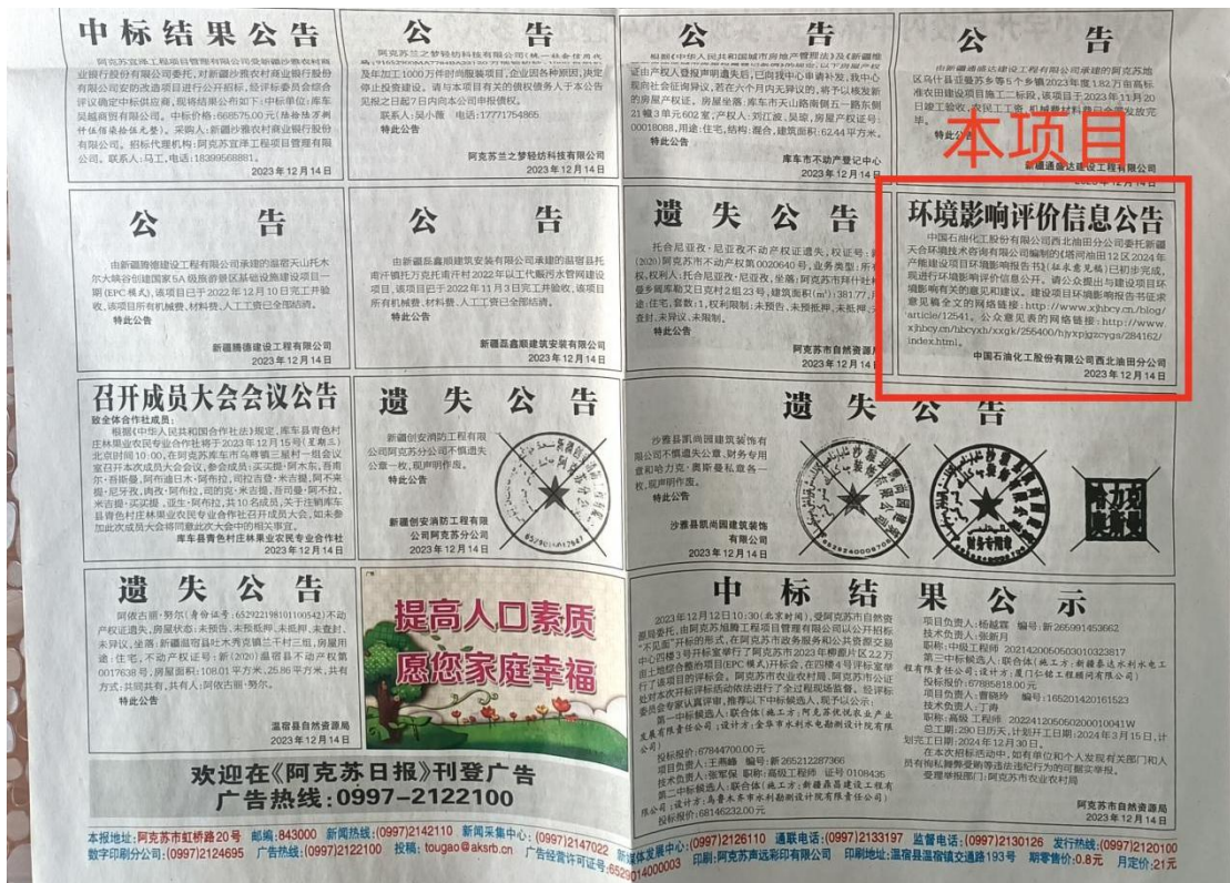
图 3.2-3 本项目第二次报纸公示照片