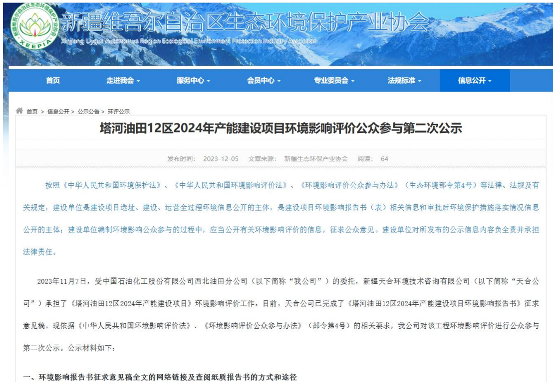
图 3.2-1 本项目征求意见稿网络公示截图