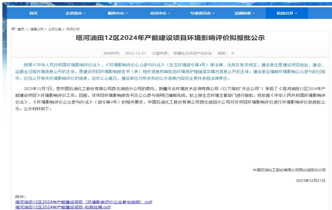
图 6.2-1 拟报批公示网页截图