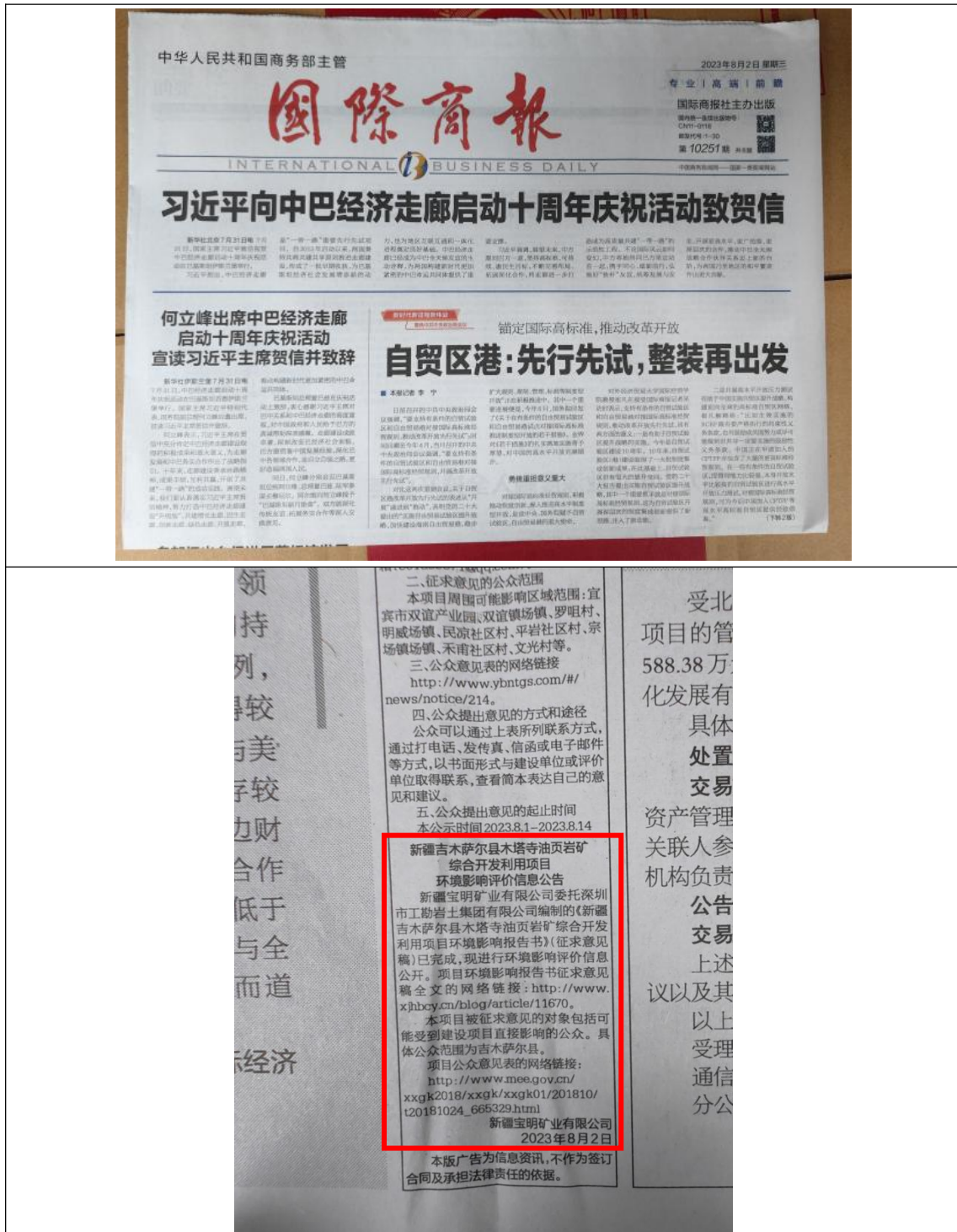
图 3 本项目第一次报纸公示照片