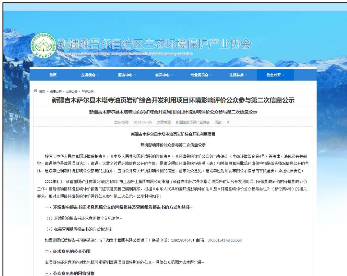
图2 本项目征求意见稿网络公示截图