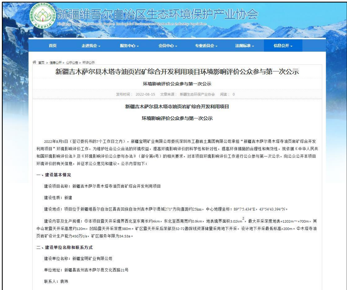
图1 本项目第一次网络公示截图