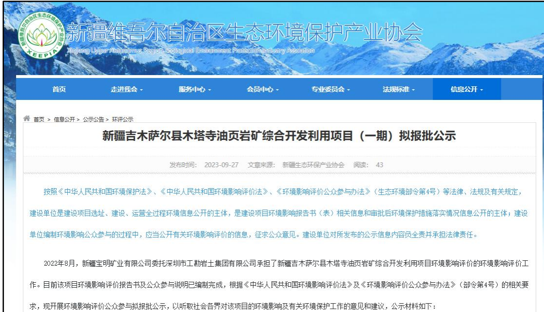
图 6 拟报批公示截图

我公司向新疆生态环境厅报批环境影响报告书前，于 2023 年 9 月 27 日通过网络平台，公开拟报批的环境影响报告书全文和公众参与说明。符合《环境影响评价公众参与办法》要求，公示截图见图 6。