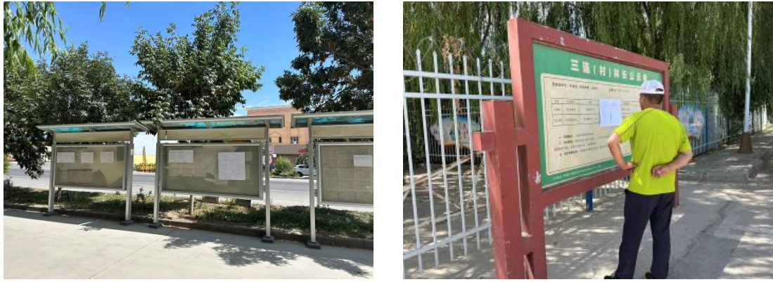
图 3.2-4 本工程公告公示照片