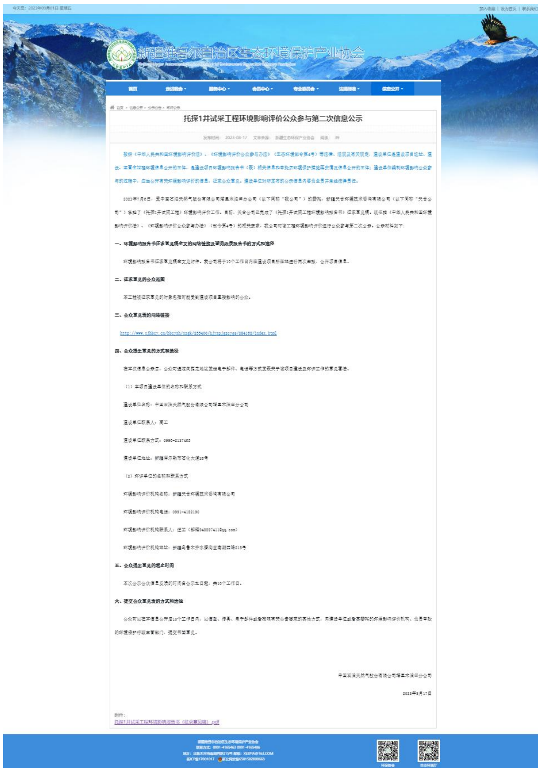
图 3.2-1 本工程征求意见稿网络公示截图