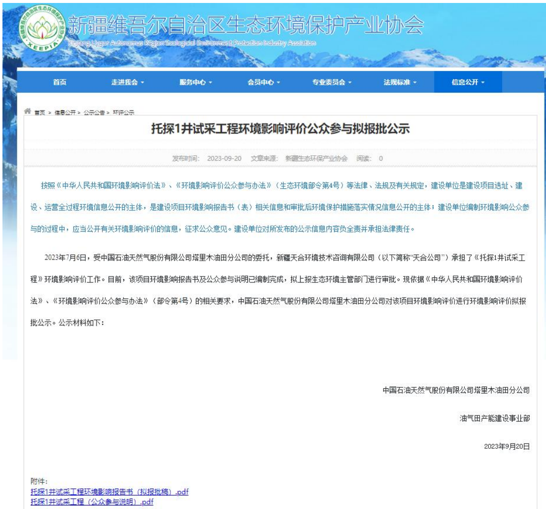
图 6.2-1 拟报批公示网页截图