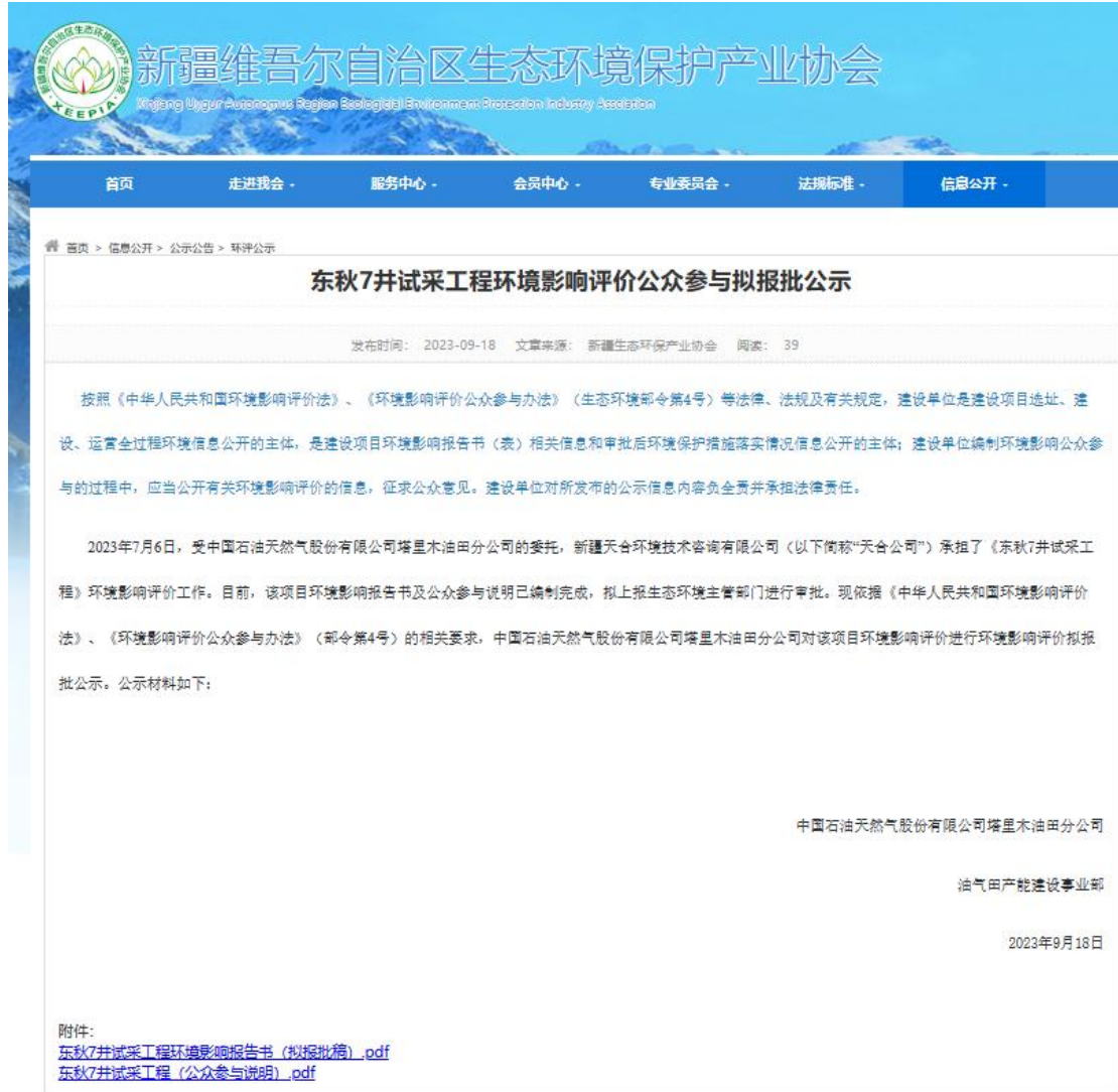
图 6.2-1 拟报批公示网页截图