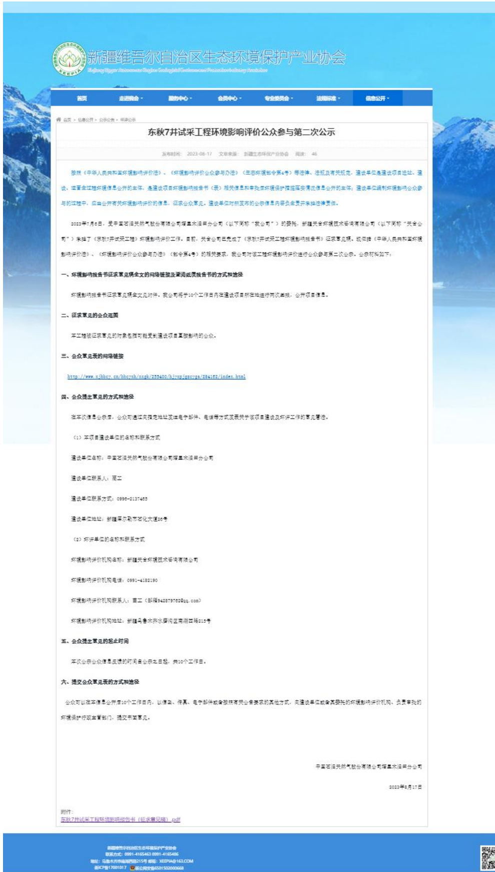
图 3.2-1 本工程征求意见稿网络公示截图