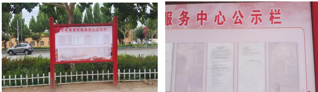
图 3.2-4 本工程公告公示照片