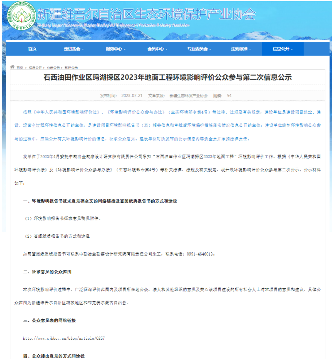
图 3-1 项目公众参与第二次信息公示截图