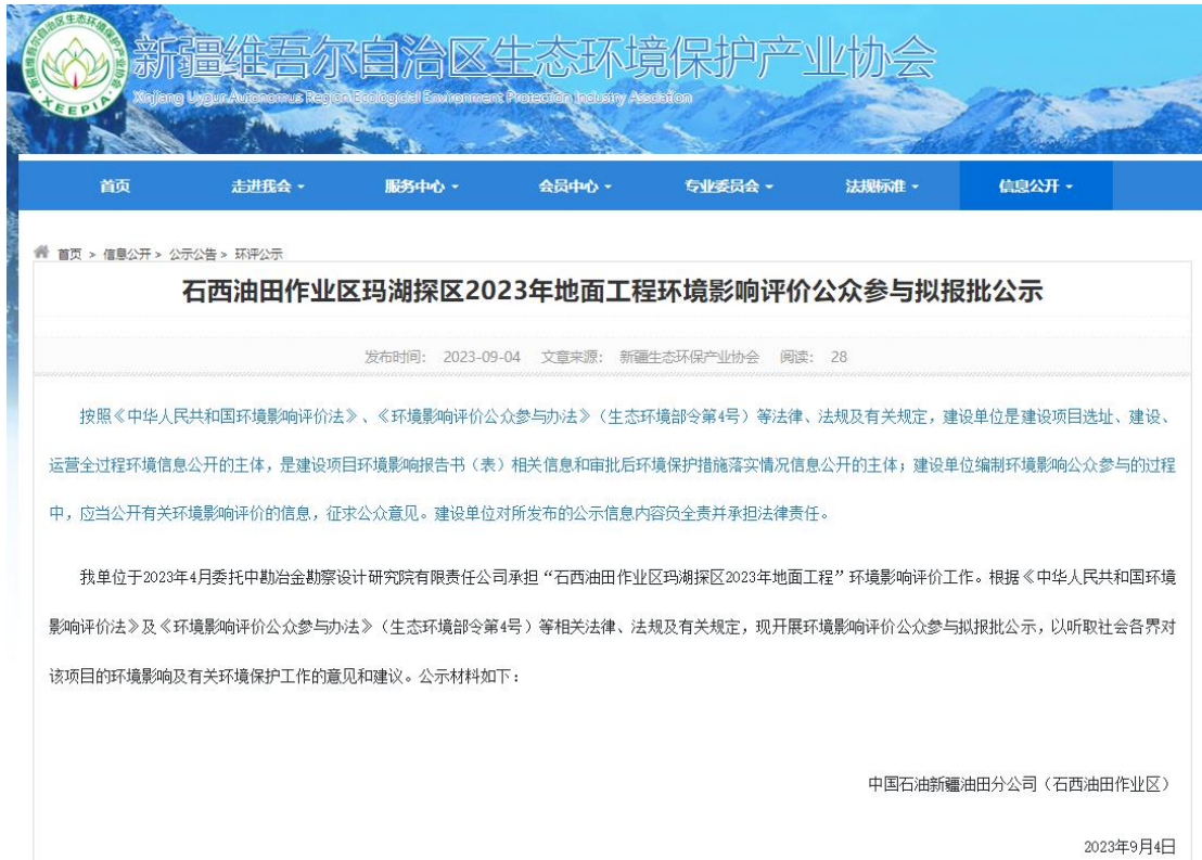
图 6-1 拟报批报公示截图