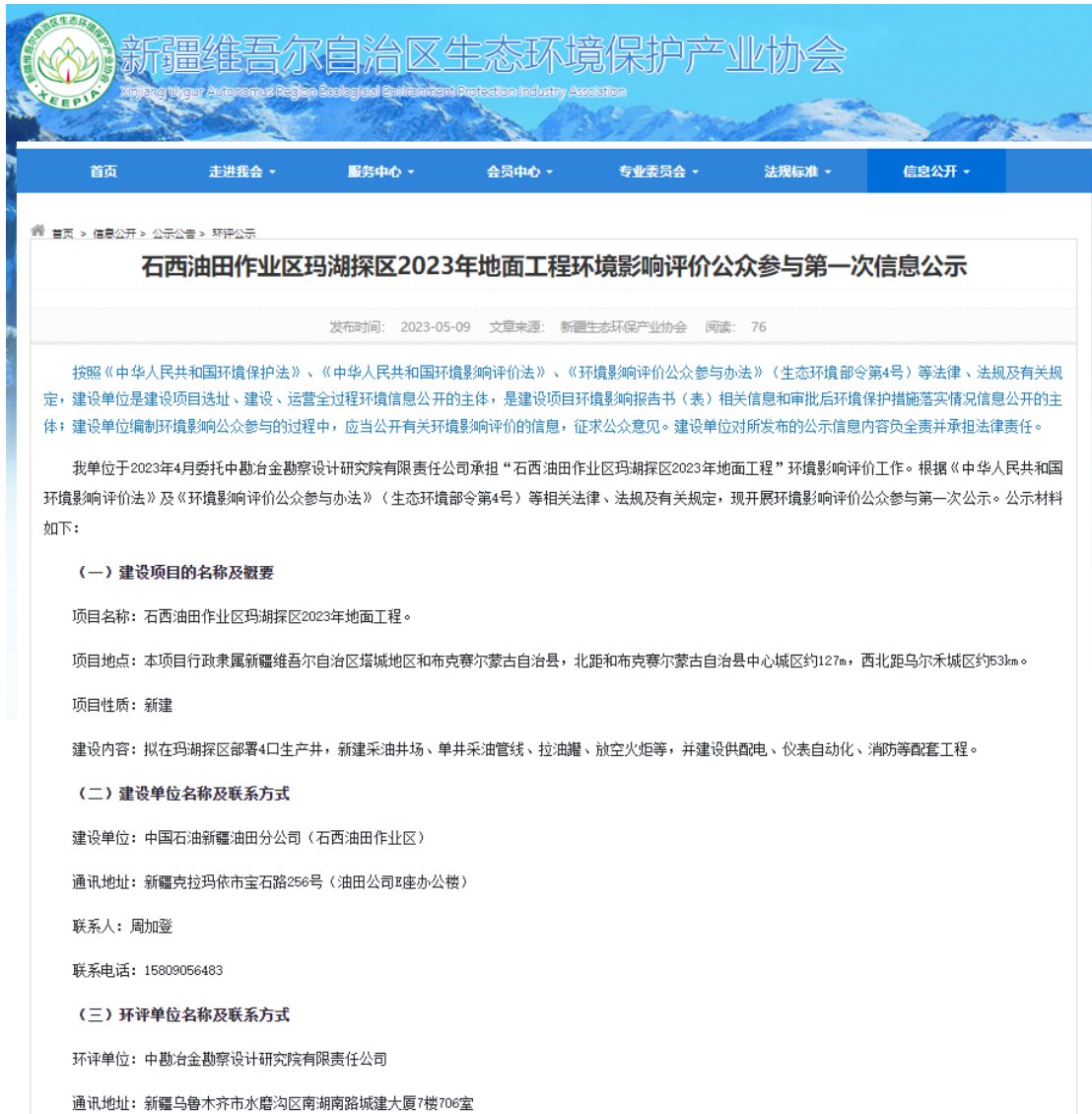
图 2-1 项目公众参与第一次信息公示截图