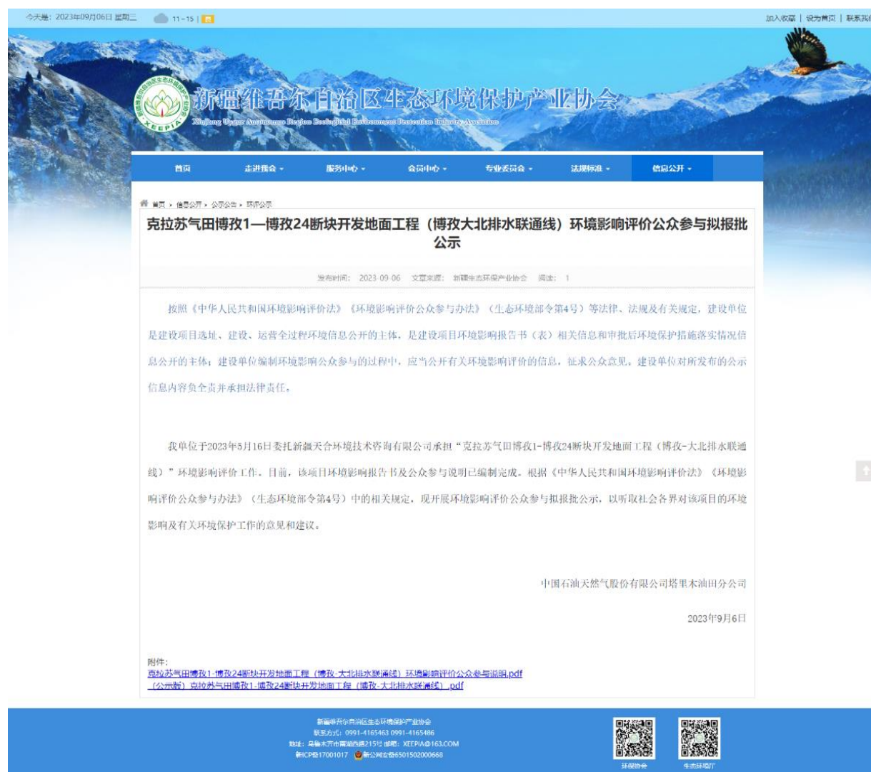
图 5 环境影响评价报批前公示截图

公告网址： http://www.xjhbcy.cn/blog/article/12033 ；报批前网络公示截图见图 5。