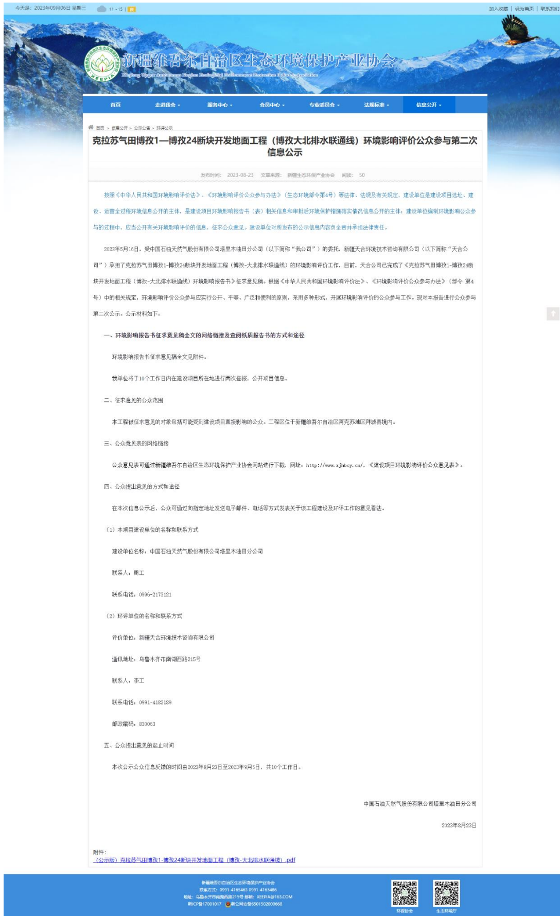
图 2 本工程征求意见稿网络公示截图