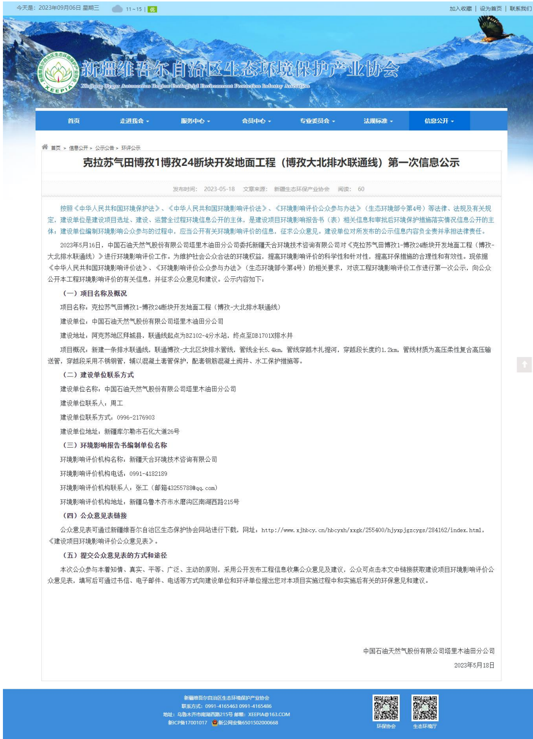
图 1 本工程第一次网络公示截图