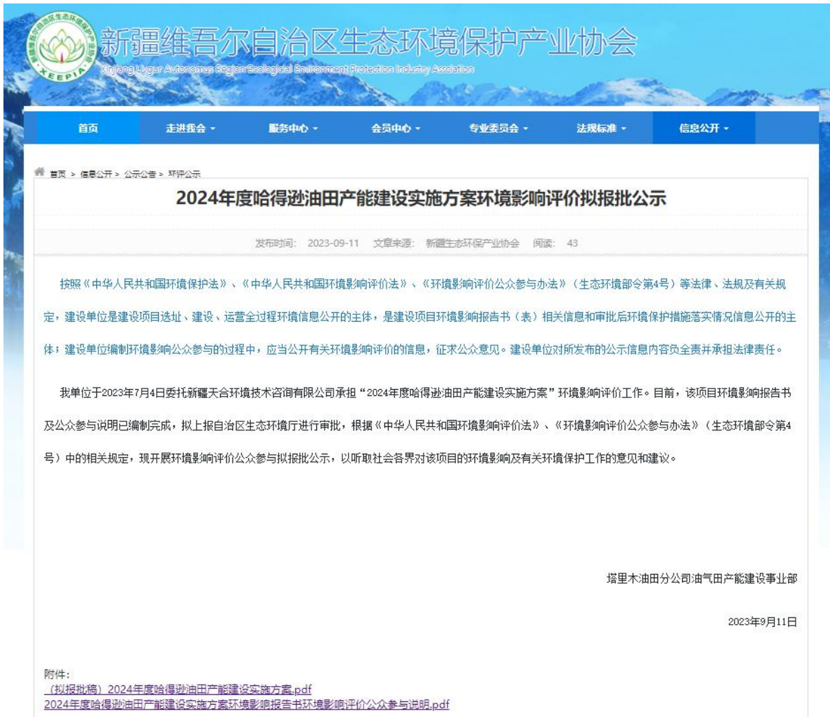
图 6 本项目拟报批稿网络公示截图