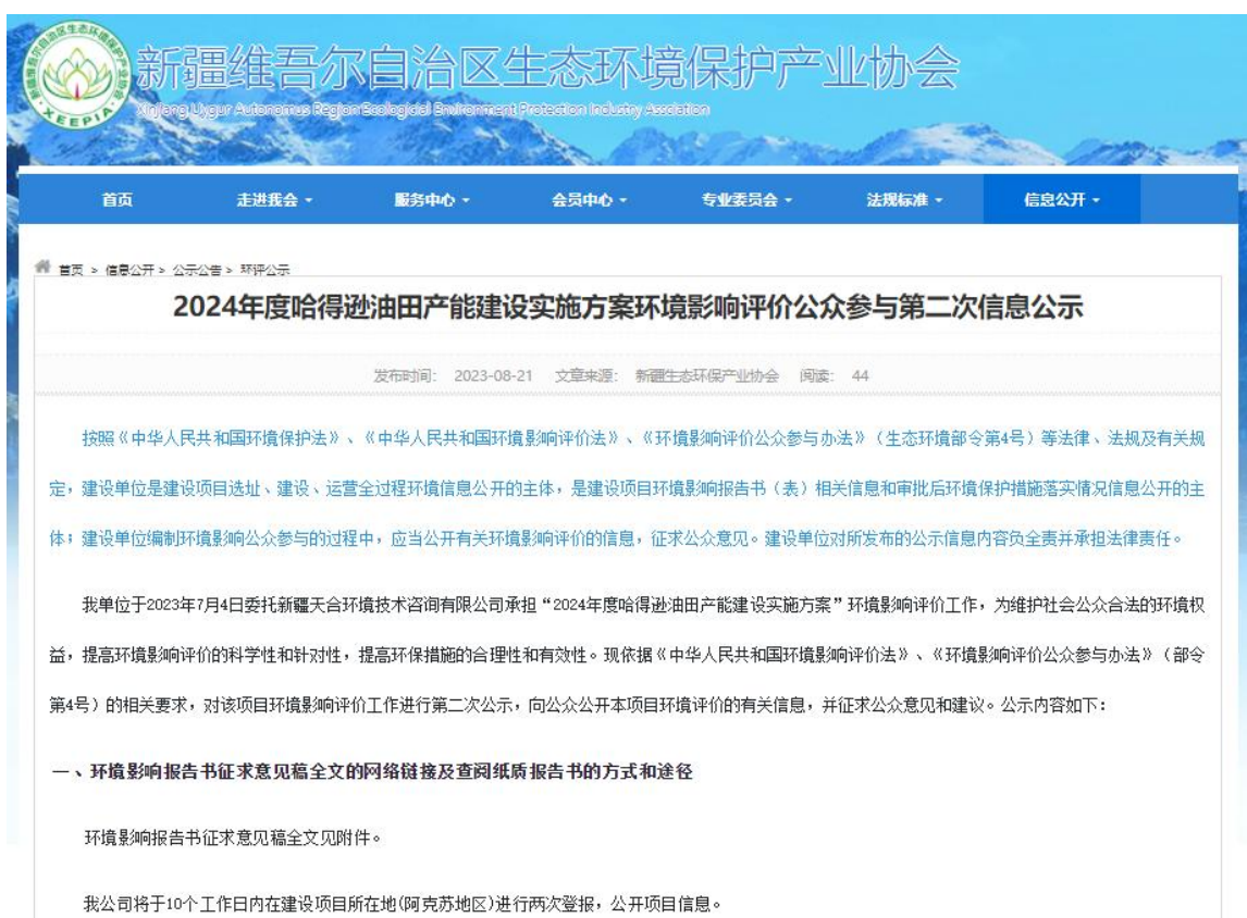
图2 本项目征求意见稿网络公示截图