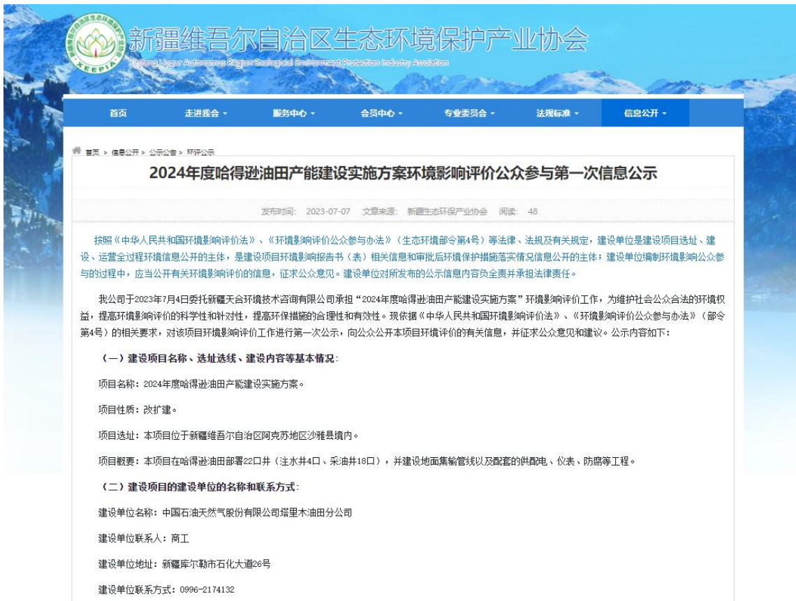
图 1 本项目第一次网络公示截图