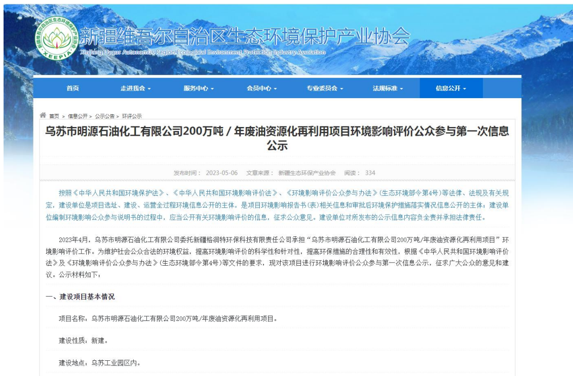
图1 第一次网上公示