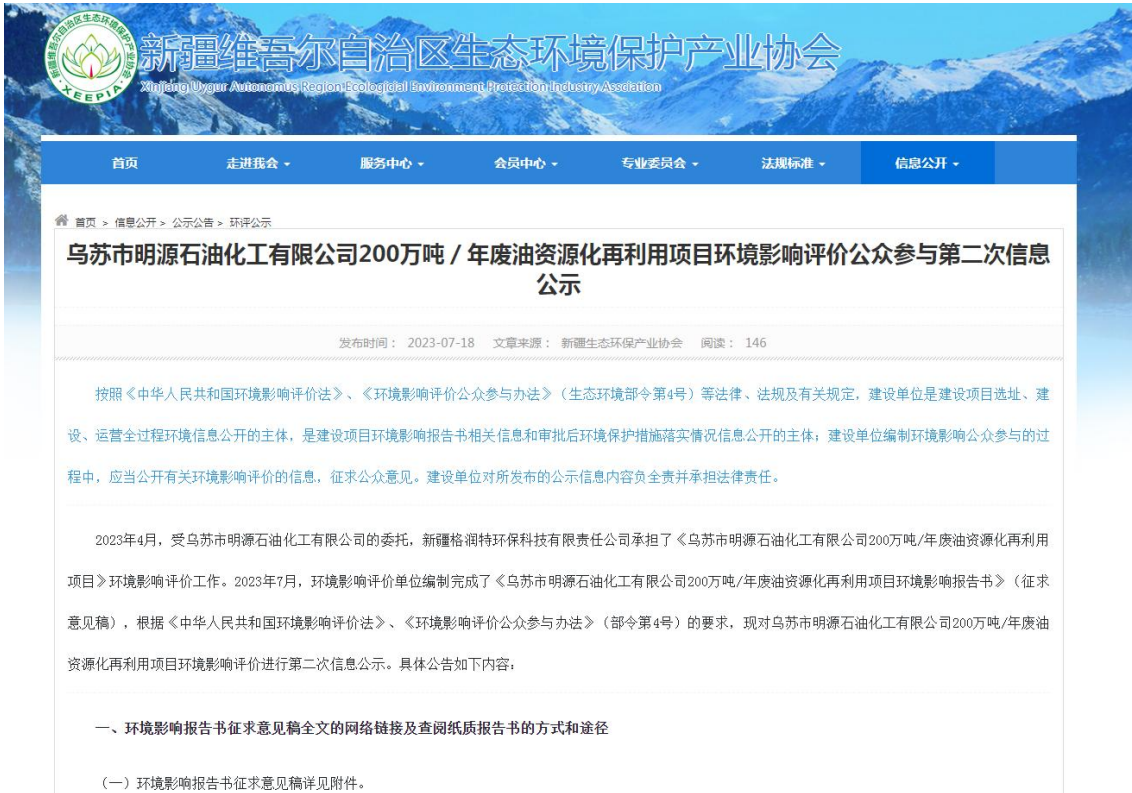
图2 第二次网上公示