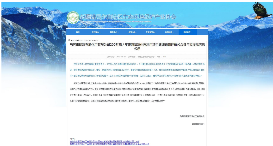
图 6 公众参与拟报批信息公示

乌苏市明源石油化工有限公司于 2022 年 08 月 25 日在新疆维吾尔自治区生态环境保护协会网站 ( http://www.xjhbcy.cn/blog/article/10259 ) 上进行了公众参与拟报批信息公示，向公众告知拟报批的相关信息。公示载体选择符合《环境影响评价公众参与办法》要求。公众参与拟报批信息公示截图见图 6。