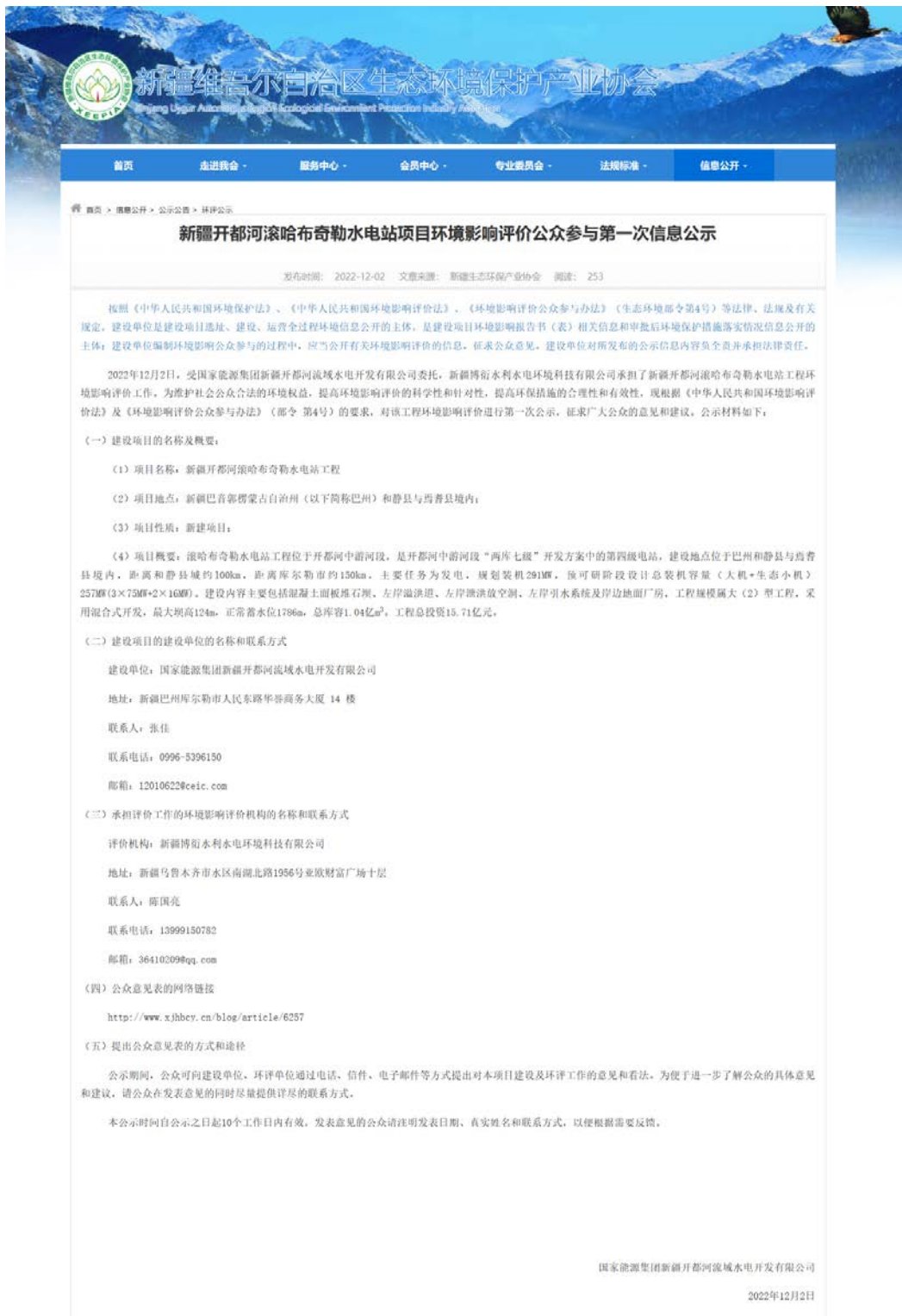
图 2.2-1 本项目第一次网络公示截图

国家能源集团新疆开都河流域水电开发有限公司在自治区生态环境保护产业协会官网开展网络公示，载体符合《环境影响评价公众参与办法》要求。公示的链接为： www.xjhbcy.cn ，网络公示截图见图 2.2-1