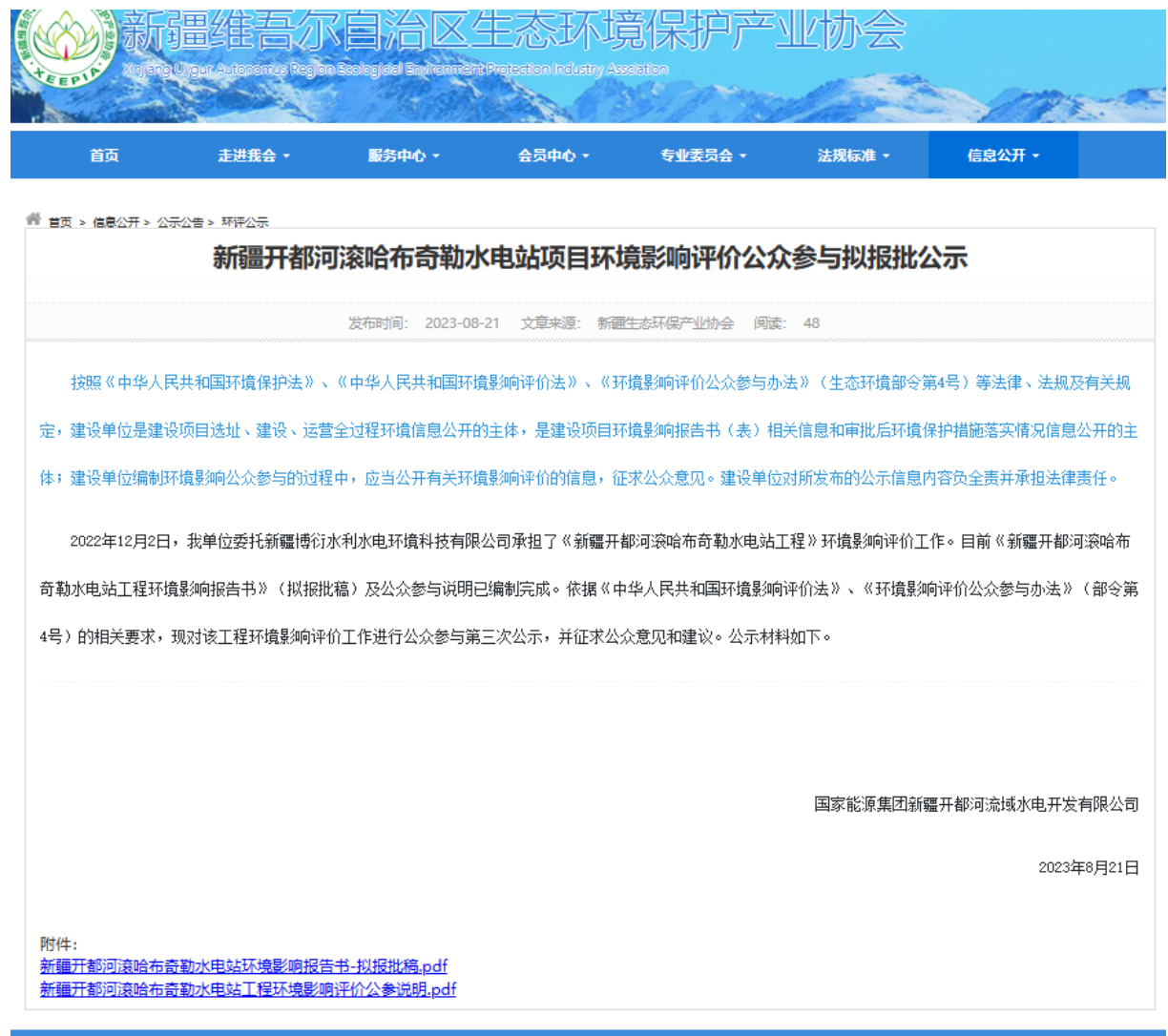
图 6.1-1 本项目第三次网络公示截图

国家能源集团新疆开都河流域水电开发有限公司在自治区生态环境保护产业协会官网开展网络公示，载体符合《环境影响评价公众参与办法》要求。公示的连接为： http://www.xjhbcy.cn/blog/article/11911 ，网络公示截图见图6.1-1