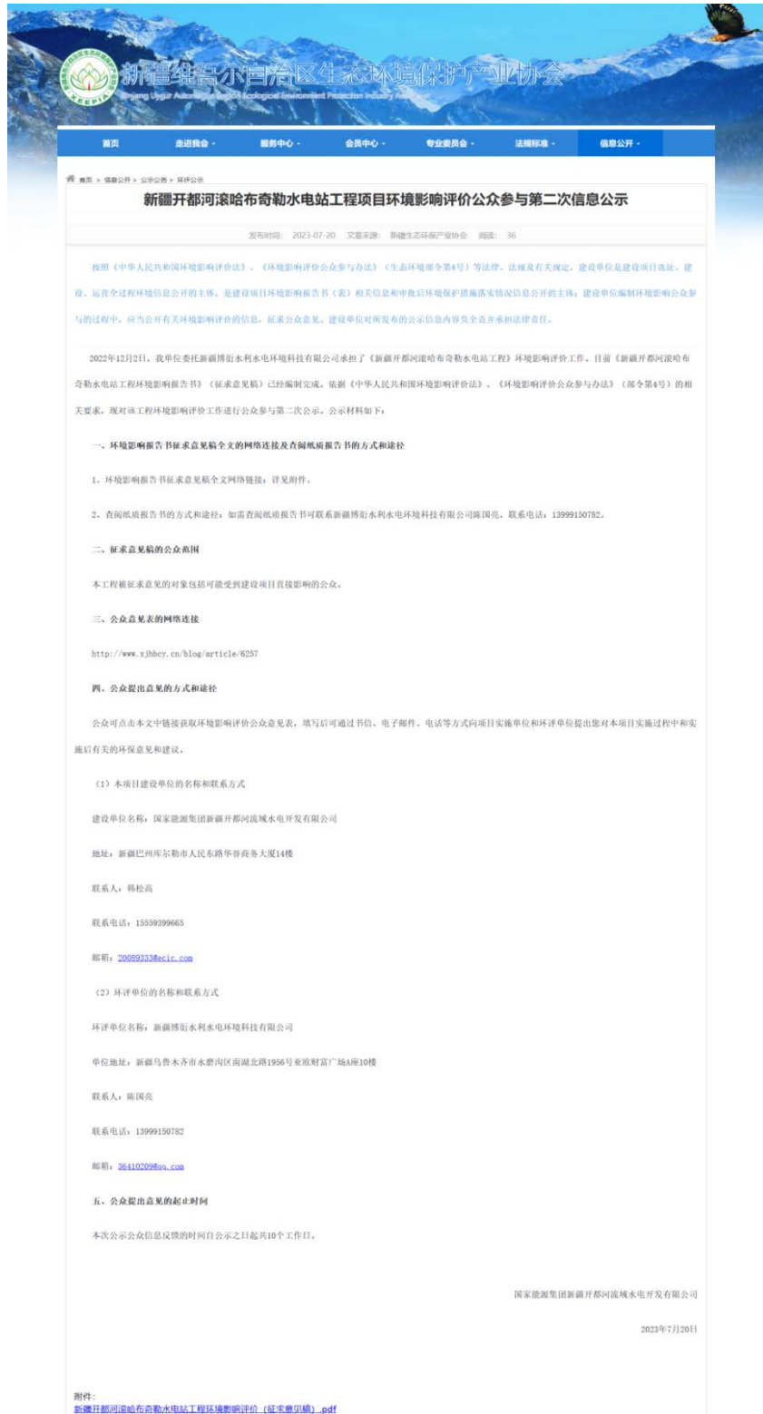
图 3.2-1 本项目第二次网络公示截图