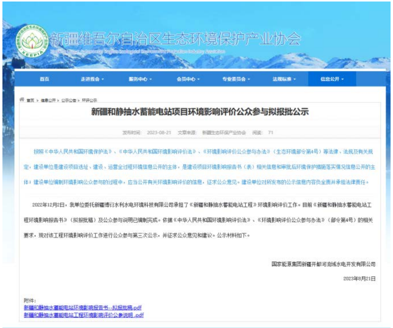
图 6.2-1 本项目第三次网络公示截图