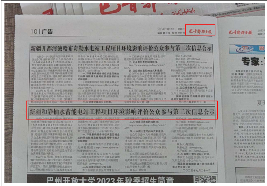
图 3.2-2 第二次公示-报纸公示（7月21日、7月26日）