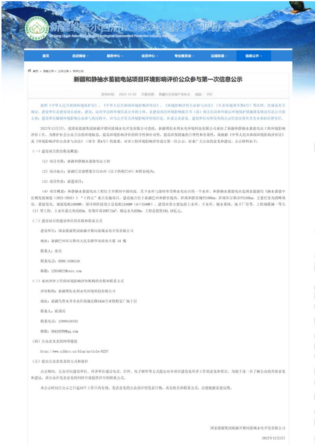
图 2.2-1 本项目第一次网络公示截图

国家能源集团新疆开都河流域水电开发有限公司在自治区生态环境保护产业协会官网开展网络公示，载体符合《环境影响评价公众参与办法》要求。公示的链接为： www.xjhbcy.cn ，网络公示截图见图 2.2-1。