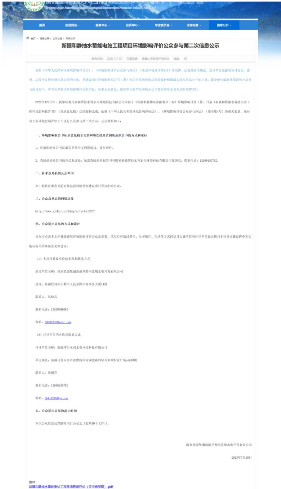
图 3.2-1 本项目第二次网络公示截图