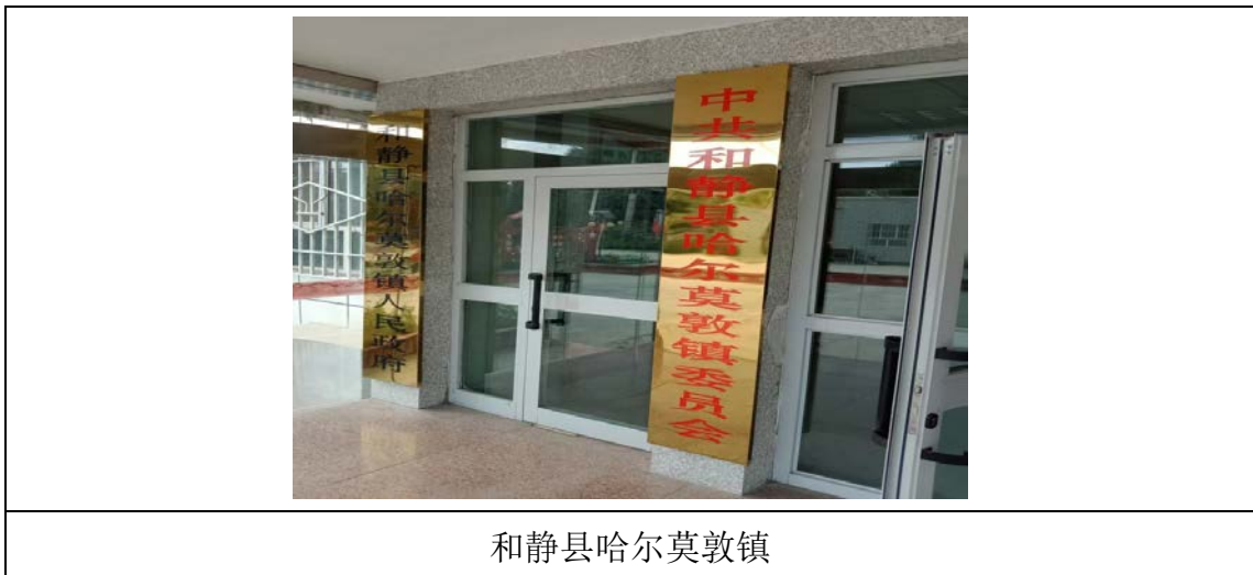
和静县哈尔莫敦镇