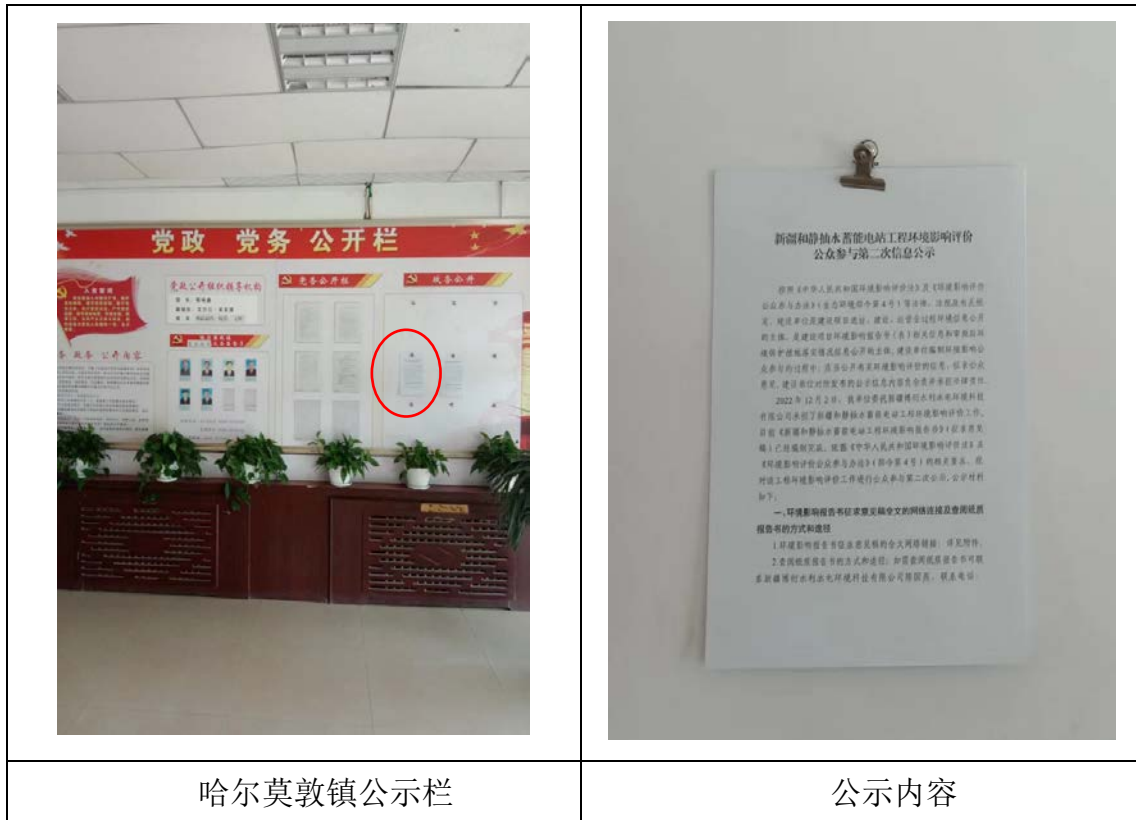
图 3.2-3 现场张贴公示