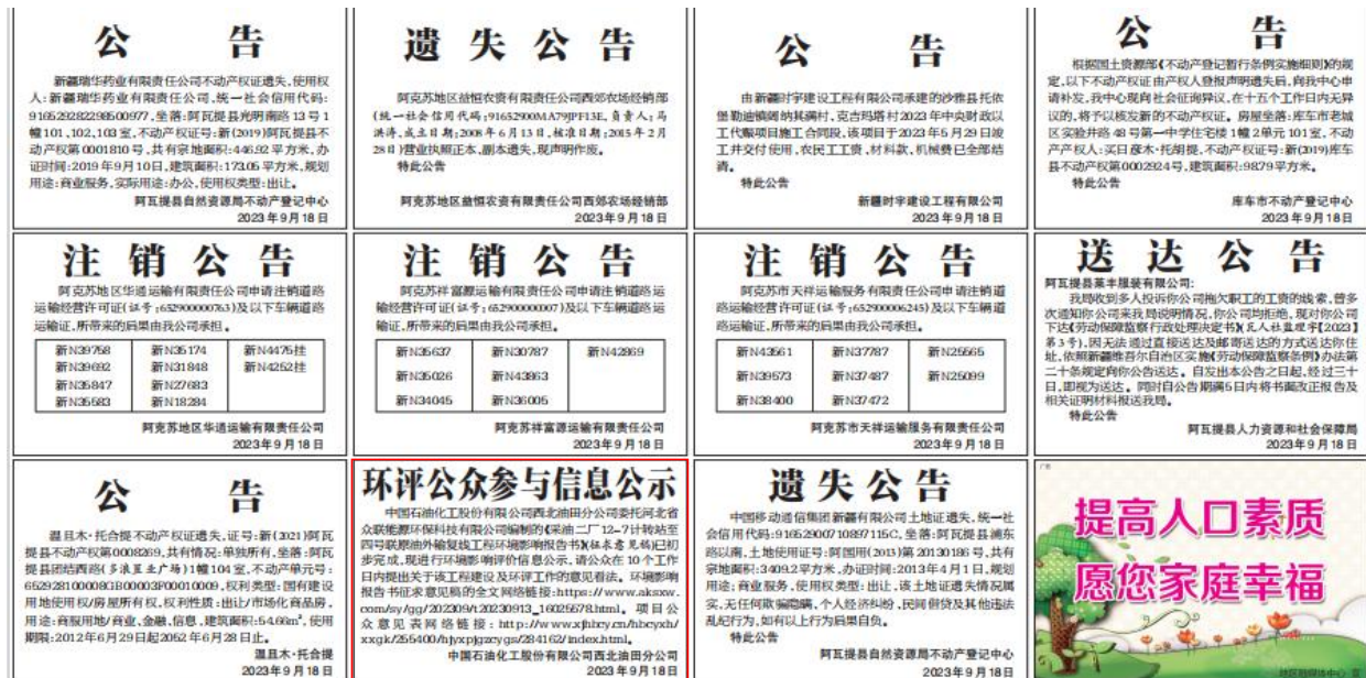
图 3-3 2023 年 9 月 18 日报纸公示情况