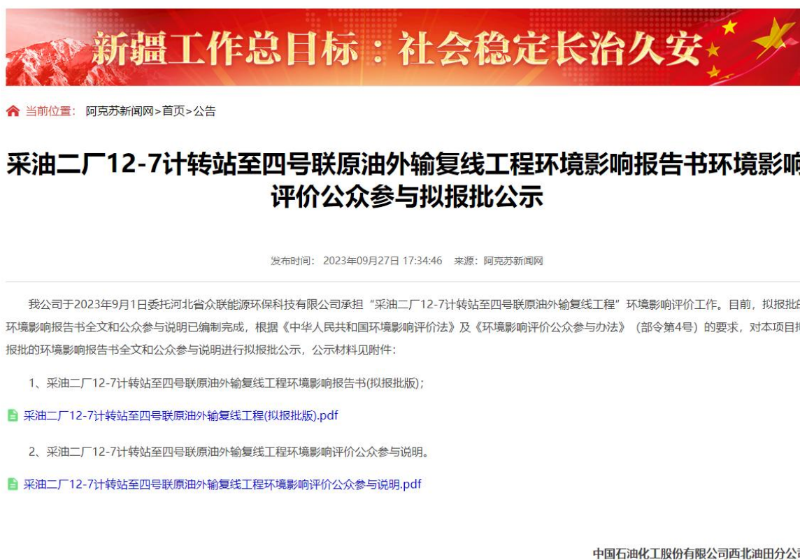
图 6-1 报批前网络公示截图

本次报批前公开方式为网络公开，公开时间为2023年9月27日，公开网站为阿克苏新闻网网站( http://www.aksxw.com/aksxw/content/ )，该网站可以上传并公开项目环境影响报告书全本，选择该网站进行公示符合《环境影响评价公众参与办法》要求。报批前网络公示截图见图6-1。