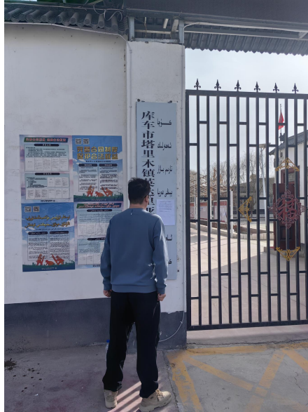
图 3-4 2023 年 9 月 19 日村庄张贴公示情况

我公司于 2023 年 9 月 19 日在周边村庄张贴了项目环境影响报告书公示信息，现场公示照片见图 3-4。