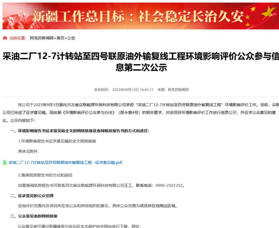
图 3-1 第二次信息公示情况

我公司在阿克苏新闻网网站( https://www.aksxw.com/sy/gg/202309/t20230913_16025578.html )上发布了征求意见稿公示信息，对环境影响报告书征求意见稿全文进行公开，公示时限为10个工作日，网站第二次公告截图见图3-1。