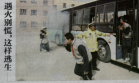
遇火别慌,这样逃生

3月27日,库尔勒市公安局交警大队二十中队民警来到库尔勒市第二中学,开展“播放文明守法种子”护校学生安全出行”安全教育课。民警利用大型客车进行场景模拟,组织师生体验发生“火灾”时,如何安全、有序、快速撤离,同时讲解交通安全知识,进一步强化师生“知危险会避险”意识。石磊云/新疆法制报 记者 李进博 通讯员 严万海 报