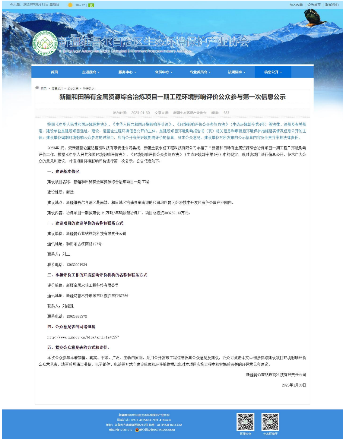
图 2-1 第一次网络公示截图