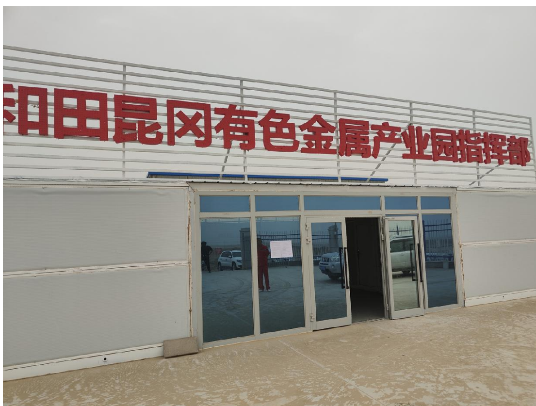
图 2-6 和田昆冈有色金属产业园指挥部张贴公示