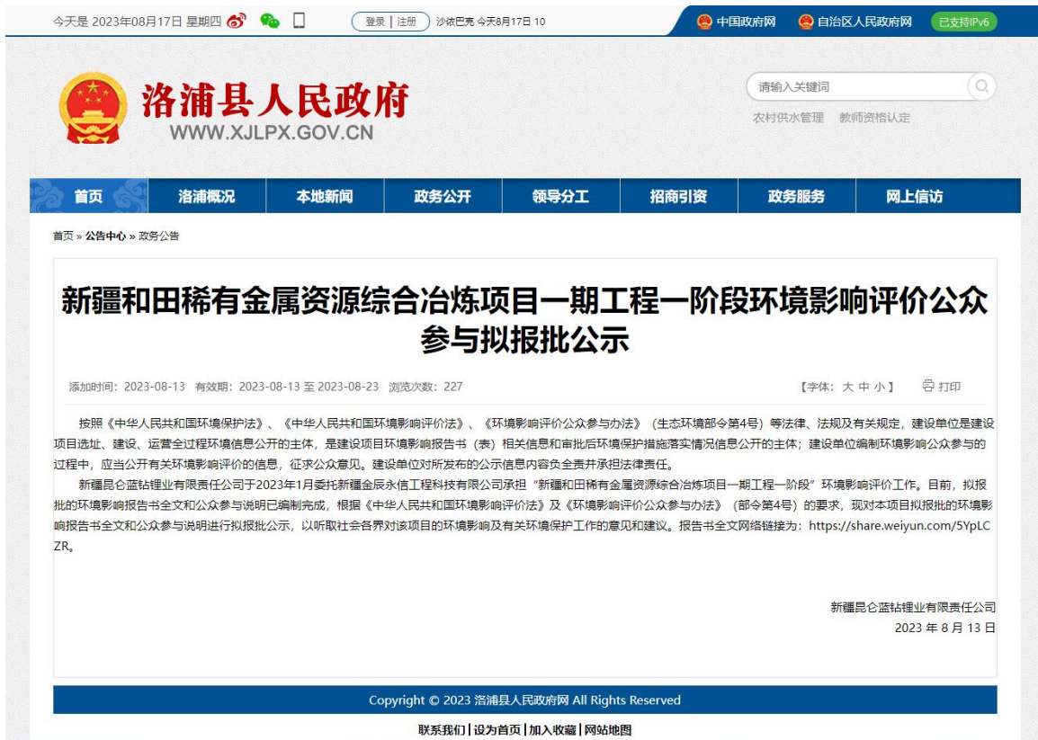
图 6-1 拟报批网络公示截图