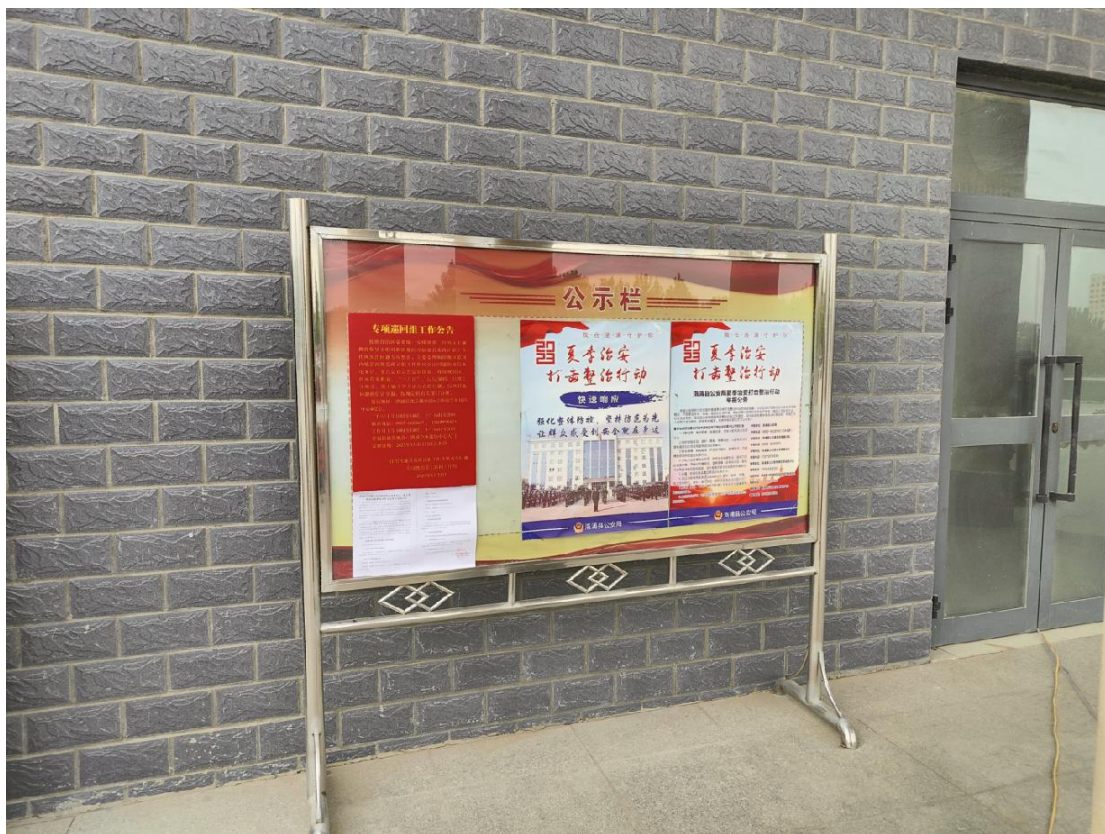
图 2-5 洛浦县县政府公示栏张贴公示