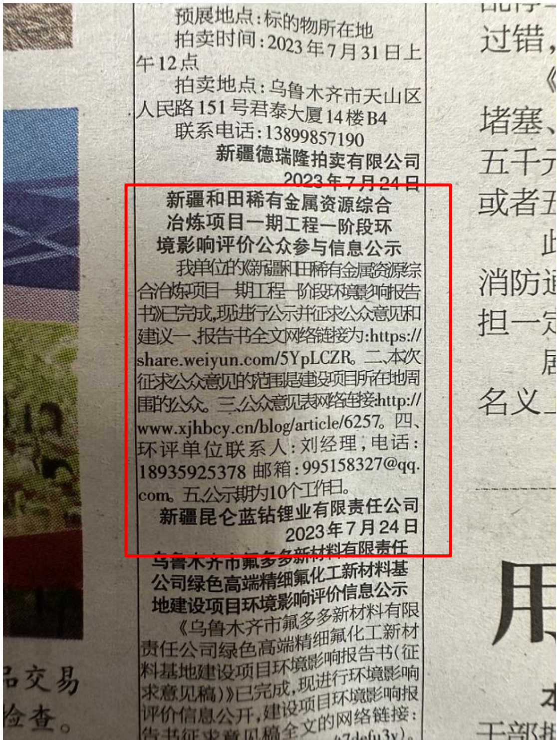
图 2-4 新疆法制日报报纸公示二