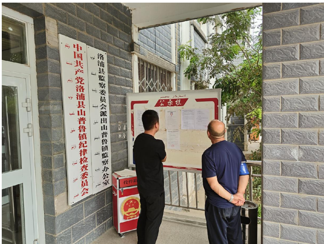
图 2-5 洛浦县山普鲁镇政府公示栏张贴公示