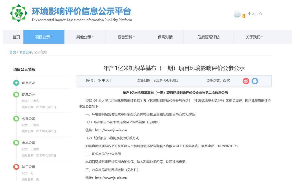
图2 本项目征求意见稿网络公示截图