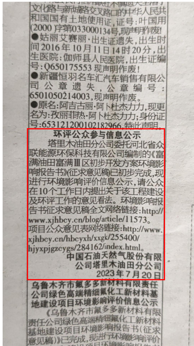
图 3-3 2023 年 7 月 20 日新疆法制报公示情况