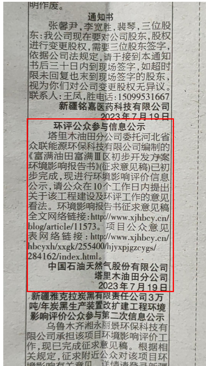
图 3-2 2023 年 7 月 19 日新疆法制报公示情况

在网络公示的同时，我公司于2023年7月19日、2023年7月20日在《新疆法制报》(刊号：CN65-0044)上发布了项目环境影响报告书公示信息，报纸公示照片见图3-2至图3-3。