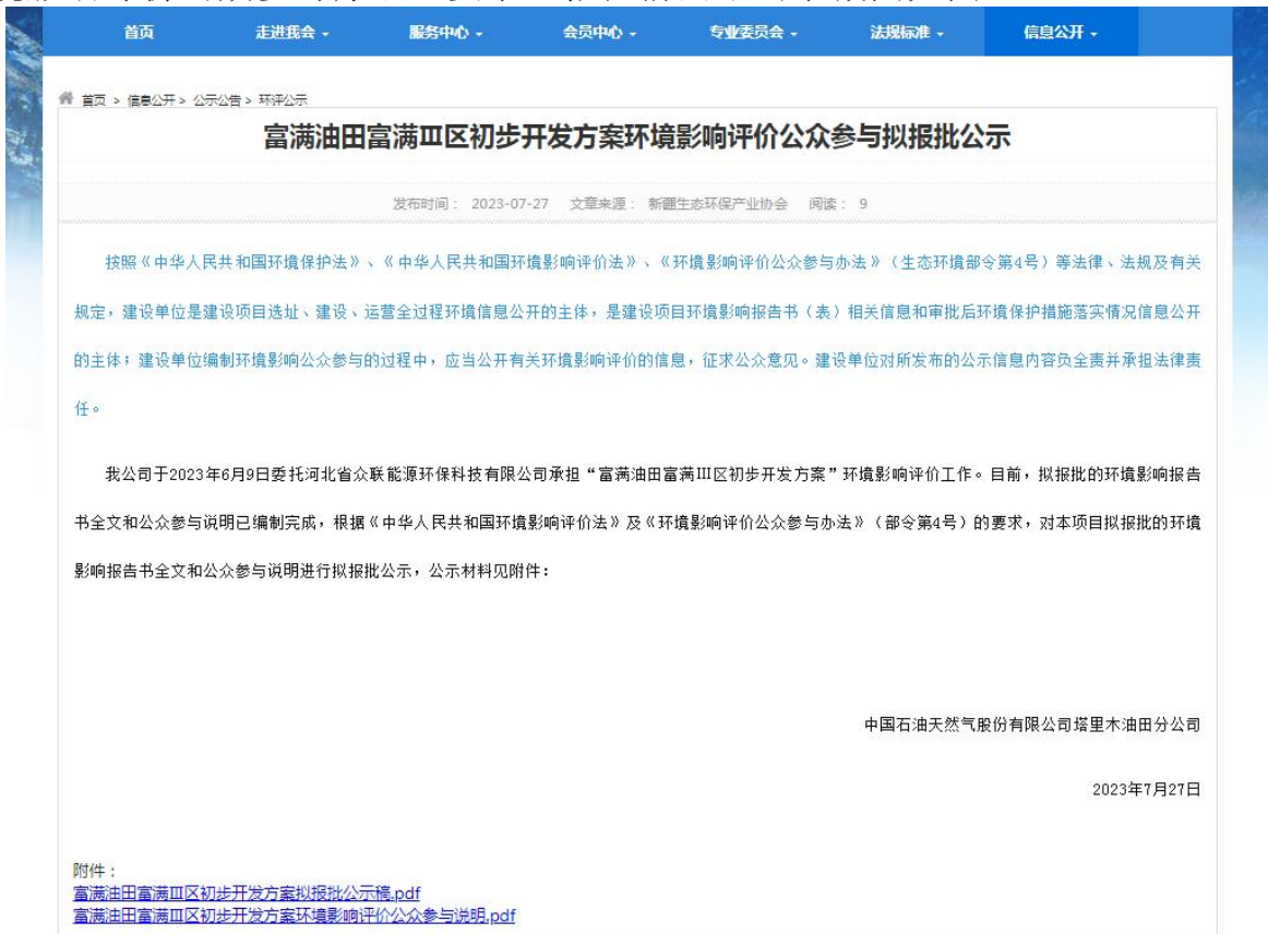
图 6-1 报批前网络公示截图

本次报批前公开方式为网络公开，公开时间为2023年7月27日，公开网站为新疆维吾尔自治区生态环境保护产业协会网站(XXXXX)，该网站访问流量较大，且可以上传并公开项目环境影响报告书全本，选择该网站进行公示符合《环境影响评价公众参与办法》要求。报批前网络公示截图见图6-1。