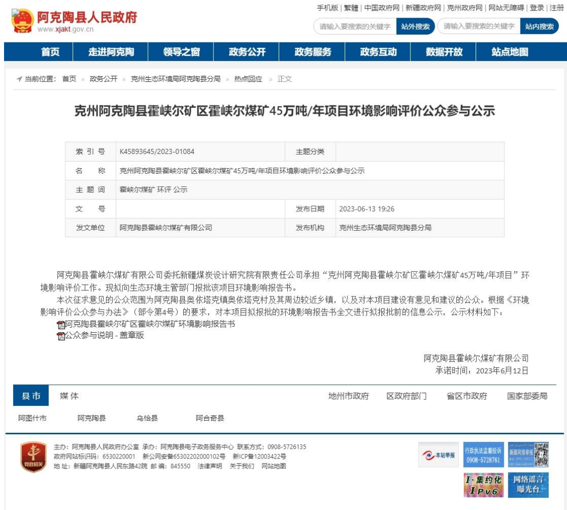
图 6.1-1 拟报批前网络公示截图

http://www.xjakt.gov.cn/xjakt/c104793/202306/9b5e2ad04b9642c2b7b9f2b4d18c7a37.shtml）对《克州阿克陶县霍峡尔矿区霍峡尔煤矿45万吨/年项目环境影响报告书（公示本）》以及《克州阿克陶县霍峡尔矿区霍峡尔煤矿45万吨/年项目环境影响评价公众参与说明》进行了的全文公开，公开的内容未包含国家秘密、商业秘密、个人隐私等依法不应公开的内容，符合《环境影响评价公众参与办法》相关要求。