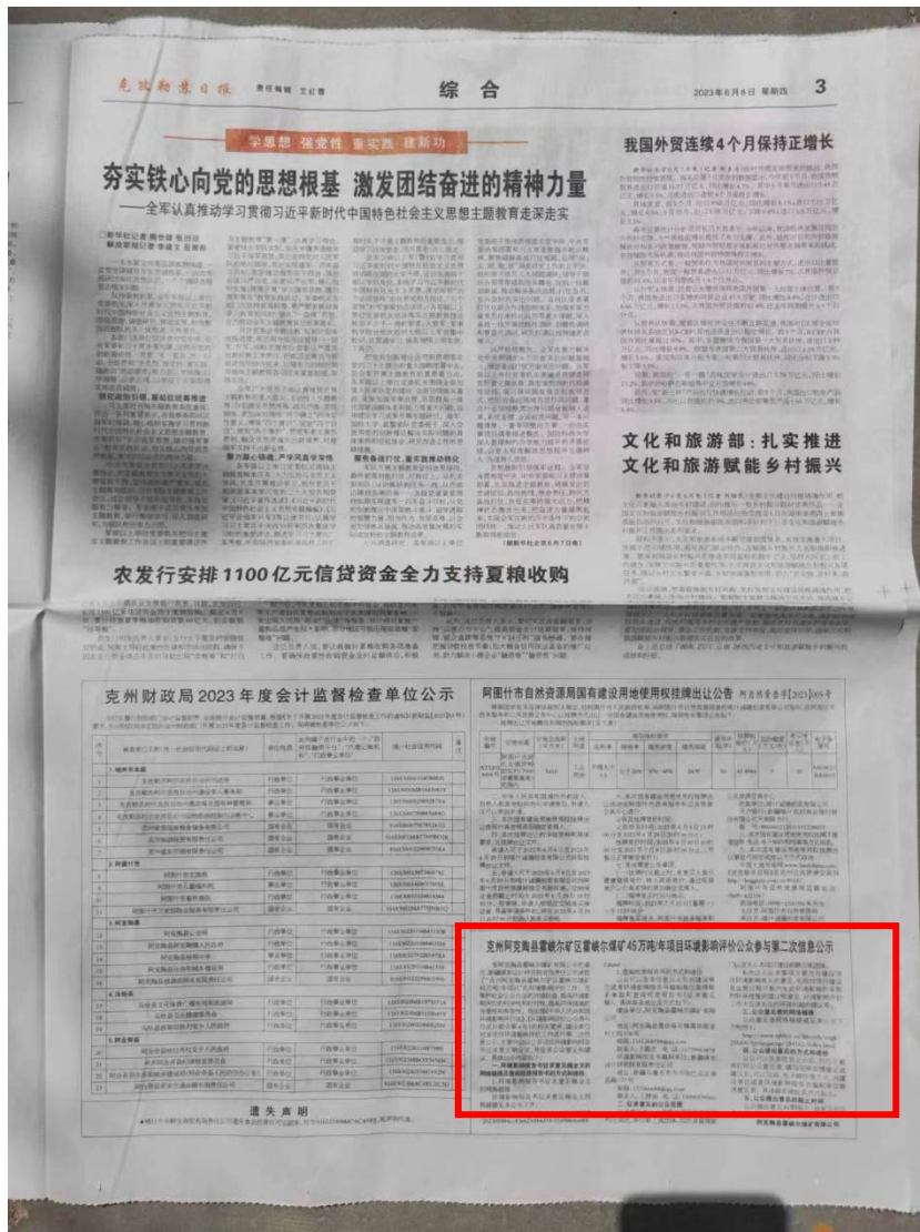
图 3.2-3 征求意见稿阶段第二次报纸公示截图（2023 年 6 月 8 日）