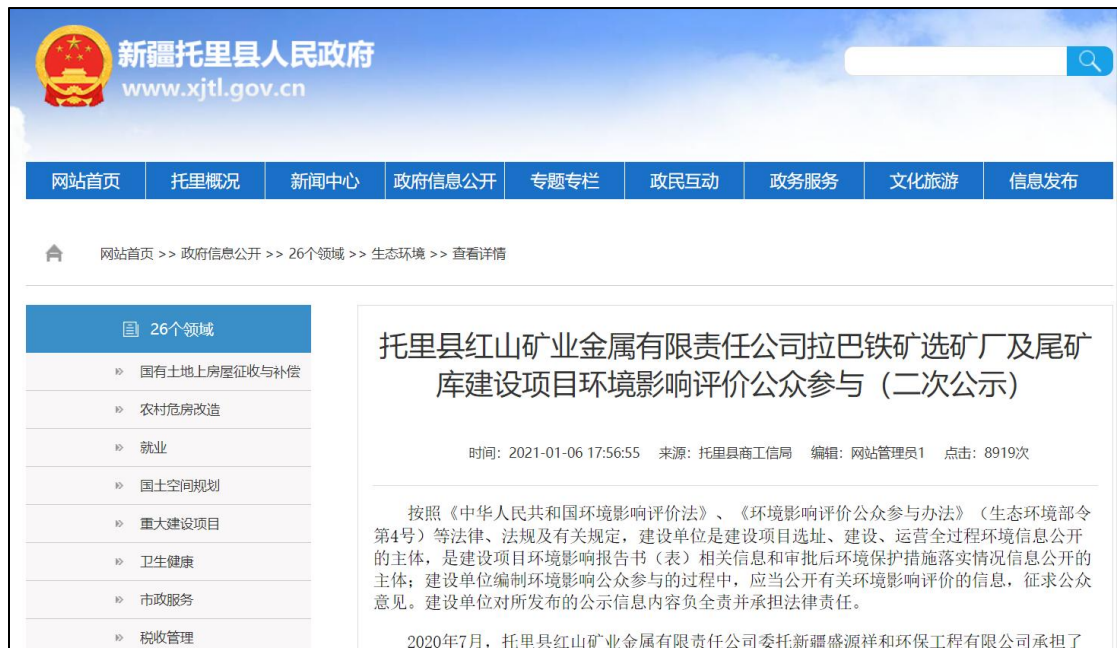
图 2 征求意见稿网络公示截图