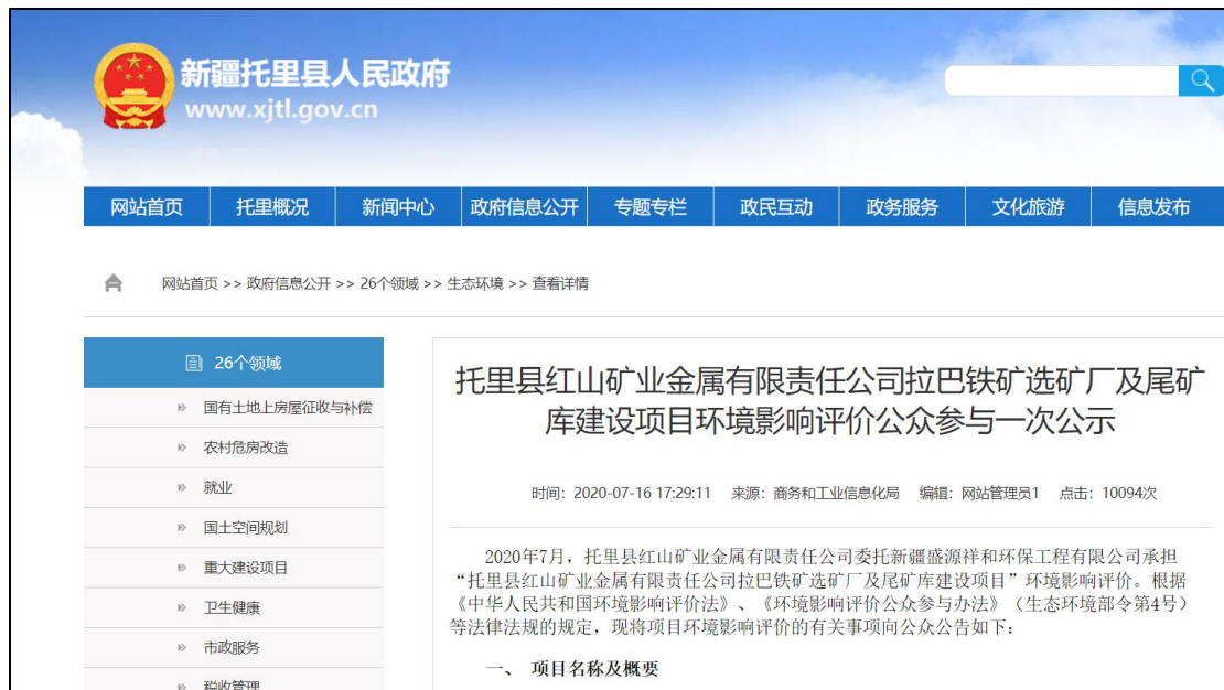
图 1 首次环境影响评价信息网络公示截图