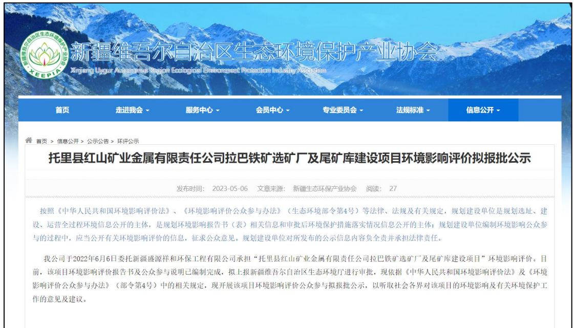
图 7 拟报批稿网络公示截图