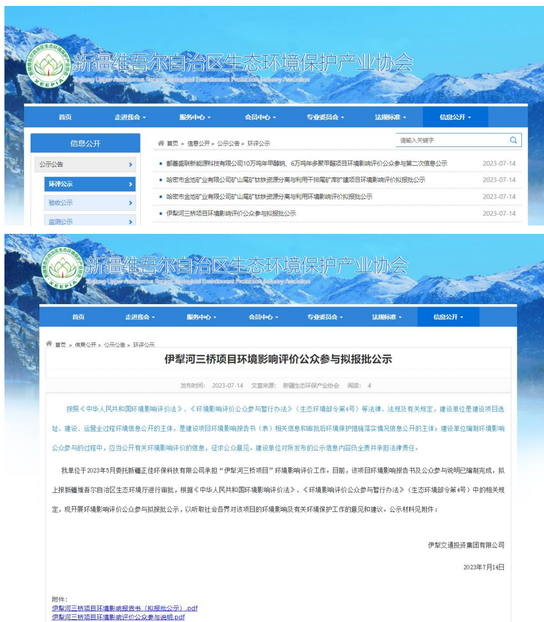
图6 报批前网上公示截图