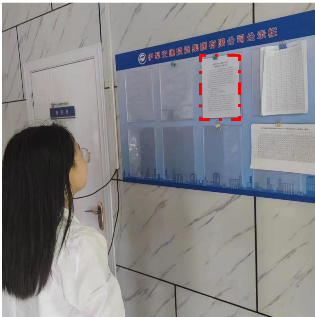
图5 公示现场照片（6月12日）