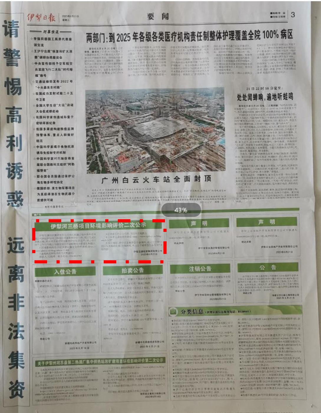
图4 本项目第二次报纸公示照片（6月21日）