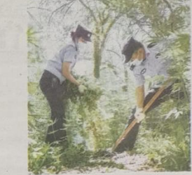
▲6月24日,新疆出入境边防检查总站塔城边境管理支队阿布都拉提边境派出所民警铲除野生大麻原植物。