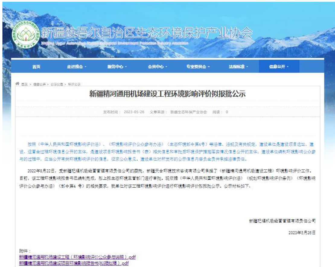
图 6.2-1 拟报批公示网页截图