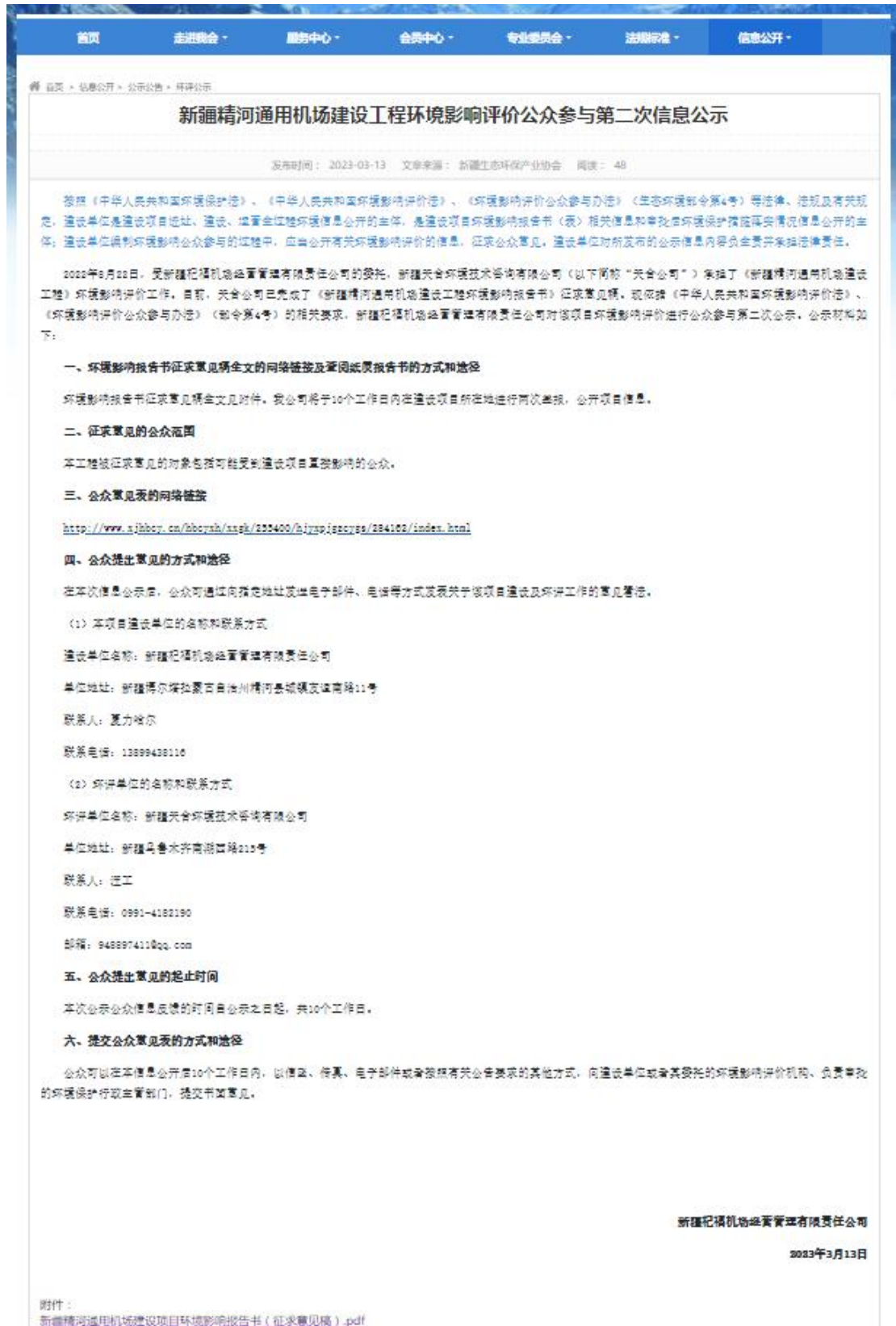
图 3.2-1 本项目征求意见稿网络公示截图