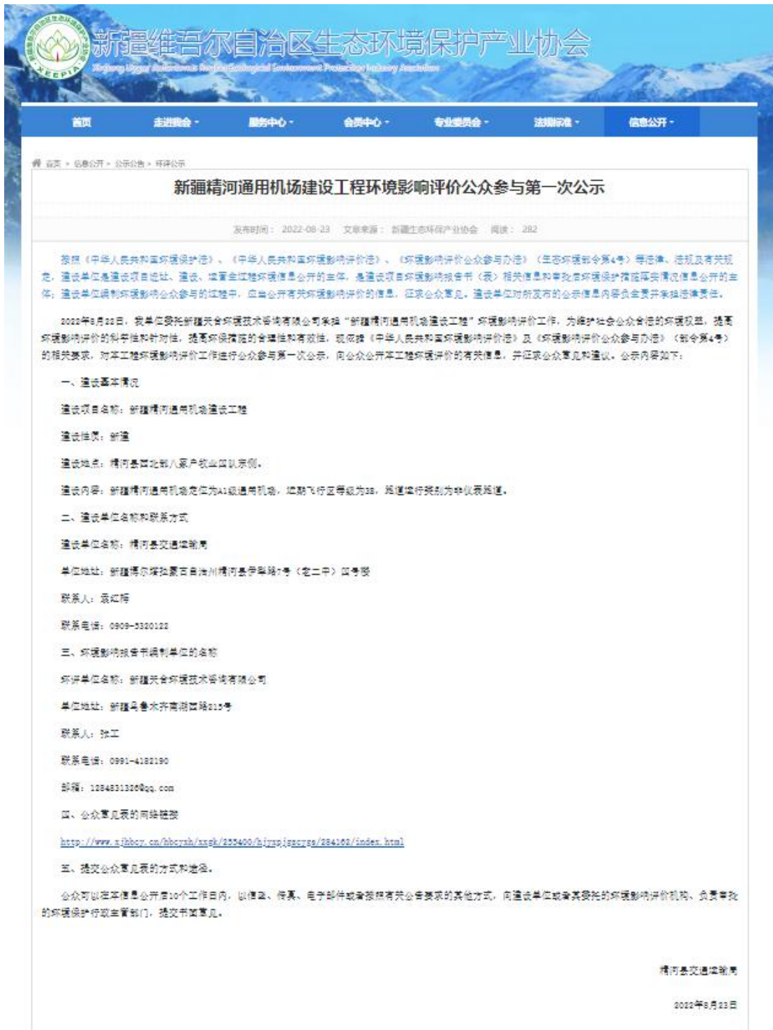
图 2.2-1 本项目第一次网络公示截图