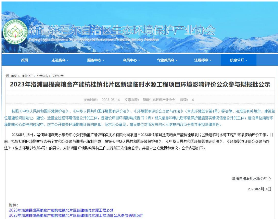
图 6 报批前网络公示截图