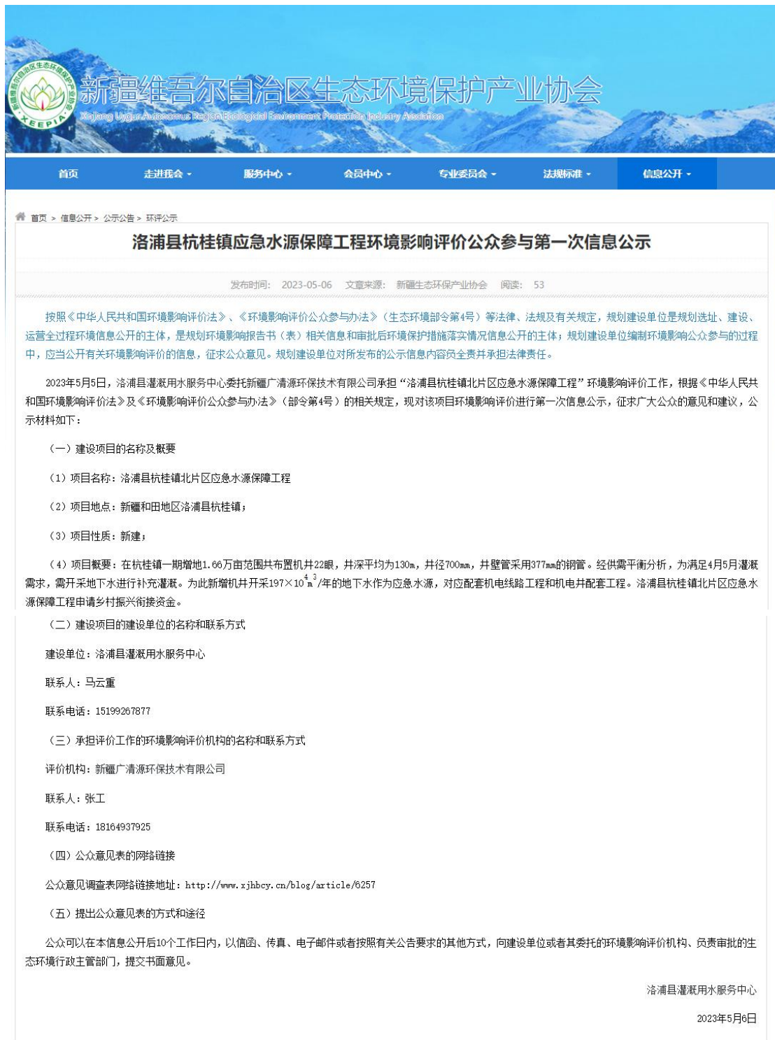
图 1 首次网络公示截图