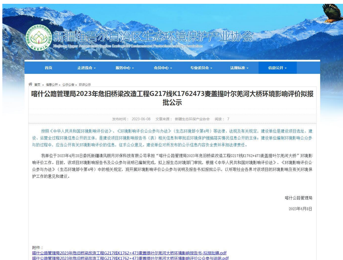
图 6.2.1 网上公示截图