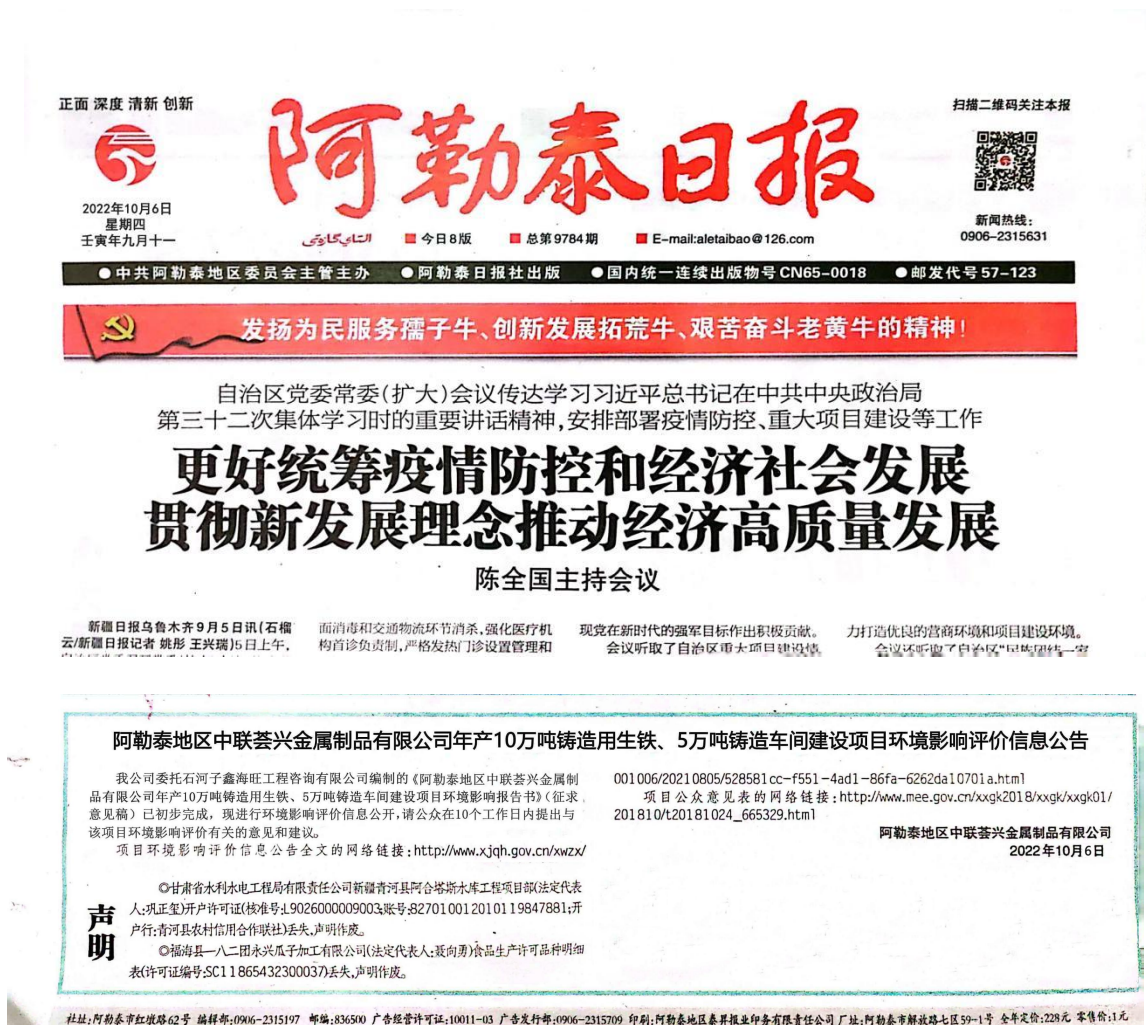
图 3.2-2 2022 年 10 月 6 日报纸公示截图