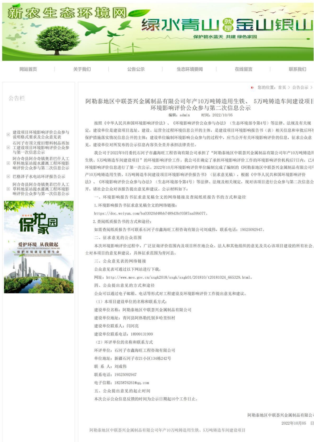
图 3.2-1 征求意见稿网上公示截图

http://www.xnsthj.cn/gonggao/186.html 网页截图见图 3.2-1。