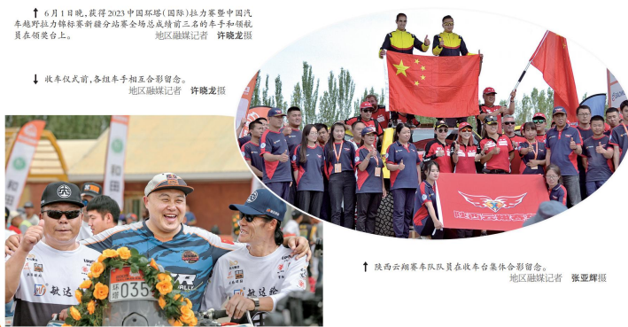
↓收车仪式前,各组车手相互合影留念。