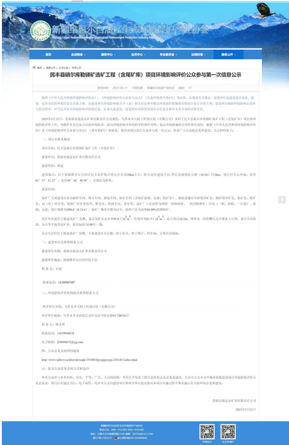
图 2.2-1 第一次网站公示截图