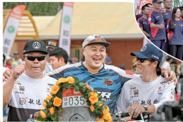
陕西云翔赛车队队员在收车台合影留念。