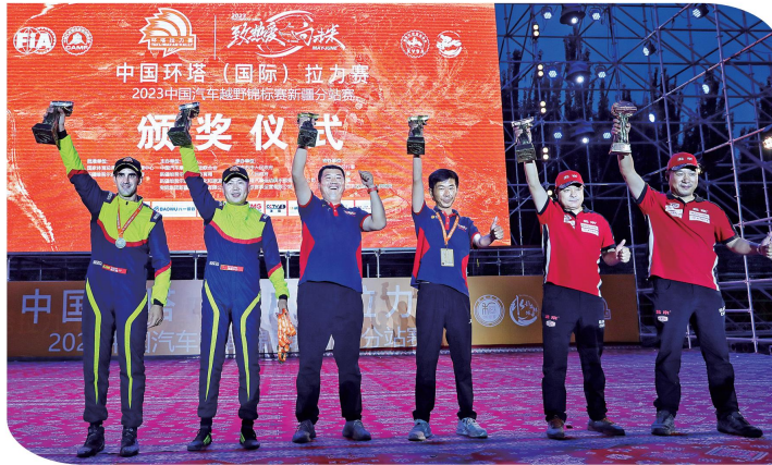
6月1日晚,获得2023中国环塔(国际)拉力赛暨中国汽车越野拉力锦标赛新疆分站赛全场总成绩前三名的车手和领航员在领奖台上。