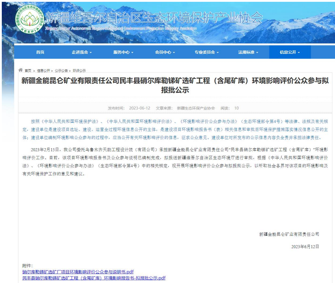
图6.2-1 拟报批公示截图

2023年06月12日，我公司就本项目环境影响评价拟报批信息在新疆维吾尔自治区生态环境保护产业协会网站（ http://www.xjhbcy.cn/ ）进行了公示，见图6.2-1。