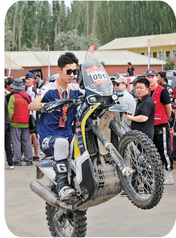
6月1日,在和田市大漠胡杨景区举行的收车仪式上,一名摩托车手放下赛车台车技。